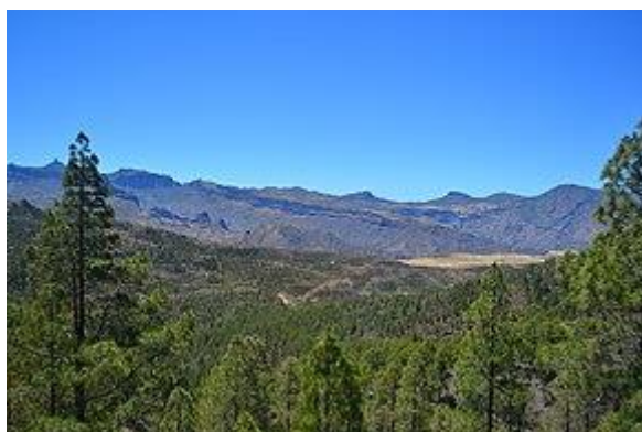
Ilustración 1. Parque Natural Tamadaba.