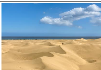
Ilustración 3. Desierto y oasis de las Dunas de Maspalomas. Fuente: Wikipedia