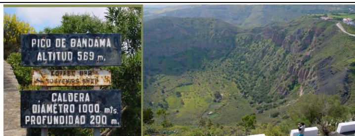
Ilustración 4. Caldera de Bandama.