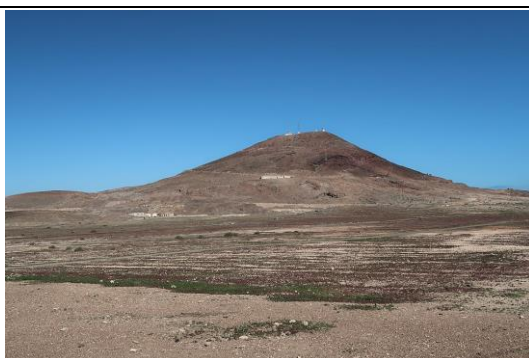
Ilustración 5. Monumento Natural Montaña de Arinaga.