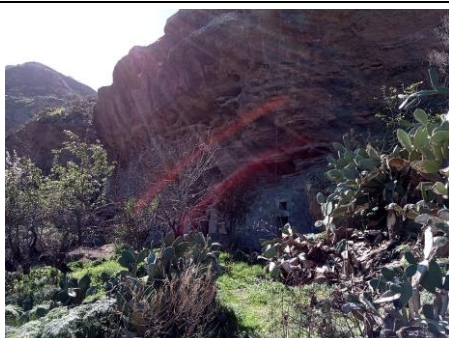
Ilustración 6. Risco Caído y Montañas Sagradas.