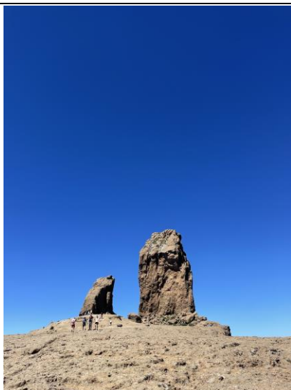
Ilustración 2. Parque Rural del Roque Nublo.