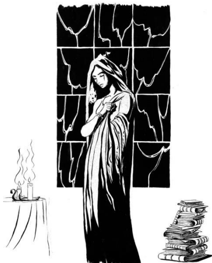
Ilustración 3 del relato: El velo negro