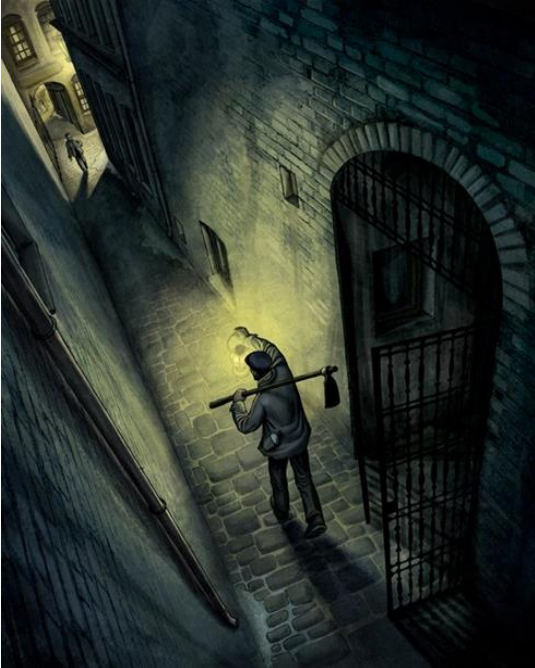
Ilustración 1 del relato: La historia de los duendes que secuestraron a un enterrador