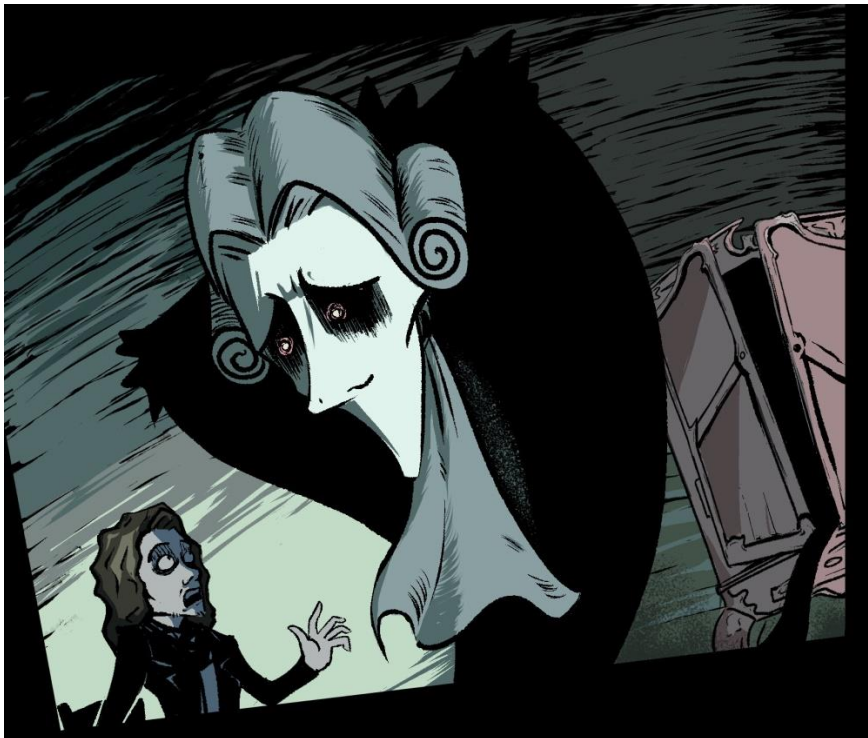
Ilustración 6 del relato: El letrado y el fantasma