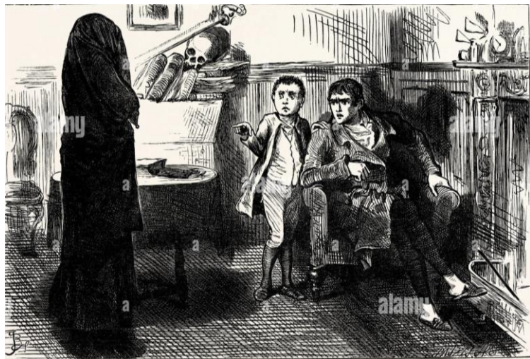
Ilustración 4 del relato: El velo negro