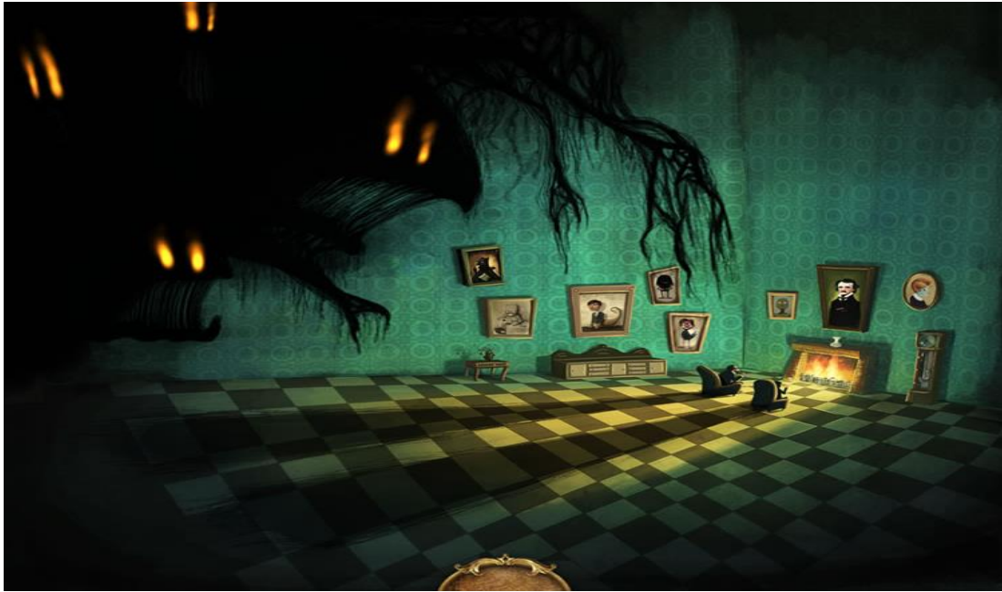
Ilustración 5 del relato: El letrado y el fantasma