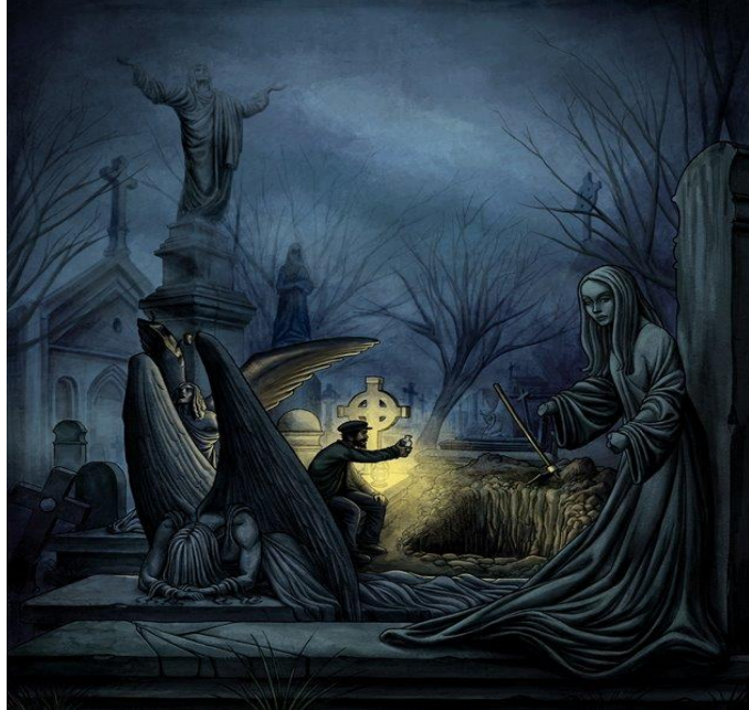
Ilustración 2 del relato: La historia de los duende que secuestraron a un enterrador