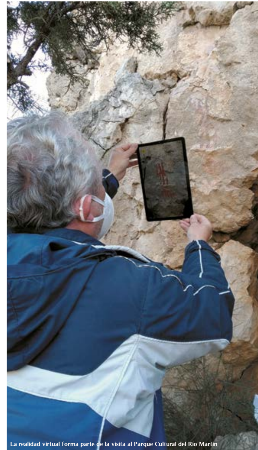
La realidad virtual forma parte de la visita al Parque Cultural del Río Martín

para admirar los colores con la misma intensidad que tuvieron en la prehistoria