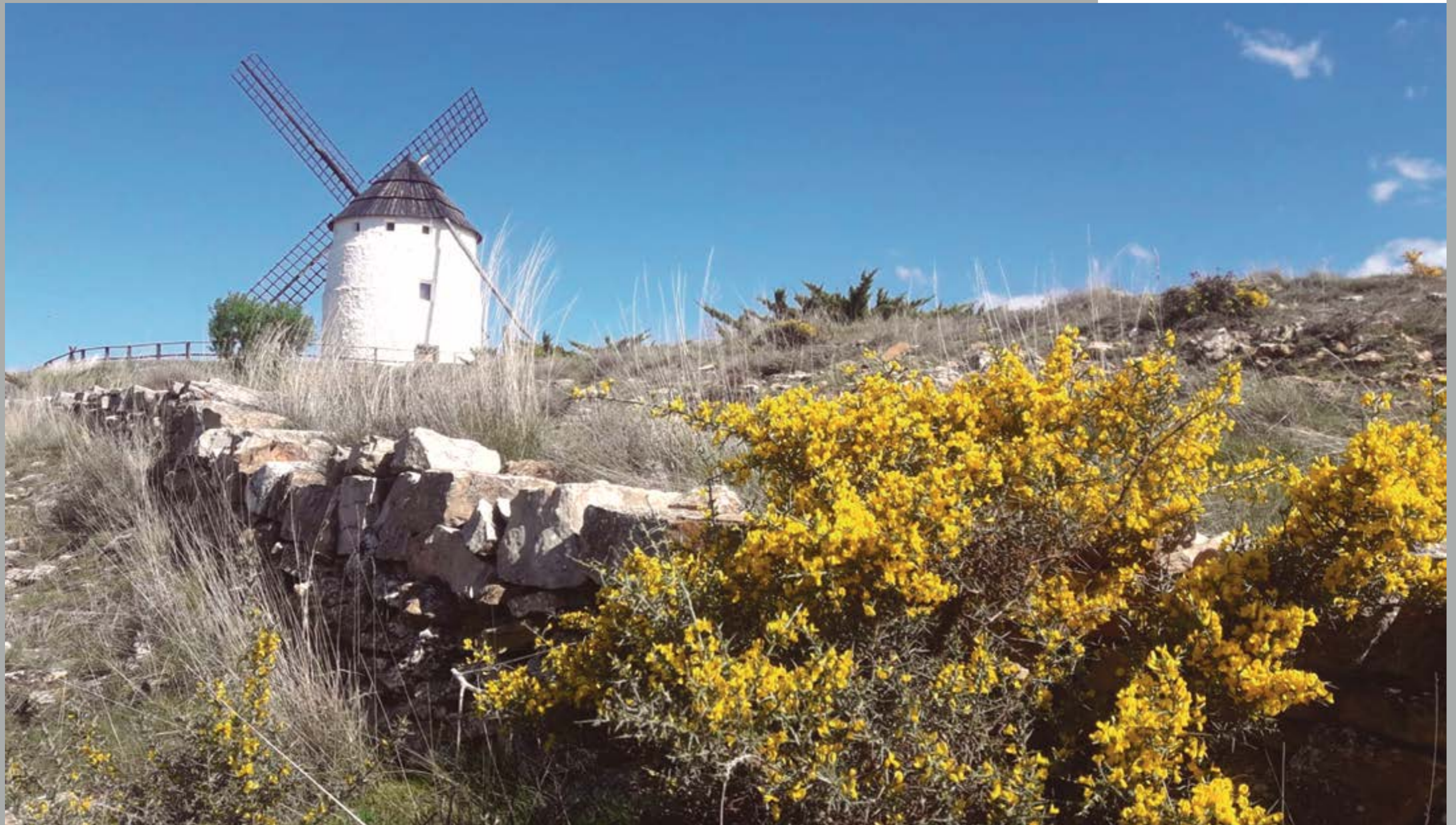
Molino de Ojos Negros. Pili Villén

Superficie: 1.932,34 km 2 Población: 12.264 habitantes