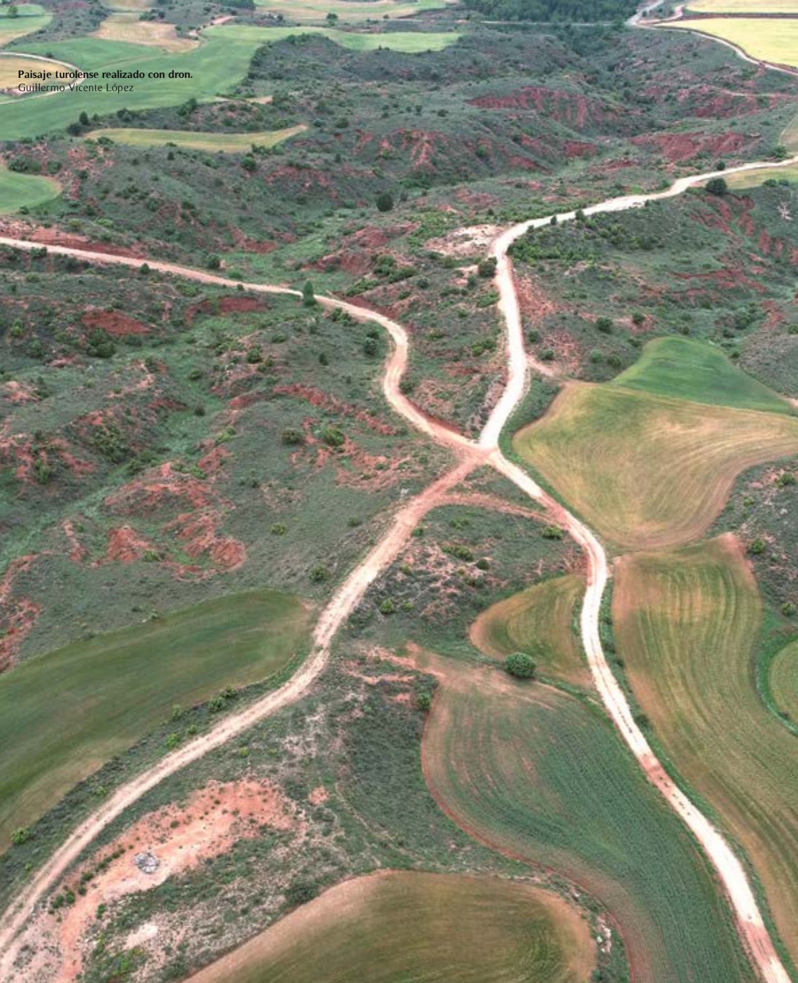
Paisaje turoense realizado con dron. Guillermo Vicente López