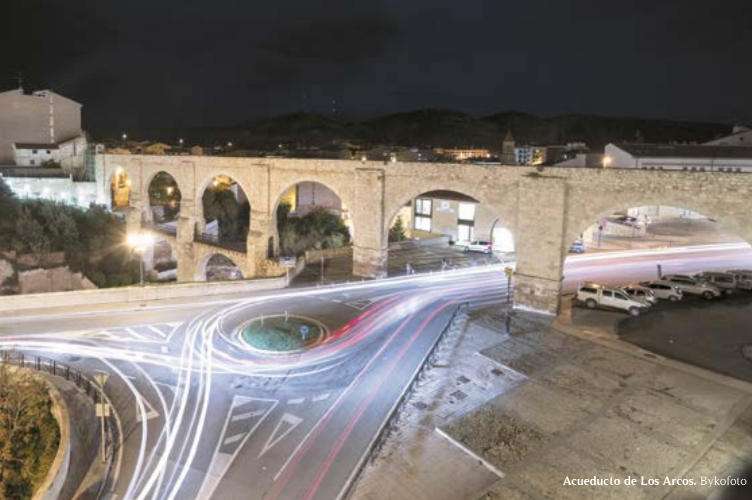
Acueducto de Los Arcos.