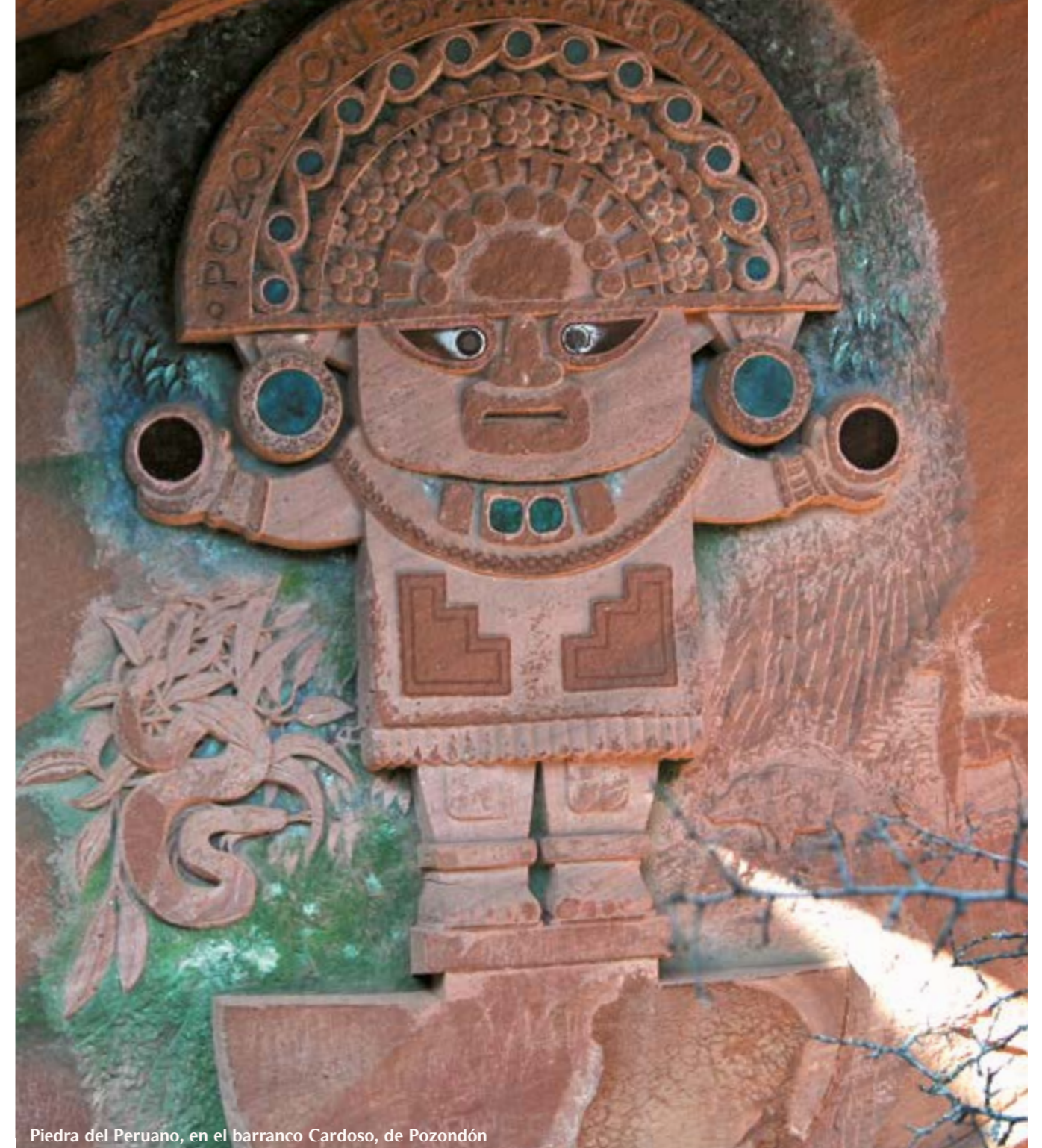
Piedra del Peruano, en el barranco Cardoso, de Pozondón