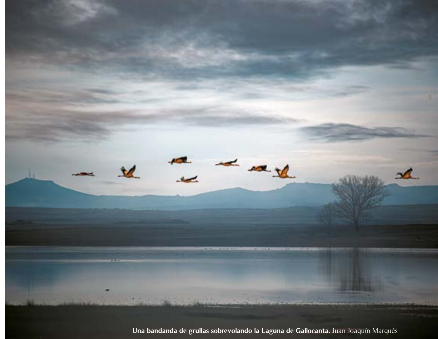
Una bandada de grullas sobrevolando la Laguna de Gallocanta. Juan Joaquín Marqués

El yacimiento de La Caridad es uno de los más relevantes de Teruel. Las excavaciones se iniciaron hace décadas pero solo se ha actuado en una hectárea de las casi 12 de extensión que tenía la ciudad. Ubicada en el paraje de La Caridad de Caminreal —el nombre original se desconoce— fue fundada por los romanos, pero estuvo ocupada también por íberos.