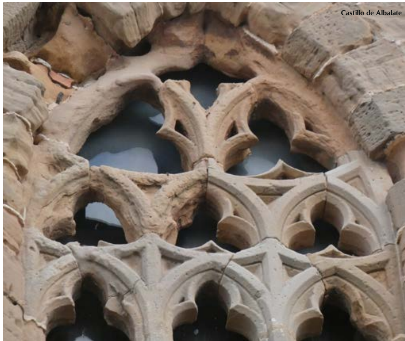
Castillo de Albalate