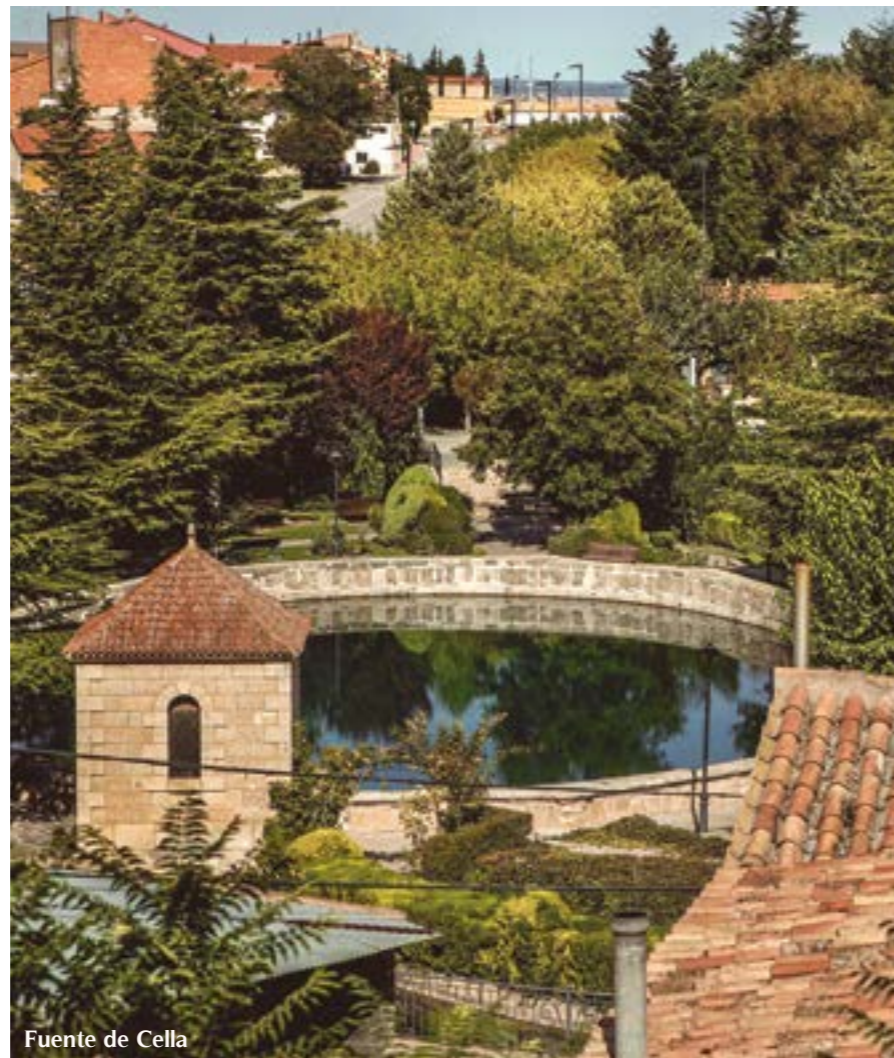
Fuente de Cella