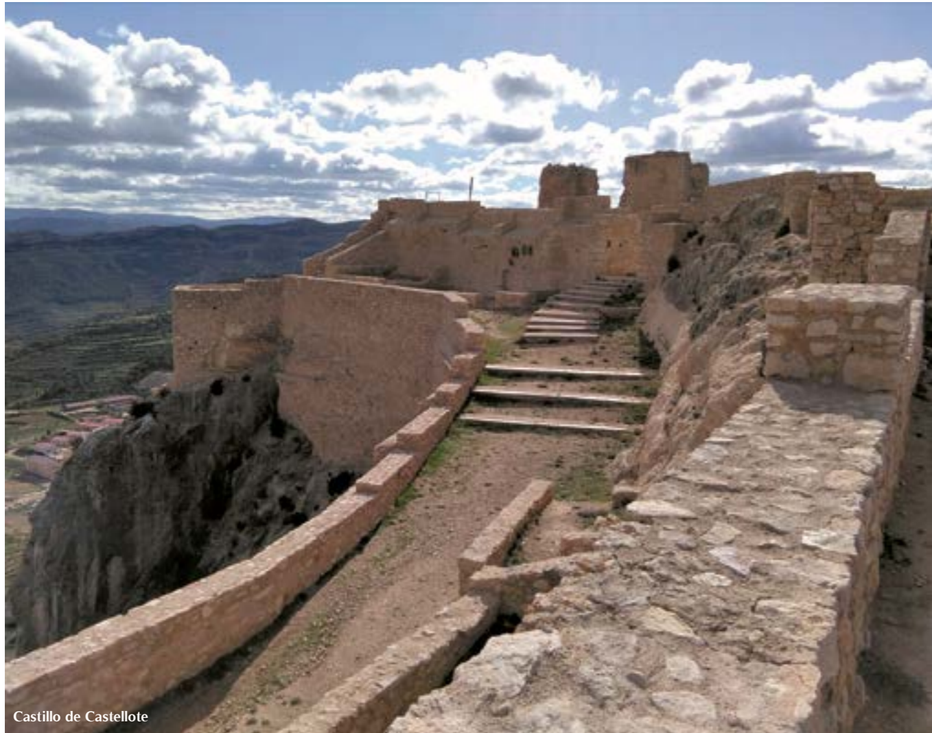
Castillo de Castellote