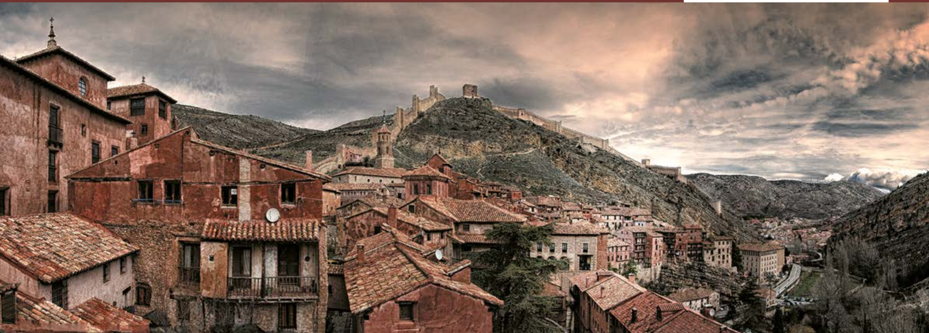
Vista panorámica de la ciudad de Albarracín. Henk Schreurs

Superficie: 1.414,12 km 2 Población: 4.307 habitantes