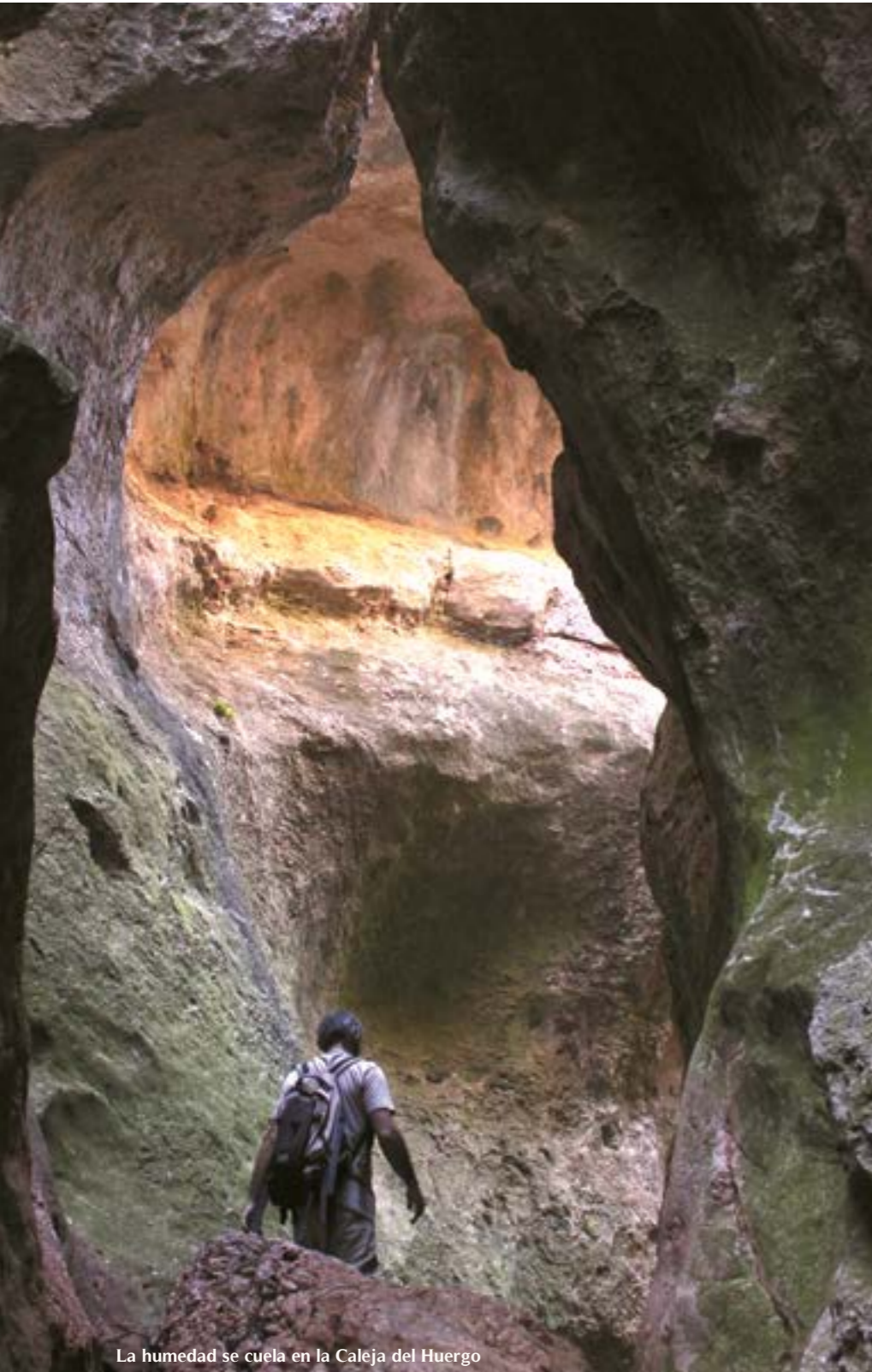
La humedad se cuelga en la Caleja del Huergo

en la ruta de la Caleja del Huergo, en Ejulve