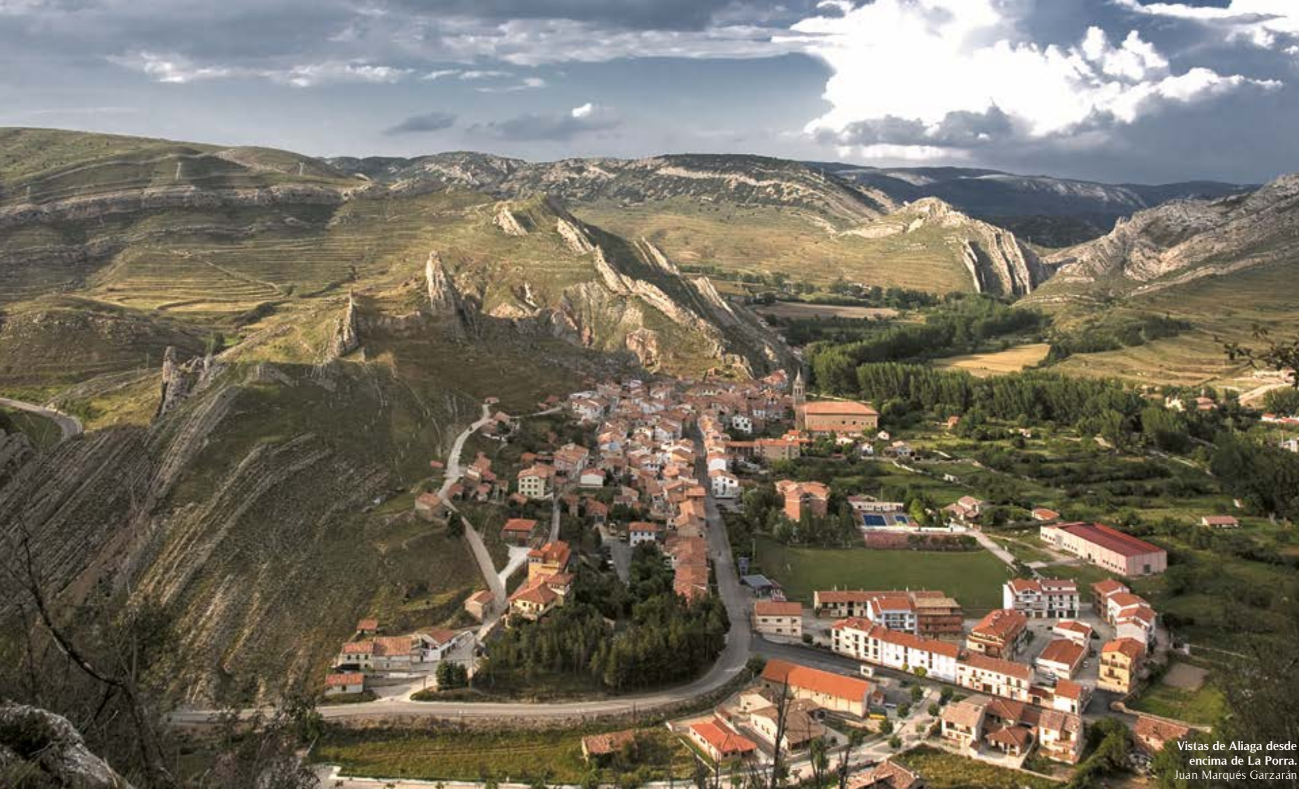
Vistas de Aliaga desde encima de La Porra. Juan Marqués Garzarán