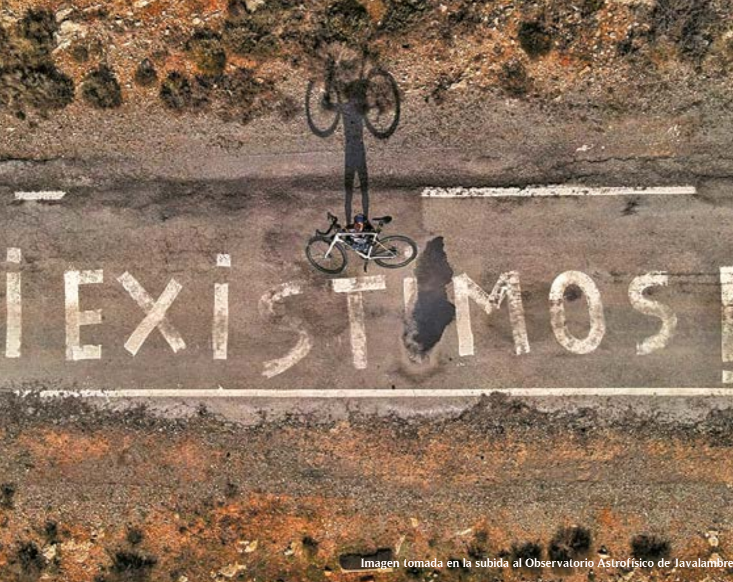
Imagen tomada en la subida al Observatorio Astrofísico de Javalambre