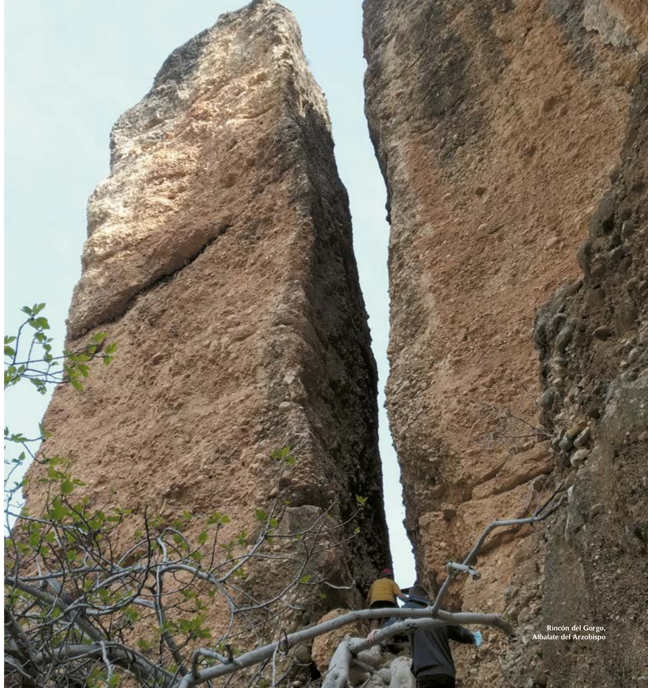
Rincón del Gorgo, Albalate del Arzobispo

Este espacio natural es uno de los barrancos del río Martín y forma parte del Parque Cultural, caracterizado por los múltiples abrigos rupestres que lo jalonan. Otra una buena ruta para acercarse a algunos de ellos es la de los Estrechos, también en Albalate, que además muestra algunos de los rincones más pintorescos del esta zona.