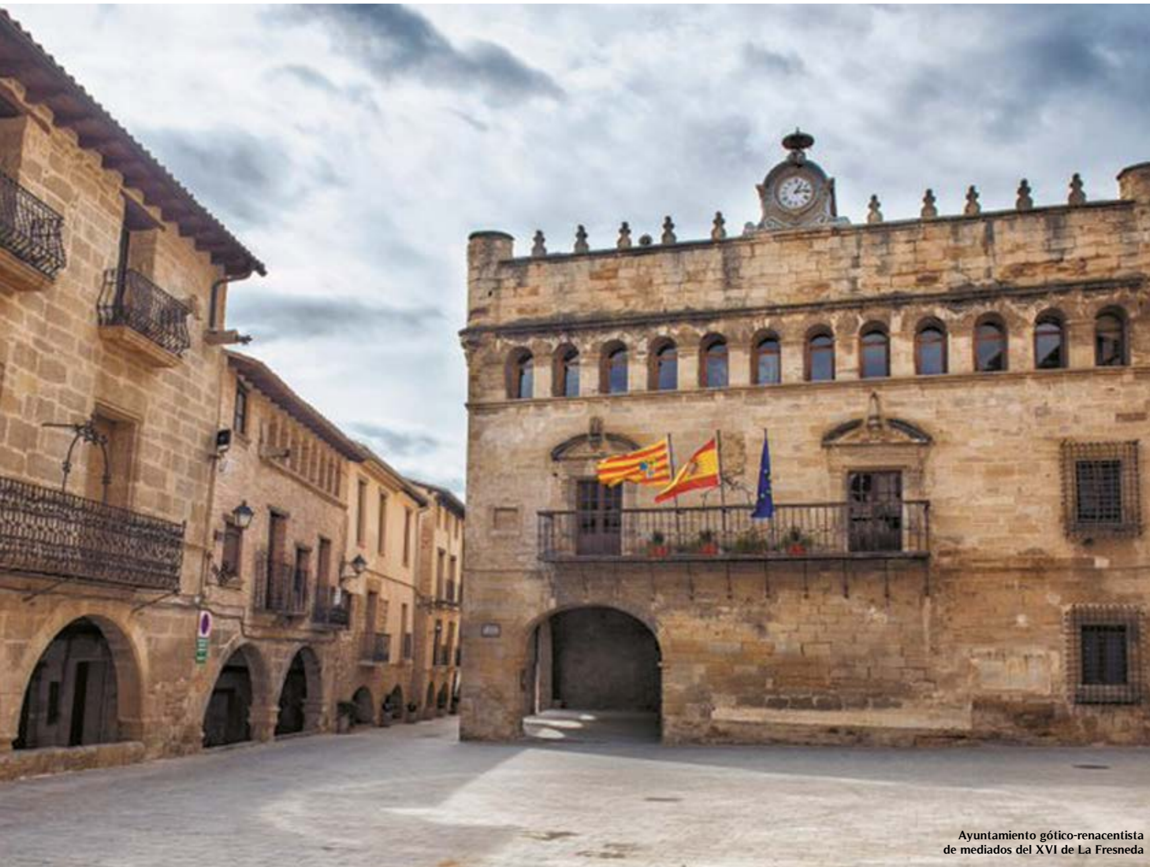
Ayuntamiento gótico-renacentista de mediados del XVI de La Fresneda