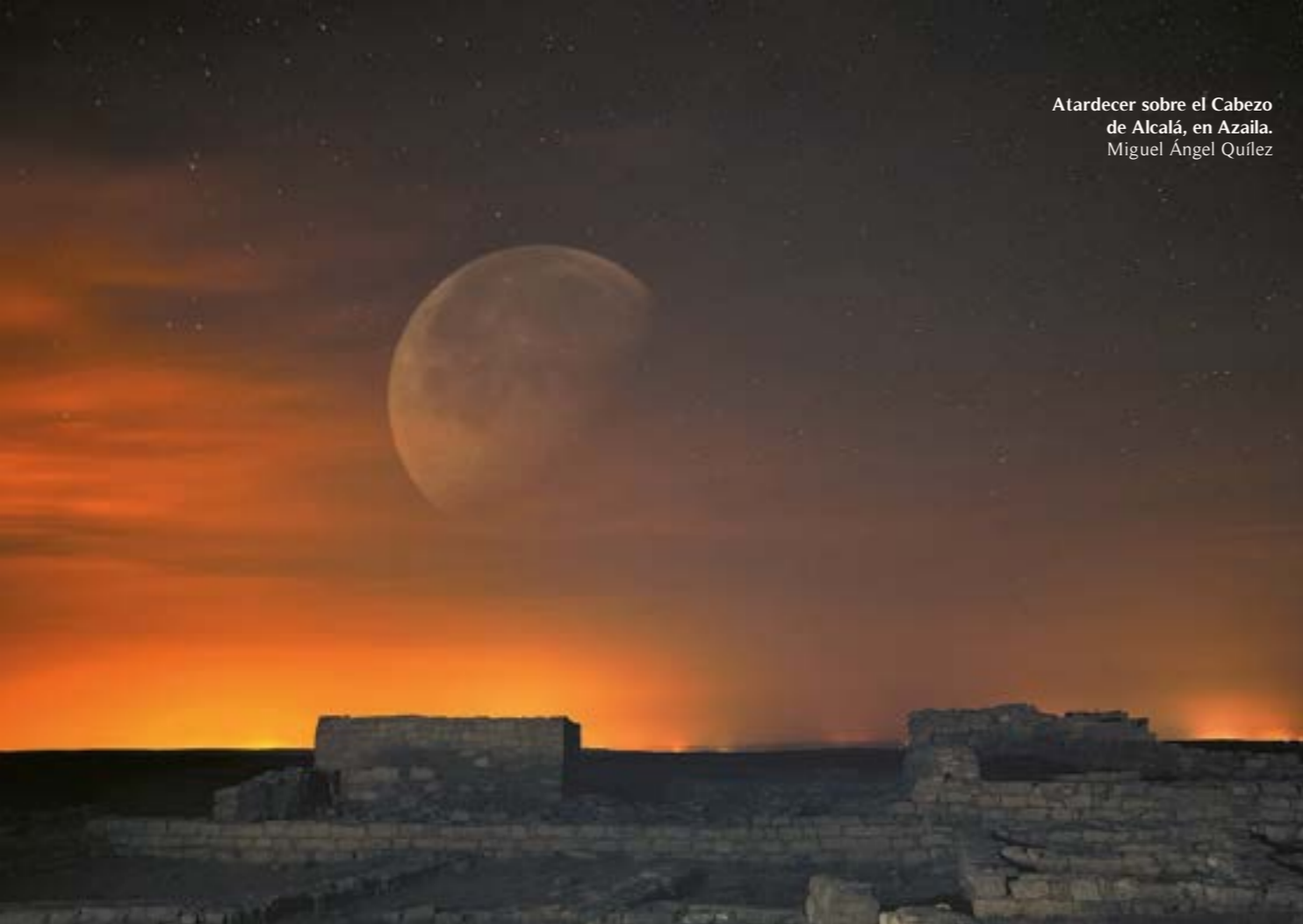
Atardecer sobre el Cabezo de Alcalá, en Azaila. Miguel Ángel Quílez