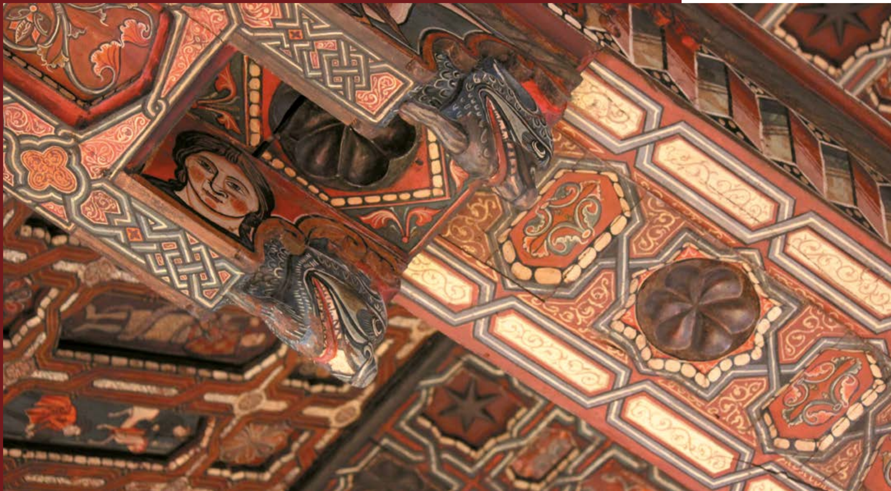
Techumbre mudéjar de la Catedral de Teruel. Cappa Segis