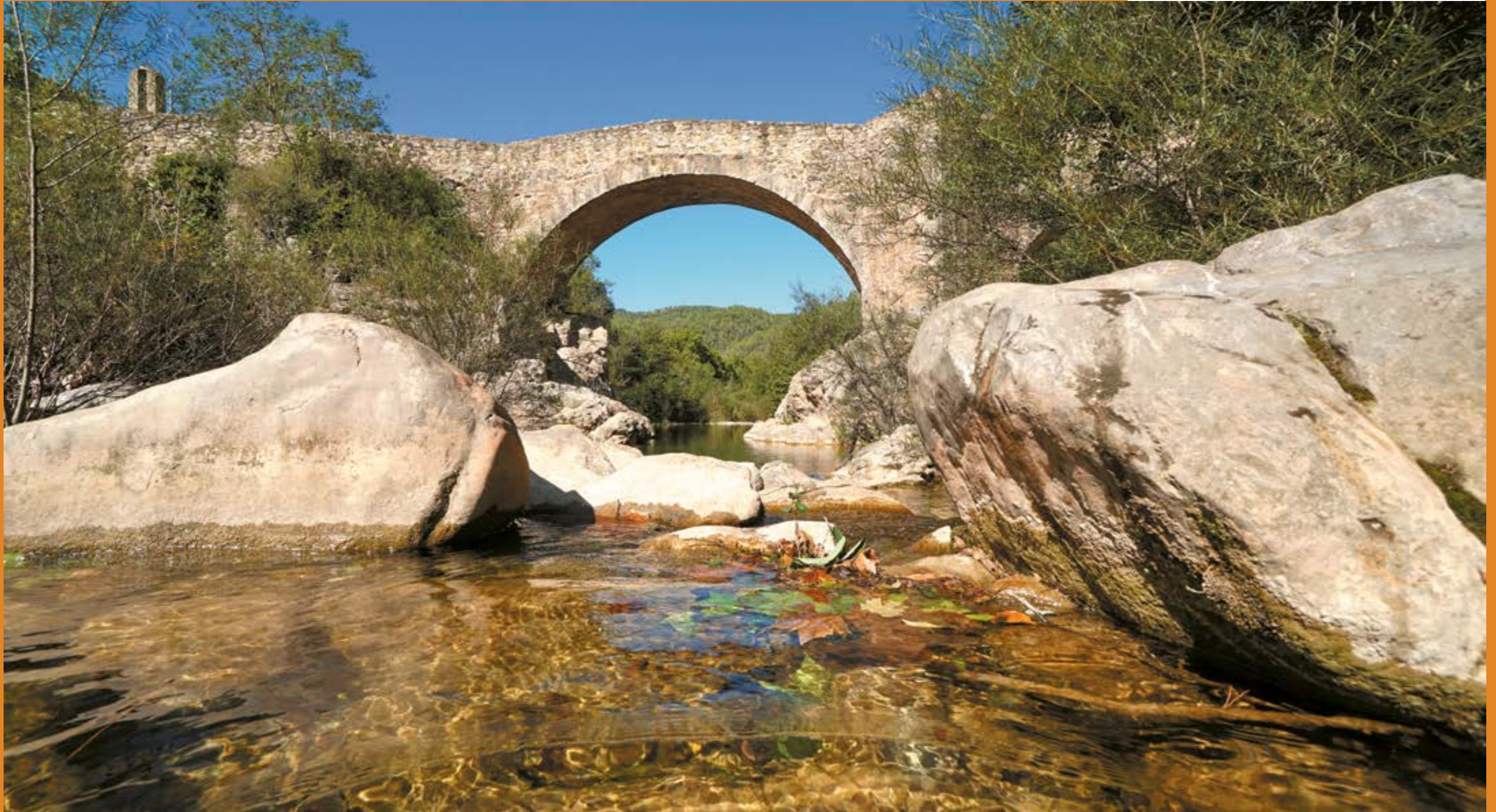
Puente de Cananillas, Rio Bergantes