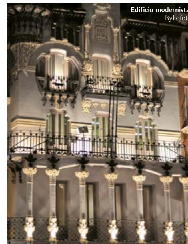
Edificio modernista. Bykofoto

Además, dos modernos ascensores conectan los barrios de menor altitud con el centro histórico en un nuevo intento por ajustar el urbanismo a las necesidades de los turolenses.