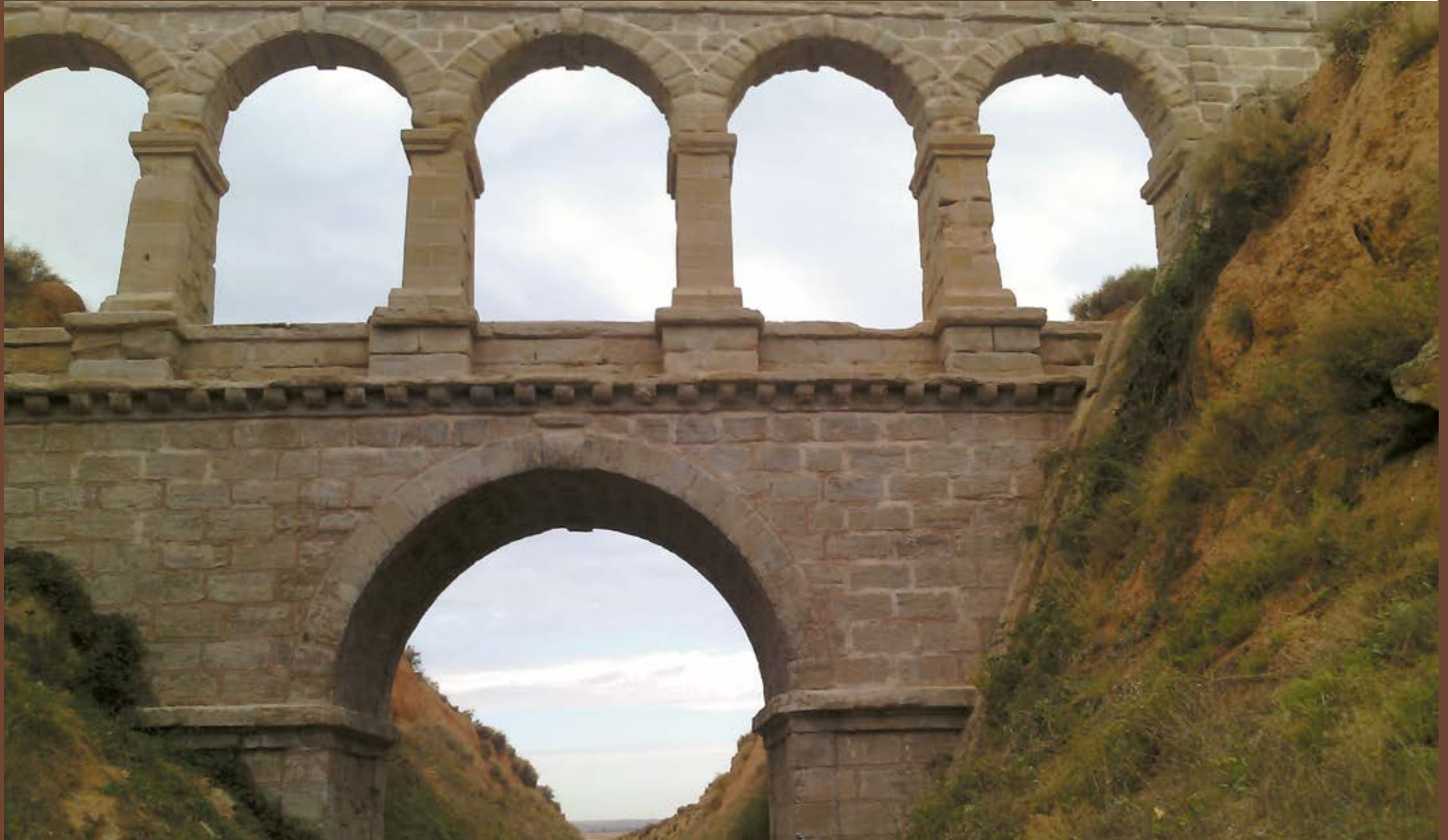
Acueducto de Torica, Vía de Zafán

Superficie: 1.304,18 km 2 Población: 6.303 habitantes