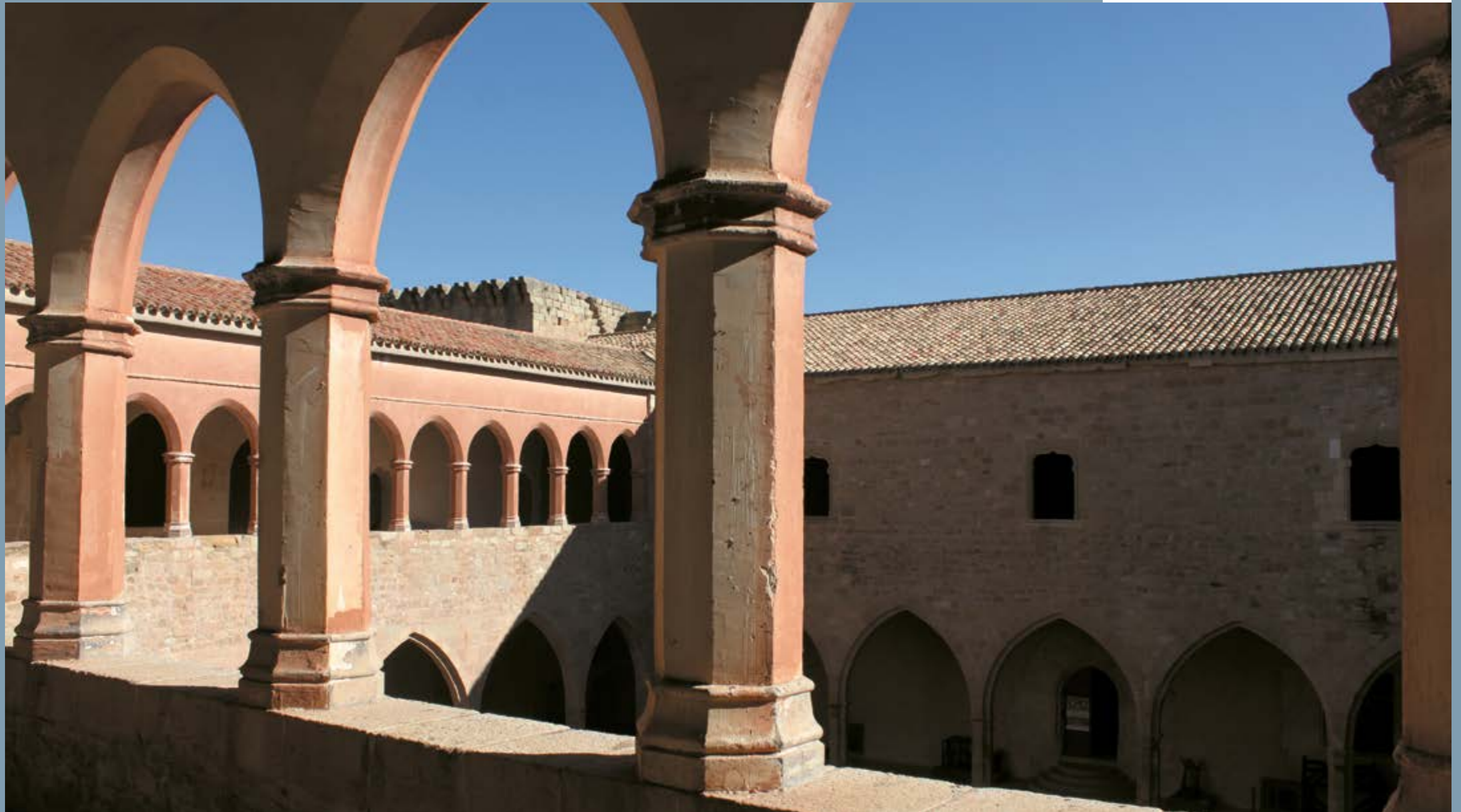
Interior del Castillo de Mora de Rubielos