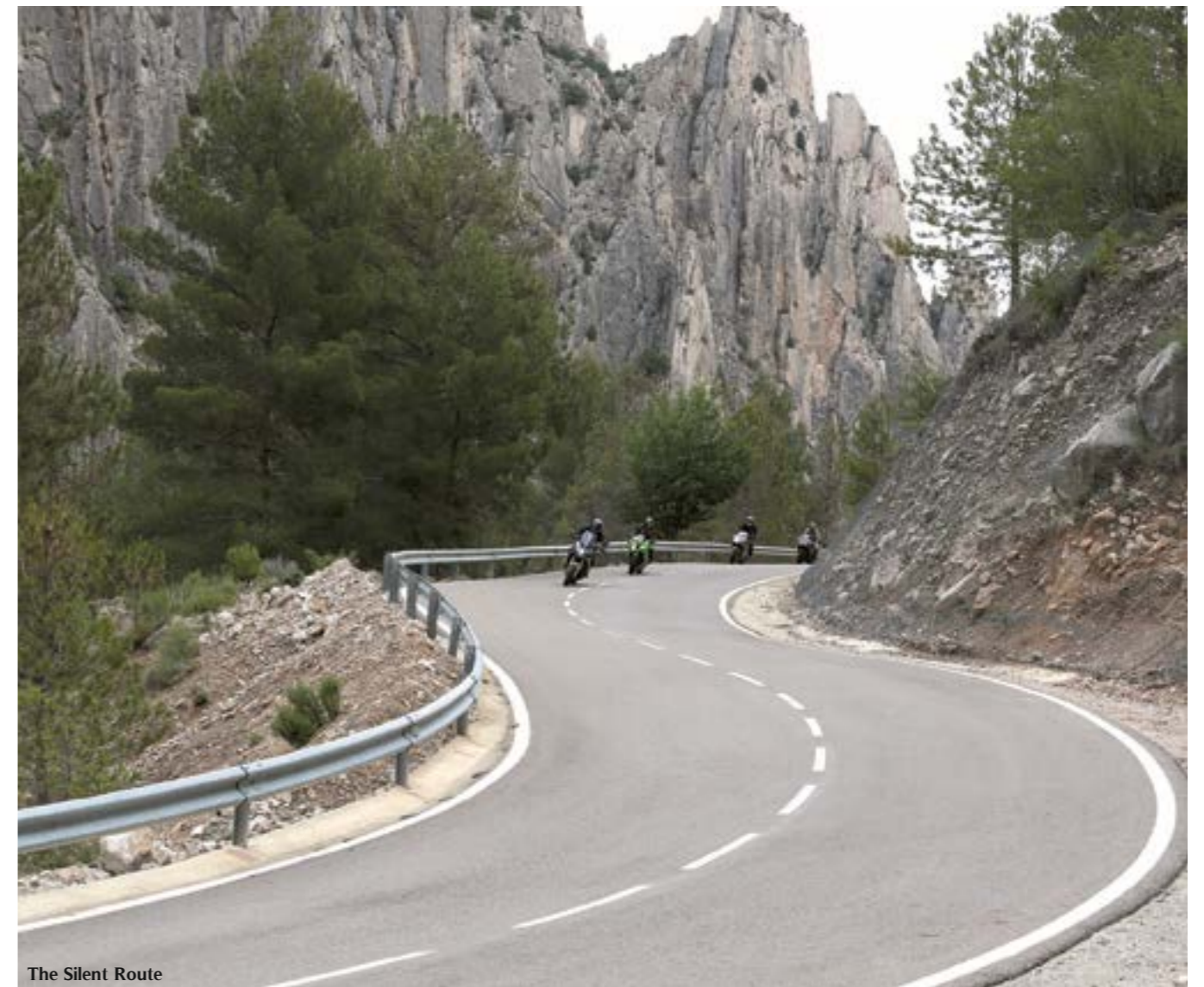
The Silent Route

recorrida o la velocidad, sino disfrutar del momento y la compañía, que no siempre es humana. Cabras, buitres leonados o vacas son algunos de los animales que es posible admirar desde la calzada. Los campos cultivados de cereal, con decorativas pacas de paja durante el verano, alternan con la naturaleza abrupta de cañones o cortados. Desde la A-1702 es posible hacerse fotos con el gran logo instalado en uno de los miradores, observar los Órganos de Montoro o pasar por debajo de los puentes de piedra de Itarque que ya son tan escasos en las carreteras españolas.