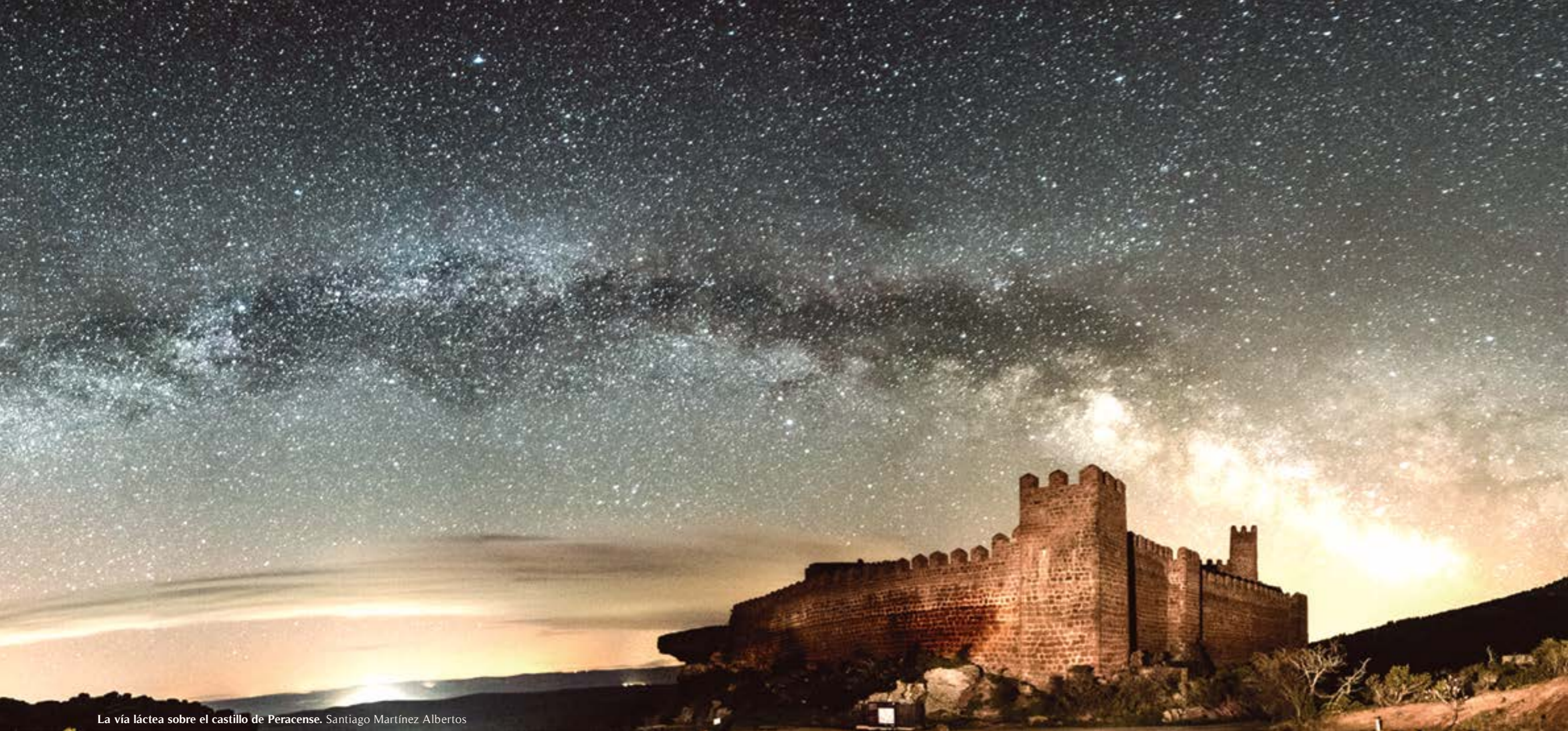
La vía láctea sobre el castillo de Peracense. Santiago Martínez Albertos