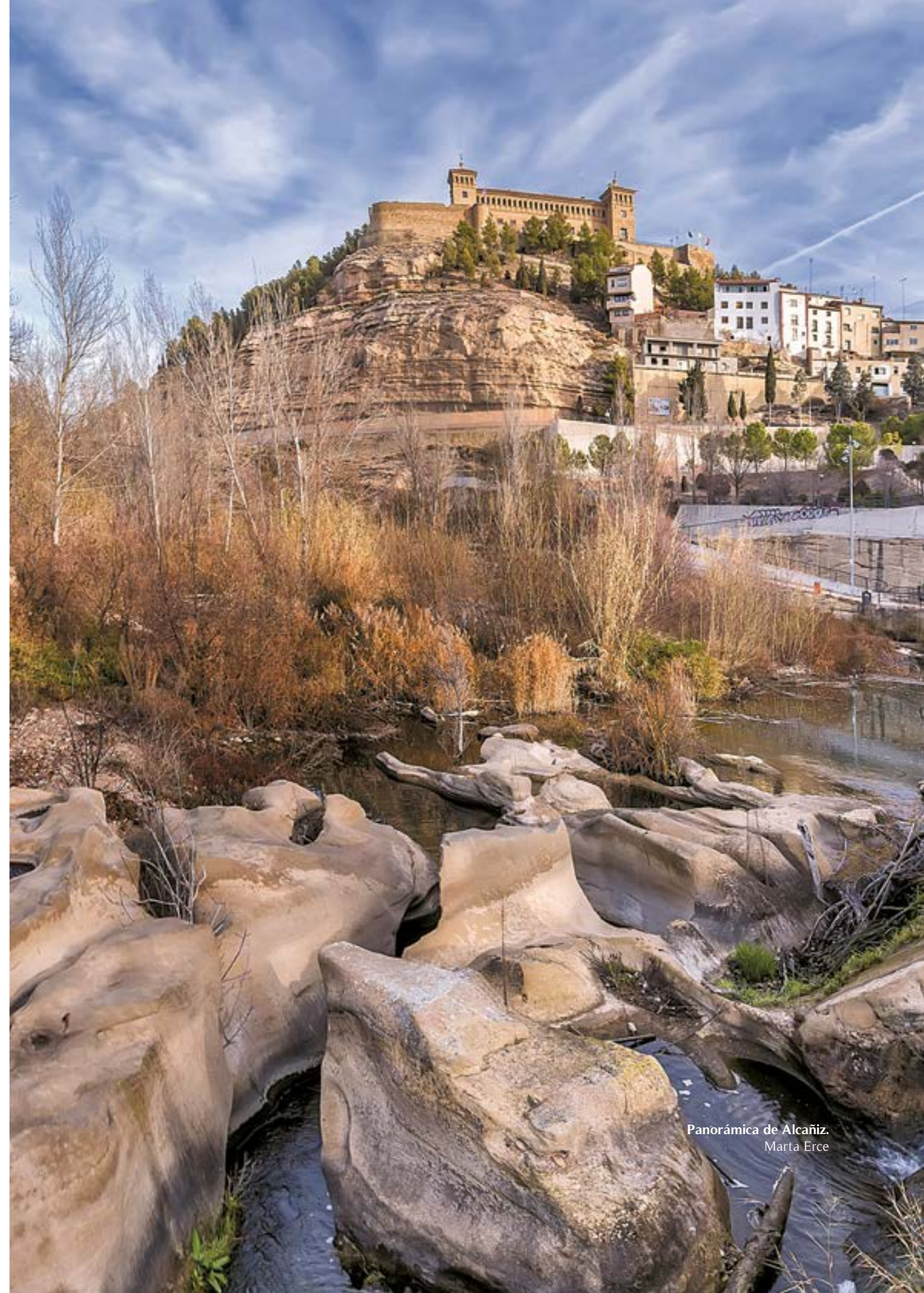
Panorámica de Alcañiz. Marta Erce

Uno de los actos más tradicionales de Alcañiz es el Vencimiento del Dragón a manos de San Jorge, un evento que tiene lugar el 23 de abril, día regional de Aragón. Se trata de un evento original, aunque menos multitudinario que la Semana Santa de la capital bajoaragonesa. Alcañiz forma parte de la Ruta del Tambor y del Bombo y sus procesiones se caracterizan por el silencio y el fervor religioso.