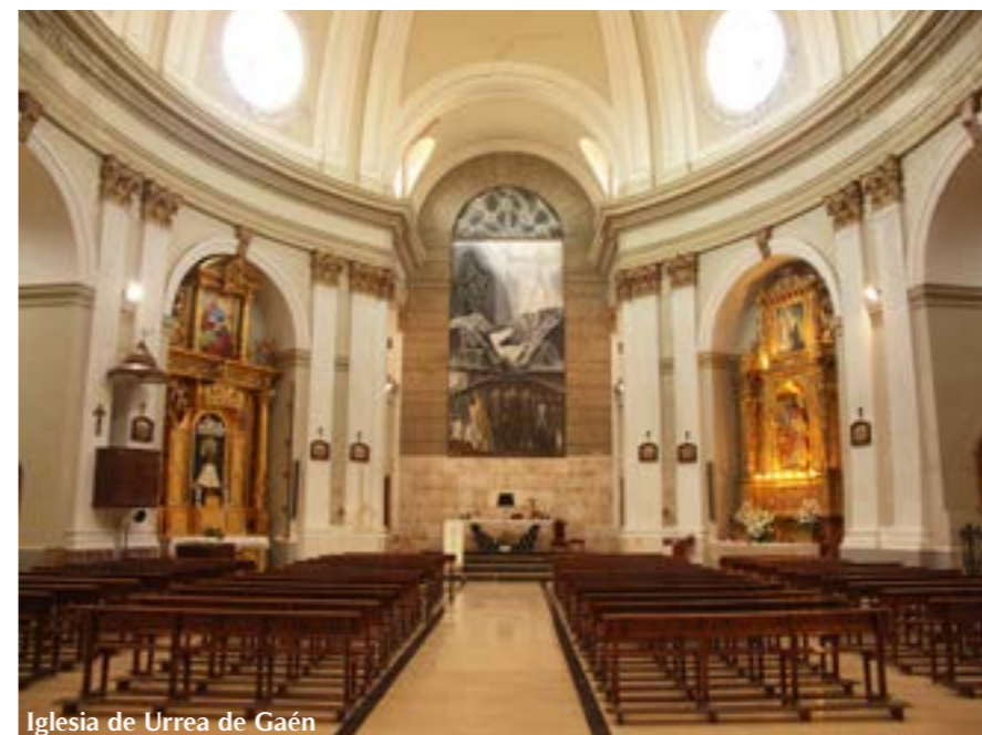
Iglesia de Urrea de Gaén

Agustín Sanz dejó su monumental impronta