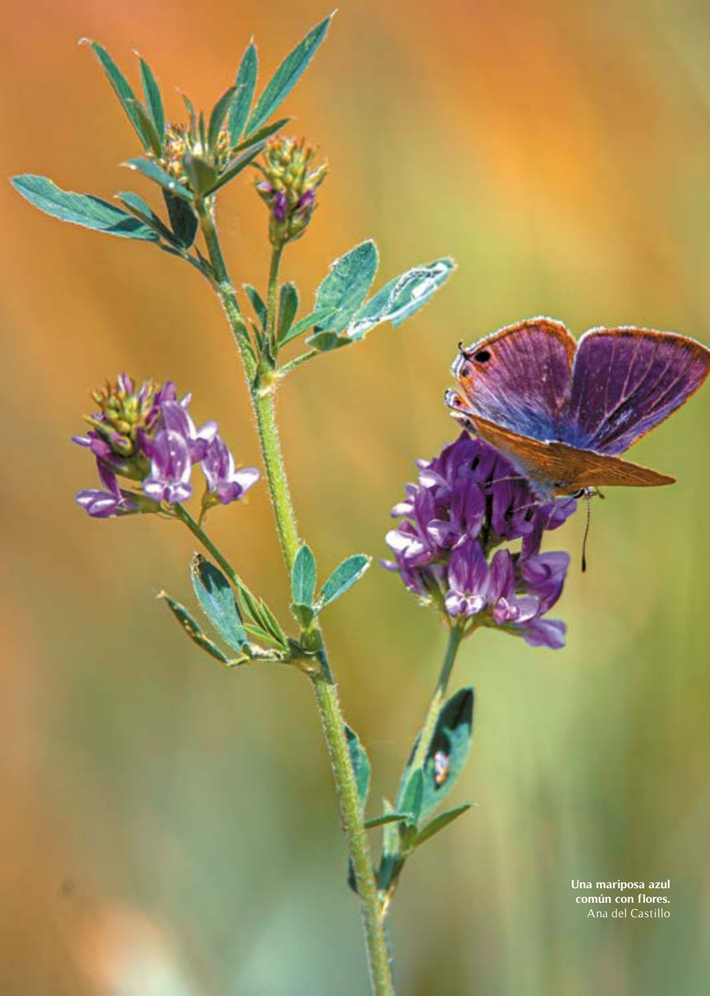
Una mariposa azul común con flores.