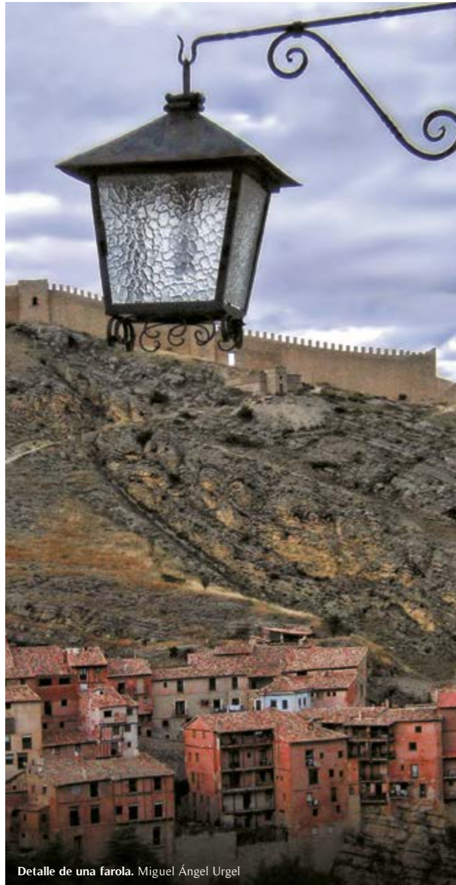
Detalle de una farola. Miguel Ángel Urgel

La ciudad cuenta además con varios museos de gran interés. El Museo de Albarracín permite conocer el desarrollo de la ciudad desde que estuvo en manos de los musulmanes hasta prácticamente la actualidad. En la Torre Blanca, situada junto al antiguo cementerio, es posible admirar algunas de las obras punteras del arte contemporáneo, ya que es una sala de exposiciones temporales.