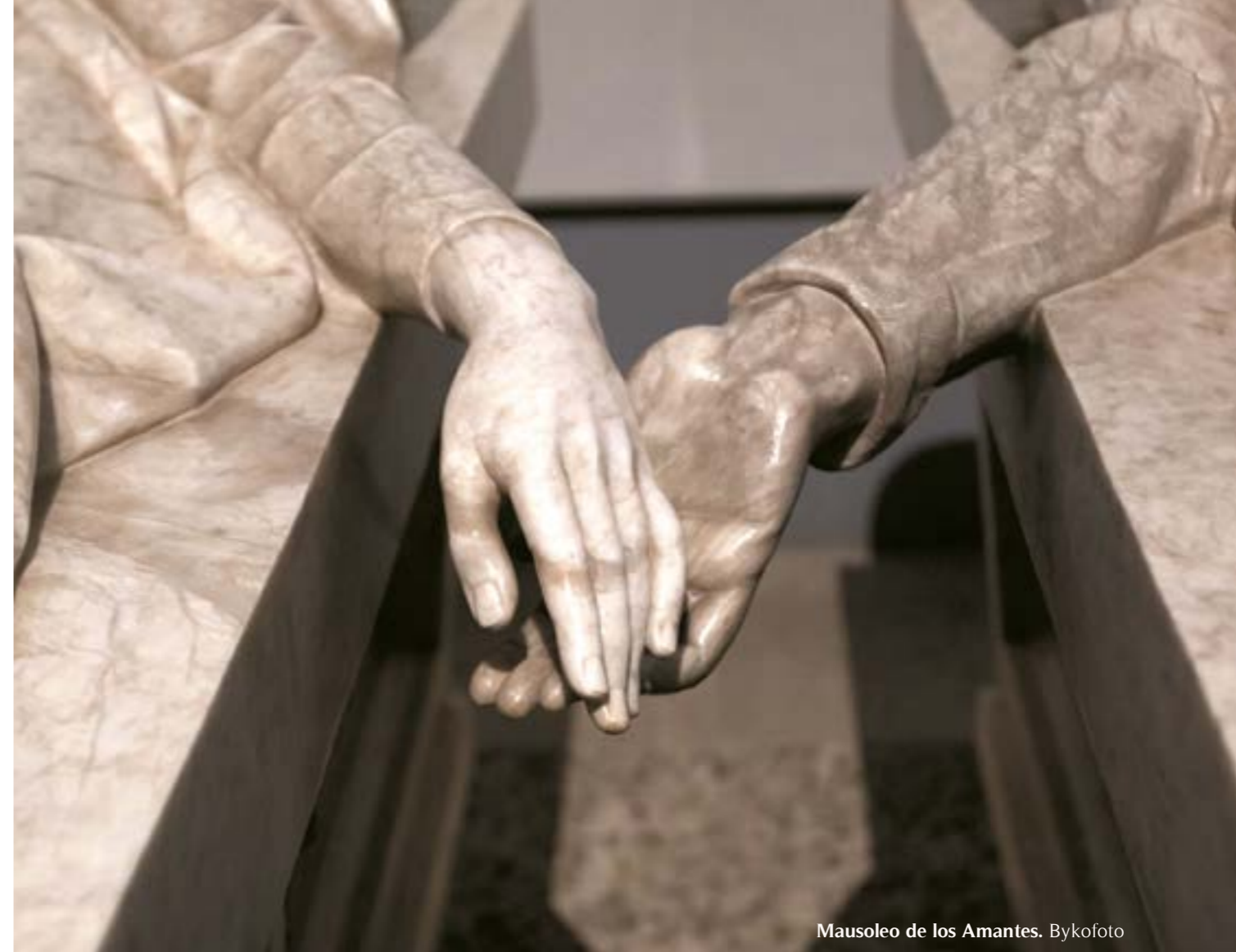
Mausoleo de los Amantes.