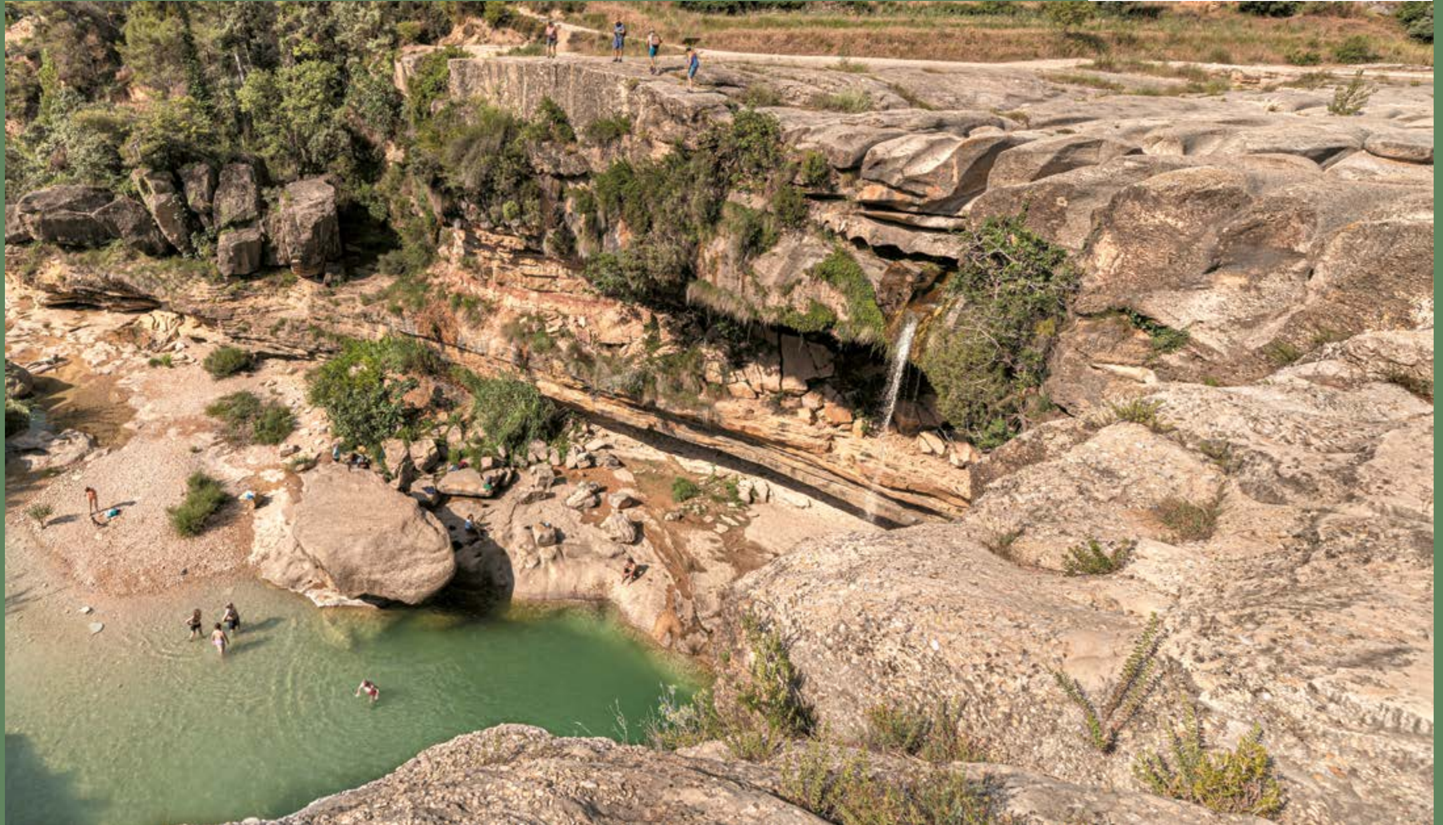
Cascada de La Portellada, río Tastavins. Joe McUbed

Superficie: 933,07 km 2 Población: 8.257 habitantes