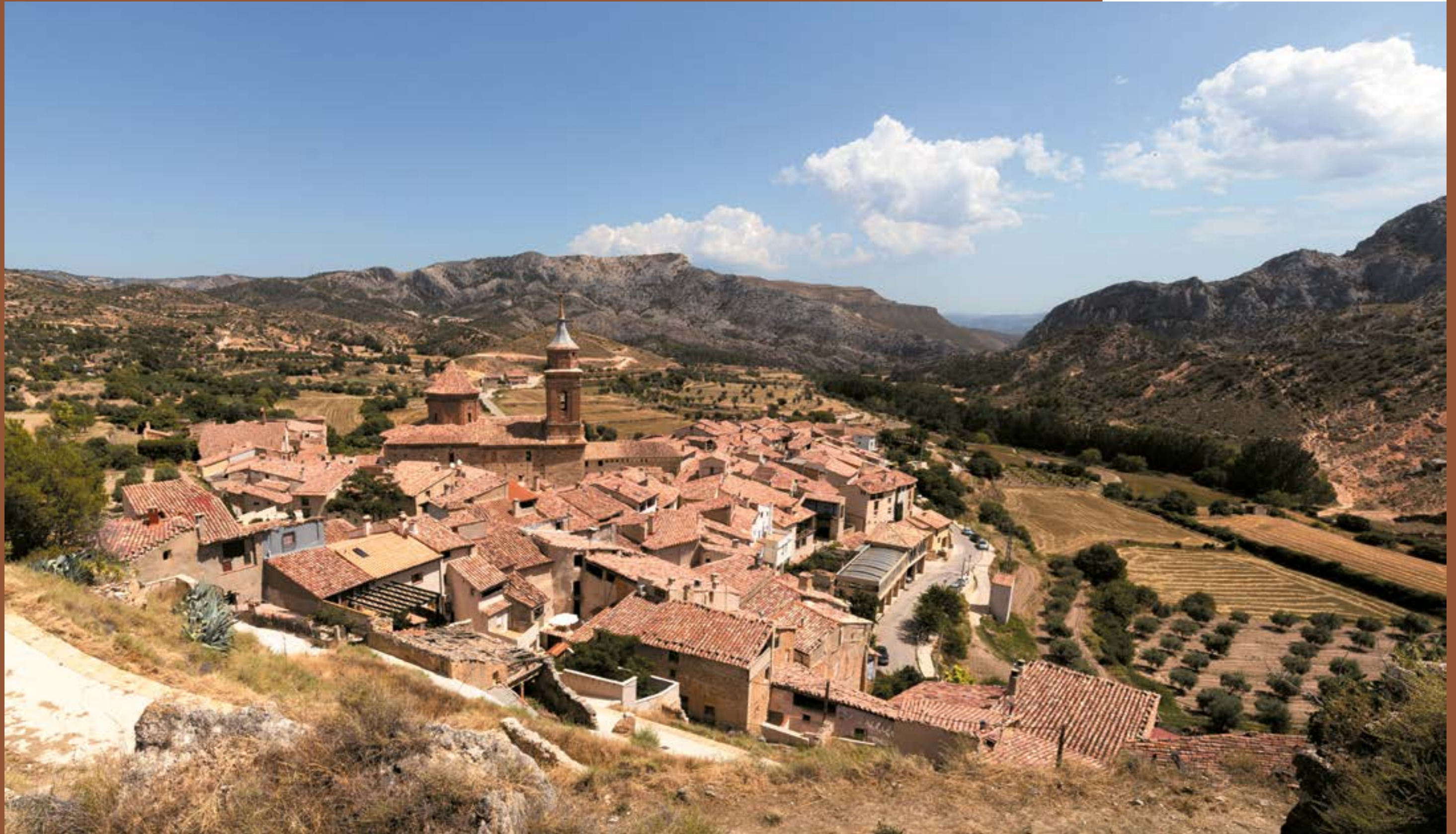
Cuevas de Cañart.

Superficie: 1.204,25 km 2 Población: 3213 habitantes