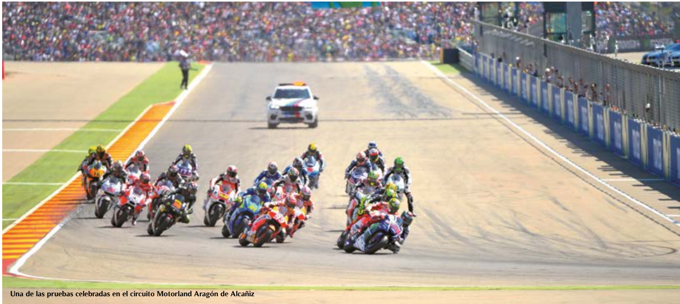
Una de las pruebas celebradas en el circuito Motorland Aragón de Alcañiz

Motorland Aragón, en Alcañiz acoge tanto pruebas profesionales como de aficionados