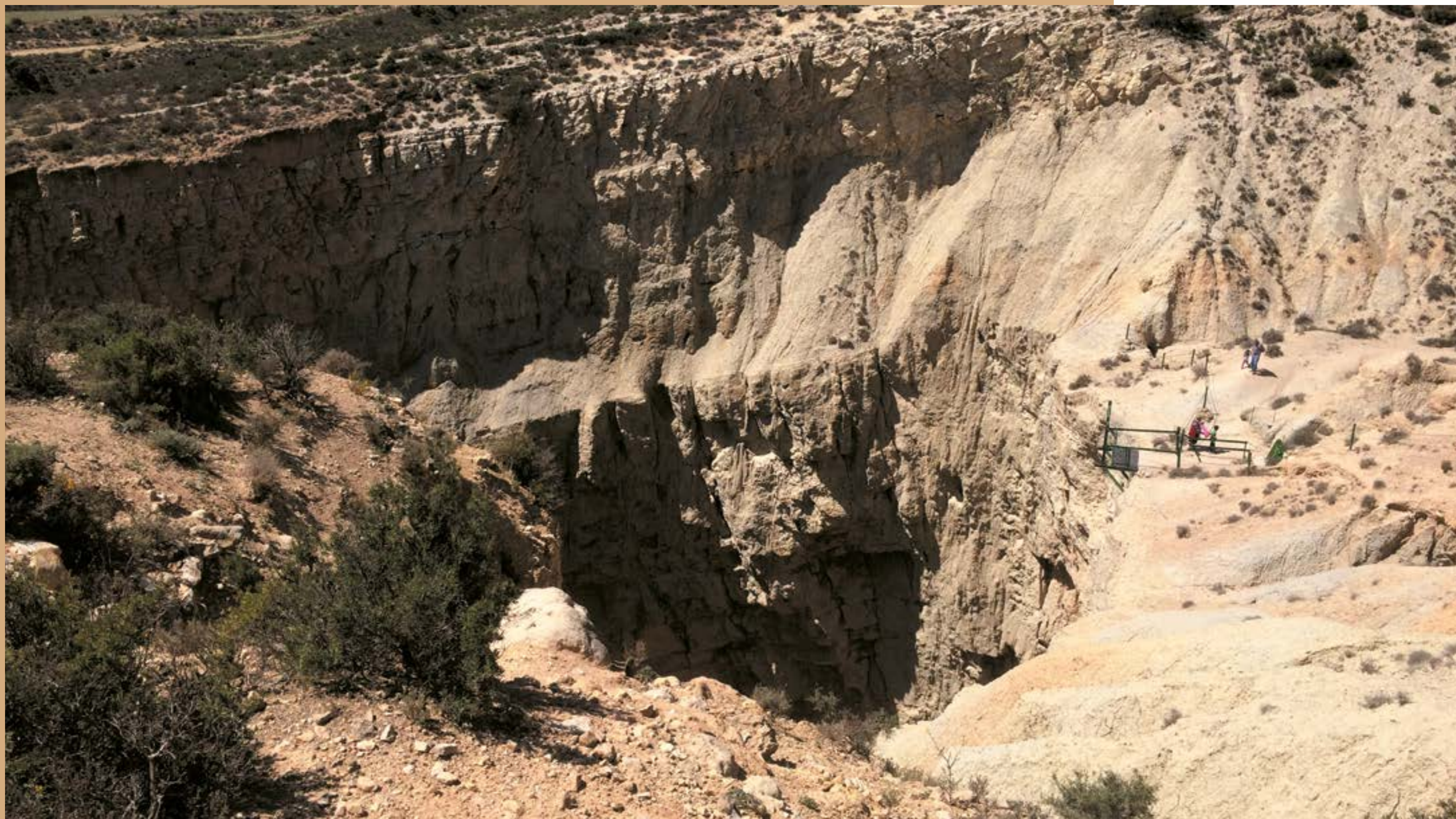
Sima de San Pedro, en Oliete