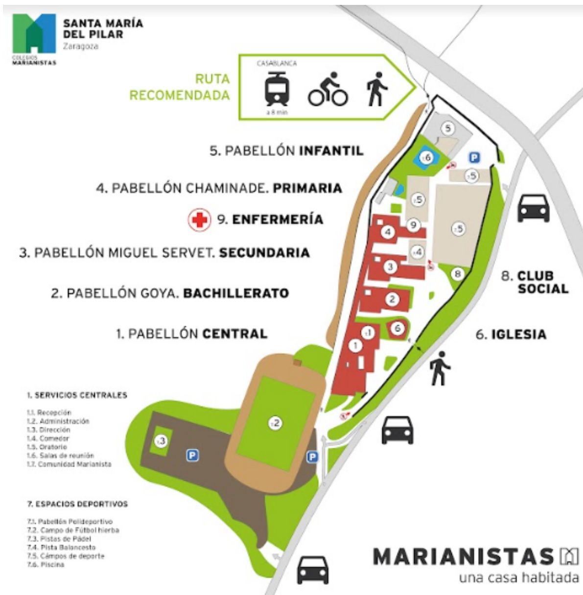
Mapa centro escolar (Anexo II)