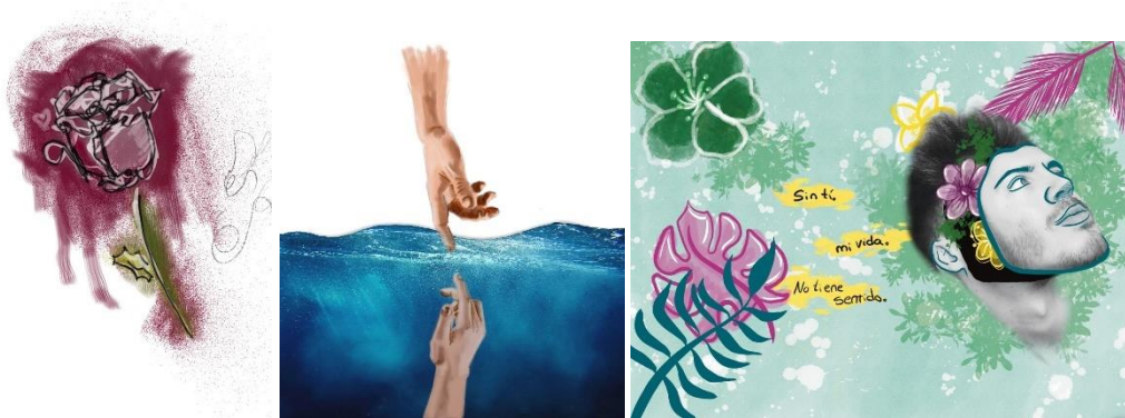
Bocetos ilustraciones poemario 2019 versus poemario 2022

Como se puede apreciar, ha cambiado el estilo tanto entre los primeros bocetos y estos últimos, como entre los últimos bocetos y el resultado final.