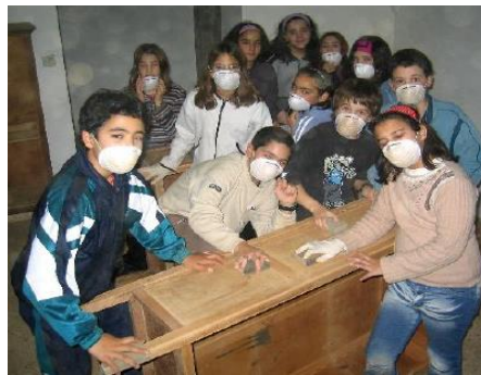
Imagen 1: Proceso restaurador en el CRIET de Alcorisa

Para dar comienzo a este proyecto se decidió aunar esfuerzos, de tal forma que se lograra la implicación de un gran número de personas, incluyendo así a toda la comunidad educativa, es decir, al alumnado, al profesorado y a todas aquellas familias que se mostrasen interesadas en formar parte del mismo.