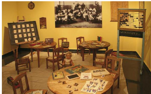
Imagen 4: Aula de primeros aprendizajes