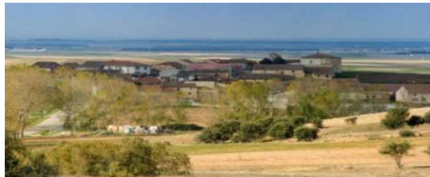
Imagen 9: Población de Otones de Berjumea

El Museo Pedagógico de Otones “La Última Escuela” se encuentra en la localidad segoviana de Otones de Berjumea, cuya apertura tuvo lugar en 1996. Este museo nace con la finalidad recuperar y estudiar detenidamente el patrimonio escolar e histórico de la provincia de Segovia, que en multitud de ocasiones había caído en el olvido.