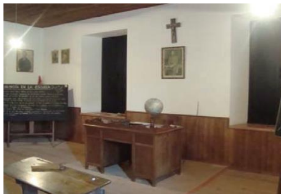
Imagen 6: Aula de la época de Franco

En el museo se muestra una representación de aula coincidiendo con la época de Franco, por lo que se puede contemplar las actividades discriminatorias que se realizaban entre alumnos y alumnas, así como la religión como pilar fundamental durante este periodo.