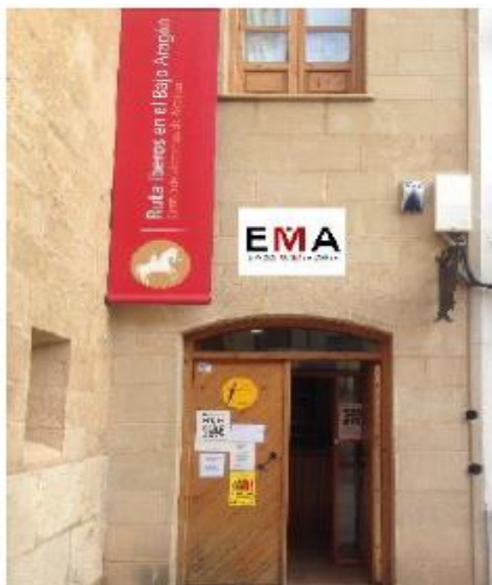
Imagen 12: Instalaciones de “Espacio Museos Alcorisa” (EMA)

Moderador: Buenos días a todos/as y en primer lugar me gustaría daros las gracias por vuestra participación en este grupo de discusión. Hoy nos acompañan cuatro miembros pertenecientes a la Asociación de Amigos del Museo de la Escuela Rural de Alcorisa.