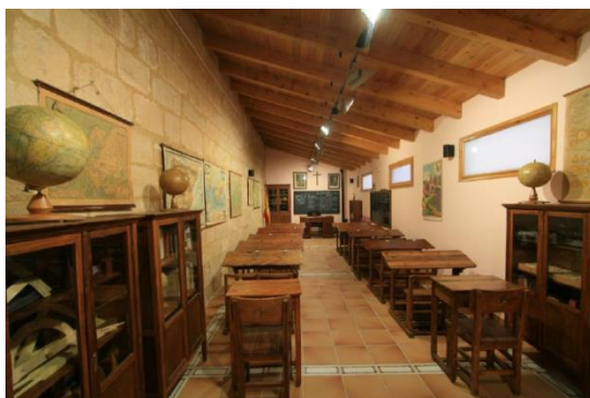
Imagen 2: Escuela Unitaria del Museo de la Escuela Rural de Teruel, en Alcorisa