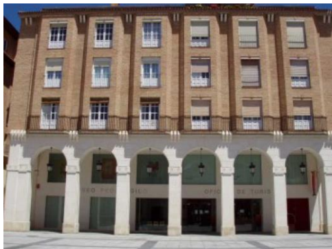
Imagen 3: Instalaciones del Museo Pedagógico de Aragón

El edificio se encuentra ubicado en pleno centro histórico de la ciudad de Huesca y consta de dos plantas con una extensión total de alrededor de 800m 2 . La exposición que se encuentra permanente en el Museo Pedagógico de Aragón la conforman 1400 piezas aproximadamente, sin embargo, la colección a nivel global que presenta el museo consta de una cifra bastante elevada, unas 12000 piezas. El Museo Pedagógico es un gran referente en toda España, ya que en él se muestra el patrimonio histórico de la educación de la comunidad autónoma de Aragón.