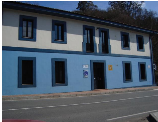
Imagen 5: Instalaciones del Museo de la Escuela Rural de Asturias

El Museo de la Escuela Rural de Asturias (MERA) fue inaugurado en el año 2002, el cual se encuentra ubicado en el concejo de Cabranes, tomando la denominación de Museo de Cabranes. Si bien es cierto que se trata de un edificio cuya apertura se produjo durante el año 1908, cumpliendo la función de escuela, recibiendo el nombre de escuela de Viñón.