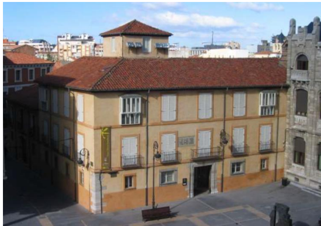
Imagen 10: Instalaciones del Museo Sierra Pambley (León)

El Museo Sierra Pambley, cuya apertura se produjo durante el año 2006, nace como fruto de un ambicioso proyecto. Este museo presenta unas instalaciones que muestran un claro reflejo, por un lado, de la vida cotidiana de la familia, mientras que, por otro lado, de los rasgos más característicos de las cinco escuelas que conforman la fundación Sierra Pambley.