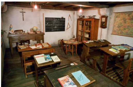
Imagen 8: Aula itinerante del Museo Pedagógico de Galicia

comunicación con la finalidad de crear aplicaciones que generen interés entre las personas para aumentar el número de personas que realizan visitas de manera presencial. Por ello, esta exposición itinerante mencionada se mantuvo durante el periodo comprendido entre los años 2000 y 2004, recorriendo algunas poblaciones de la comunidad gallega, tales como Vigo y Ourense, cuyos resultados en cuanto a número de visitantes fueron muy exitosos, rondando los 10000.