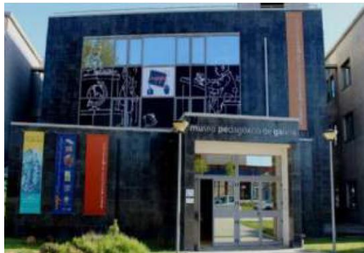
Imagen 7: Instalaciones del Museo Pedagógico de Galicia (MUPEGA)

El 21 de octubre de 2.004, el Museo Pedagógico de Galicia (MUPEGA) abrió sus puertas mostrando un claro reflejo de la sociedad gallega en el ámbito de la educación perceptible en las colecciones expuestas. Se trata de un edificio construido durante los años 80, el cual presenta una superficie de unos 3.500 m 2 aproximadamente.