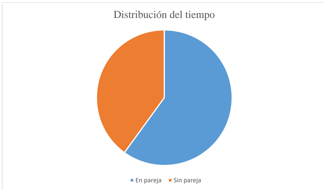
Figura 1. Ejemplo del resultado de la actividad de la sesión número ocho.