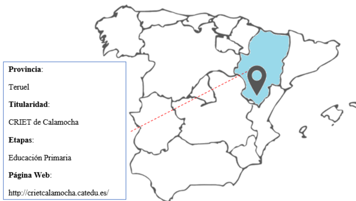
Figura 1. Localización CRIET. Elaboración propia.

El centro donde se desarrolla el programa de educación emocional y educación responsable se encuentra en Calamocha, localidad de la provincia de Teruel con una población de algo más de los 4.000 habitantes (Figura 1). El programa no se desarrolla en un centro convencional, sino en un CRIET (Centro Rural de Innovación Educativa de Teruel).