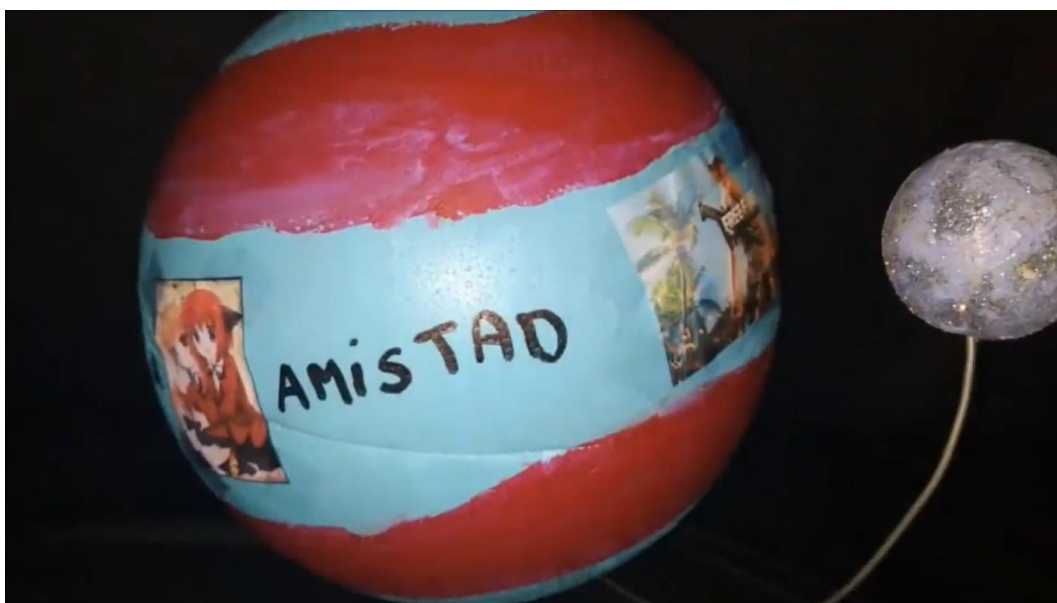
Figura 5. Planeta imaginario.

En este tercer trimestre se trabajaba el recurso del “Coro de las Emociones” y como actividad inicial se trataba de la creación de un “planeta imaginario” (Figura 5), a libre albedrío de los alumnos y en el que expresaran a través de colores y formas sus emociones para más tarde, exponerlo y crear un nuevo espacio en el que se reflejen sus creaciones.