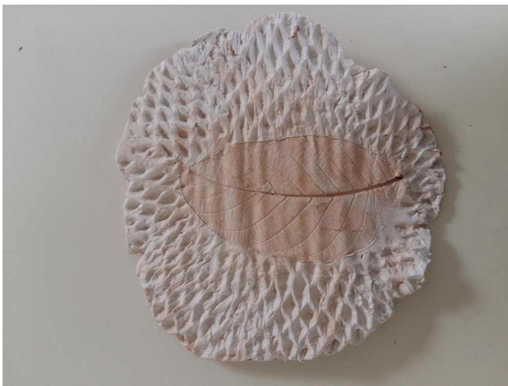
Figura 3. Textura de la naturaleza.

Dentro de la programación del primer trimestre se encuentran un conjunto de actividades y además la incorporación de una actividad propia del Banco de Herramientas y ReflejArte. Así, en el primer trimestre del primer año de la implantación en el centro, se realizó una actividad inicial que constaba de 2 apartados, el primero trataba de la grabación de un video en el que los alumnos nos presentaban el espacio natural de su localidad y el segundo apartado consistía en plasmar una textura de la naturaleza mediante algún material (plastilina, barro, etc.), de forma que luego, cuando llegaban los alumnos al centro, completaban la actividad explicando esa textura y lo que les provocaba, compartiendo así su experiencia (Figura 3).