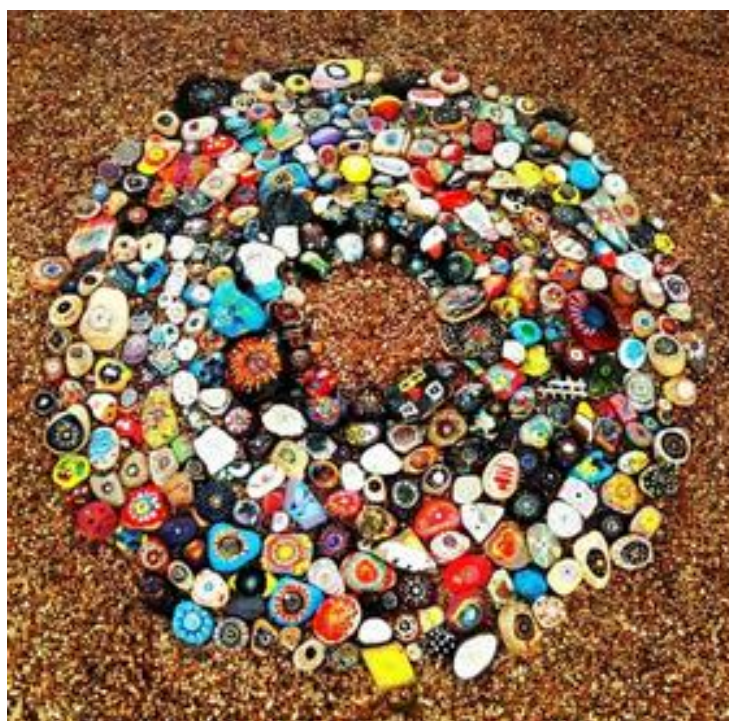
Figura 6. Decoración pétrea.