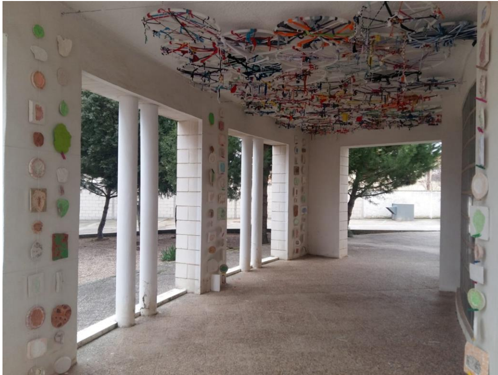
Figura 4. Refugio sensorial.

Como resultado de las dos actividades anteriores se realizaba la actividad de ReflejArte, en la que en un principio realizaban una visita virtual a una exposición, posteriormente se les introducían conceptos de lo que es el arte y las sensaciones que puede evocar una obra artística, todo ello con la finalidad de crear en el centro un espacio denominado “Refugio Sensorial” (Figura 4), en el que se insertan las texturas de cada una de las semanas de convivencia de los alumnos de cada trimestre, para que en su vuelta al centro, puedan apreciar su obra y lo que les transmite.