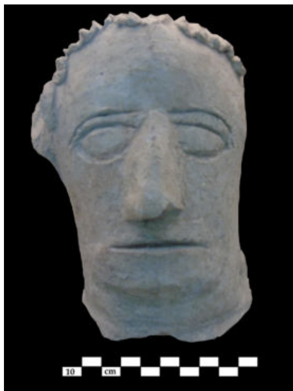
2. Badajoz, Museo Arqueológico. Cabeza en estuco (foto J.T. García)

Si nos centramos en los fragmentos pertenecientes a la posible ara o árula, lo primero que hemos de apuntar es que este tipo de objetos, en Hispania, proceden en su mayoría de ámbitos domésticos rurales, encuadrados normalmente entre los siglos I y III d.C., con escasos ejemplos tanto en época republicana como en el siglo IV d.C. 15 Las piezas llegadas hasta nosotros debemos insertarlas dentro del subtipo Ia « arae y arulae con base y coronamiento diferenciados, cuerpo prismático y remate superior formado por pulvini , con frontón entre ambos, y foculus », de la tipología establecida por de M. Pérez Ruíz 16 en su trabajo sobre el culto doméstico en la Hispania romana. Cuentan con paralelos en las aras o árulas anepígrafas halladas en la Plaça del Rei de Barcelona, en la Villa de Materno en Carranque (Toledo), y en el Edificio de Camp de les Lloses en Tona (Barcelona), ejemplo este último cuyo coronamiento – frecuente en las aras y árulas de cronología republicana de Tàrraco y de la actual zona