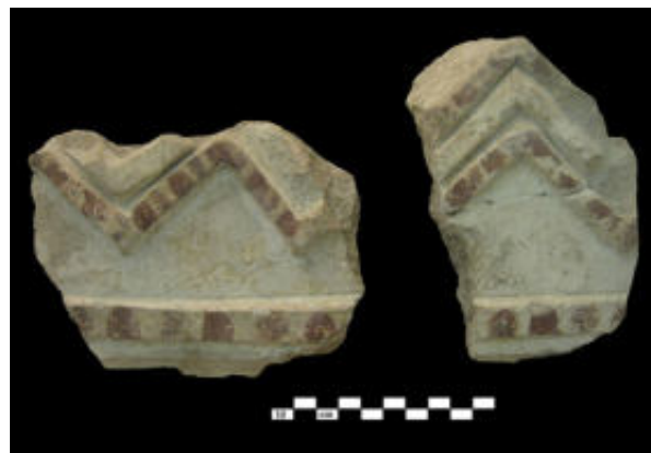
4. Badajoz, Museo Arqueológico. De la villa de La Cocosa. Ara/árula: posible frontón denticulado

divinidades relacionadas con el agua como Asclepios y Hygiea, tal y como podemos comprobar en la Casa de Sertius en Timgad. La misma autora, siguiendo a E. M a Koppel, admite que la presencia de estas deidades no respondería a una motivación religiosa sino que indicaría el gusto de los propietarios por envolverse en un ambiente con connotaciones sagradas. Bien es cierto que la elección de los dioses señalados no parece casual. Por nuestra parte, no perdemos de vista que las cabezas descritas están hechas en estuco, no en piedra. Así, que estuviéramos ante la representación de deidades concretas utilizando este material y no la piedra pudiera estar relacionado con el decaimiento de la escultura en piedra en los asentamientos rurales tras su periodo de esplendor en época Antonina, al contrario que sucede con la producción musiva y pictórica 19 . Por otra parte, no sería la primera vez que hallamos de bustos de divinidades en estuco, pues así ocurre en Bilbilis 20 , donde están vinculadas a un espacio de culto.