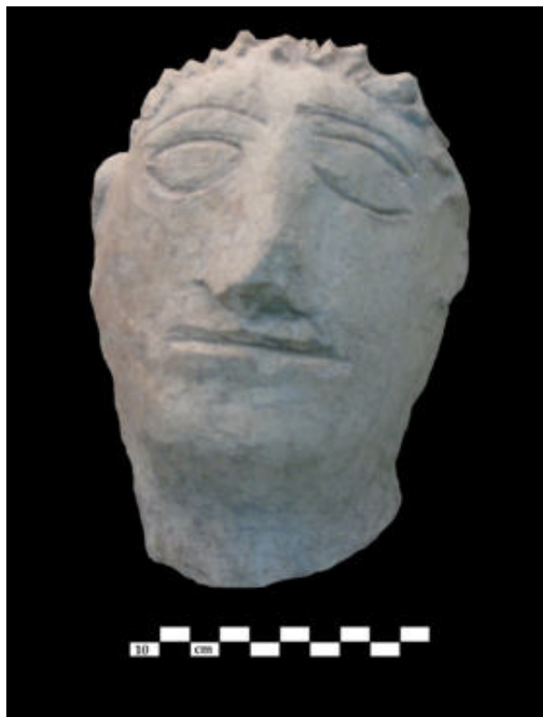
3. Badajoz, Museo Arqueológico. Cabeza en estuco

divinidades relacionadas con el agua como Asclepios y Hygiea, tal y como podemos comprobar en la Casa de Sertius en Timgad. La misma autora, siguiendo a E. M a Koppel, admite que la presencia de estas deidades no respondería a una motivación religiosa sino que indicaría el gusto de los propietarios por envolverse en un ambiente con connotaciones sagradas. Bien es cierto que la elección de los dioses señalados no parece casual. Por nuestra parte, no perdemos de vista que las cabezas descritas están hechas en estuco, no en piedra. Así, que estuviéramos ante la representación de deidades concretas utilizando este material y no la piedra pudiera estar relacionado con el decaimiento de la escultura en piedra en los asentamientos rurales tras su periodo de esplendor en época Antonina, al contrario que sucede con la producción musiva y pictórica 19 . Por otra parte, no sería la primera vez que hallamos de bustos de divinidades en estuco, pues así ocurre en Bilbilis 20 , donde están vinculadas a un espacio de culto.