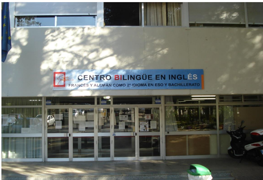
Puerta del Centro IES Pablo Gargallo