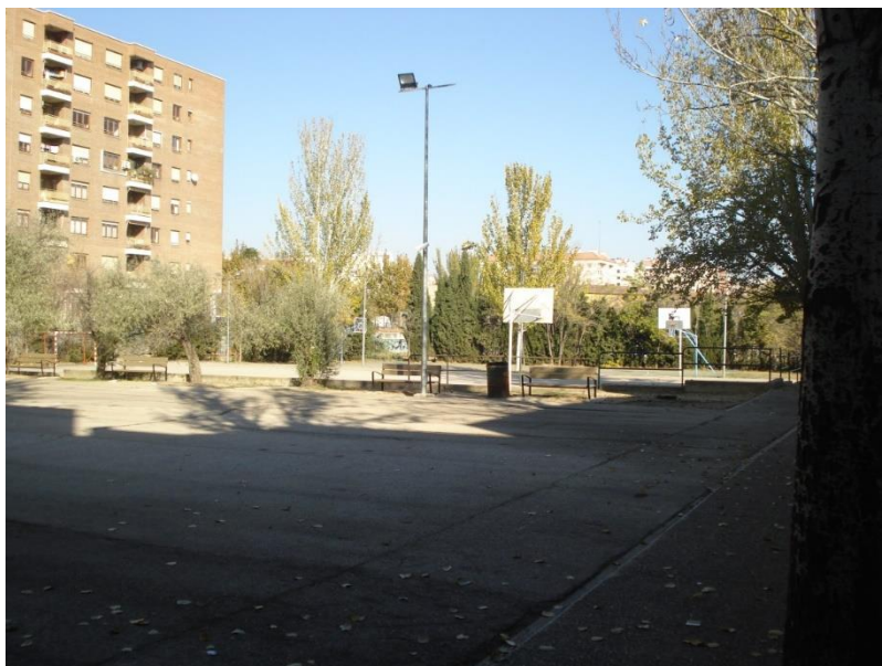
Recreo del centro IES Pablo Gargallo