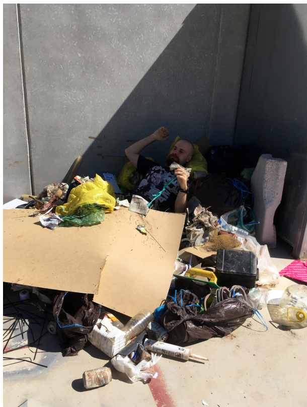
Figura 4. El artista sobre el total de basura acumulada. [Fotografía por Nerea Mora Gamo]. (Teruel 29/04/2019). Terraza taller de barro. FCSH). Recuperado de correo electrónico personal.