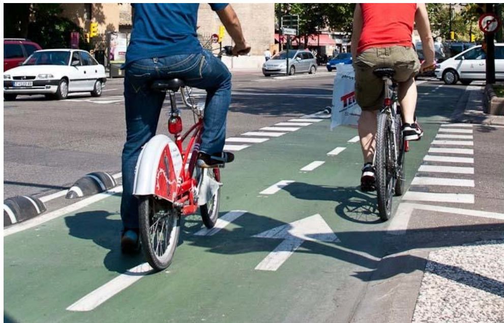
Figura 6. A la izquierda, detalle de dos separadores viales.

(Teruel 11/05/2019). Edif. BBAA, FCSH).