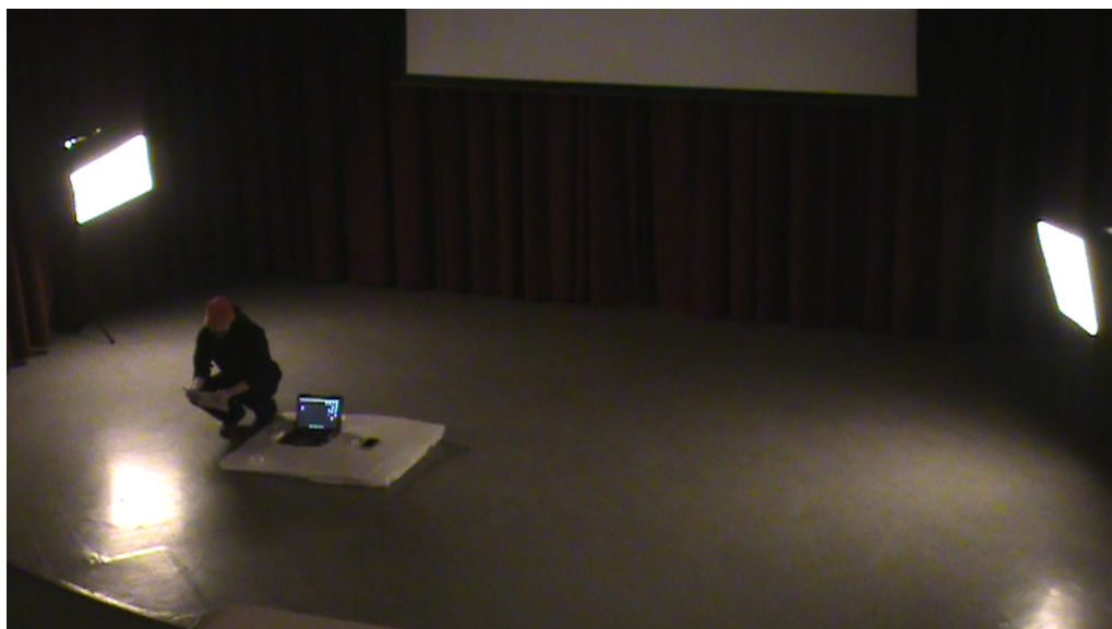
Figura 1. [Captura de pantalla por Javier Makatzaga]. (Teruel 09/04/2019). Recuperado de filmación original performance El hombre que quería convertirse en