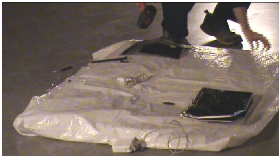
Figura 2. [Captura de pantalla por Javier Makatzaga]. (Teruel 06/05/2019). Recuperado de filmación original performance El hombre que quería convertirse en ser humano , 2019.