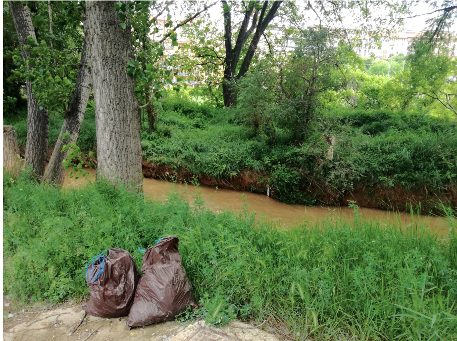
Figura 3. Instante metodológico en recogida de residuos. (Teruel 02/06/2018). Zona recreativa del río Turia.