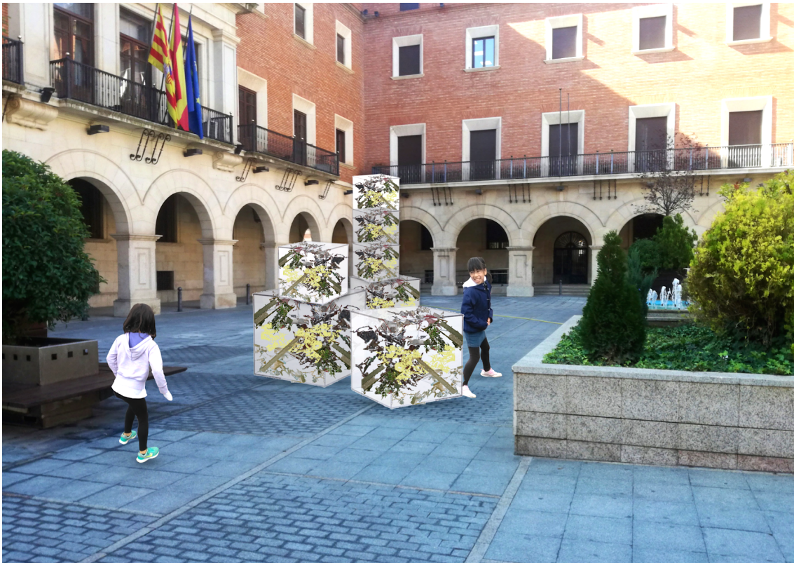
Mockup 2. (17/01/2019). Simulación de la obra Mi hermano, el pobre . Collage fotográfico digital de imágenes libres de derechos y realizadas por el autor.