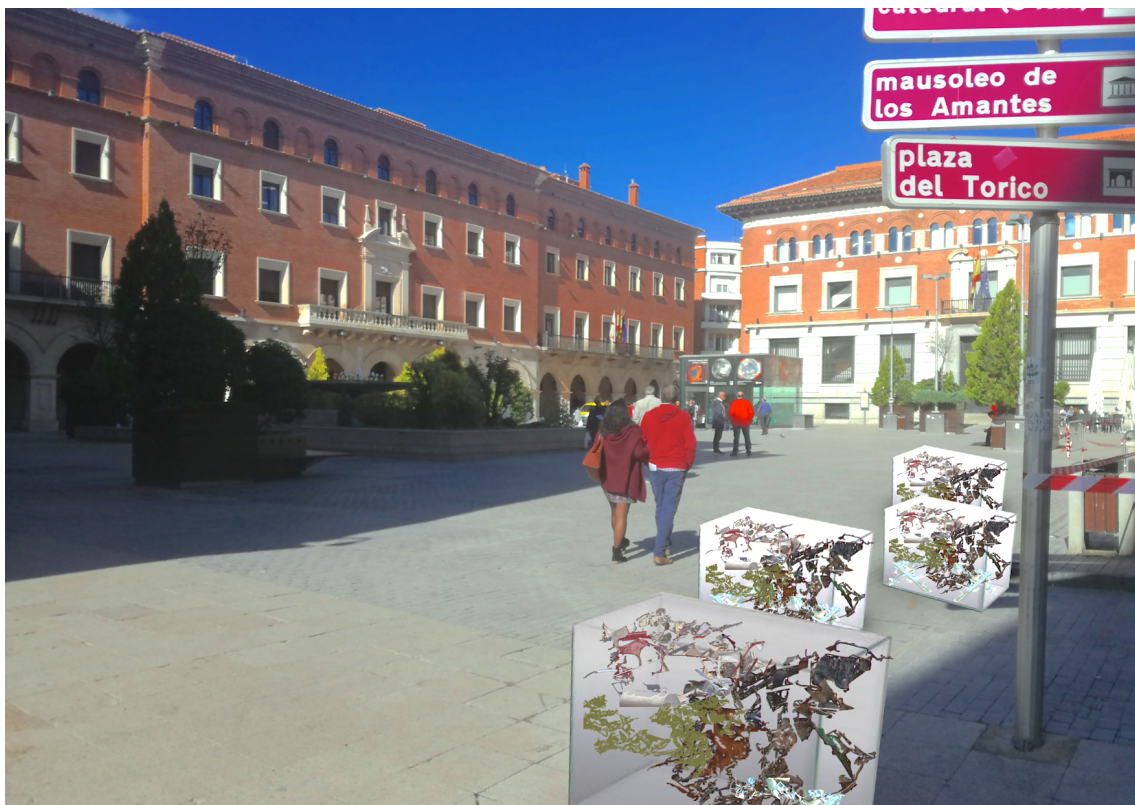
Mockup 1. (17/01/2019). Simulación de la obra Mi hermano, el pobre . Collage fotográfico digital de imágenes libres de derechos y realizadas por el autor.

En el caso que nos atañe y aquí se estudia, a continuación se muestran dos mockup de un posible resultado de la obra Mi hermano, el pobre , a ser situada en la plaza San Juan de Teruel.