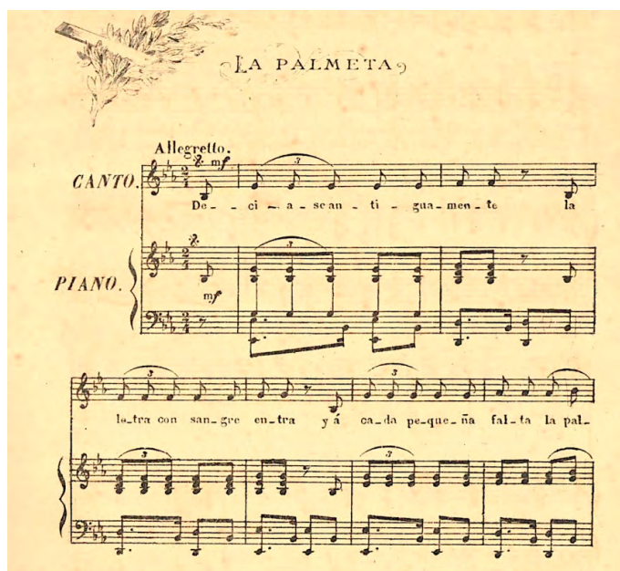
Imagen 7. Incipit de la canción n°17 «La palmeta»