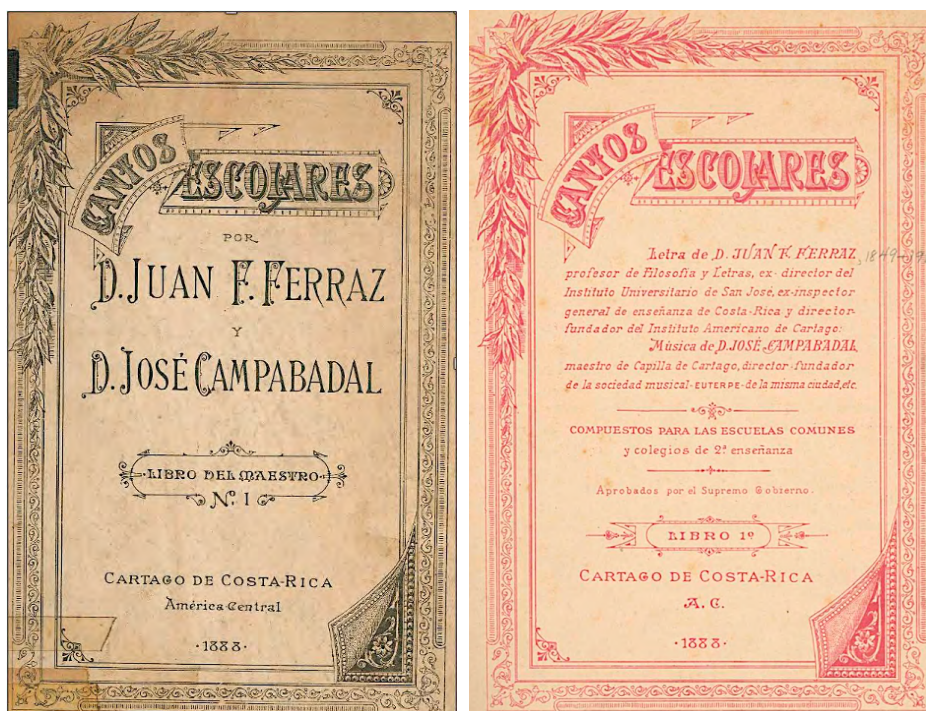
Imágenes 3 y 4. Cubiertas de la edición de 1888 de los Cantos Escolares

parte de un grupo de músicos que, al establecerse en el país desde mediados del siglo XIX, contribuyeron al desarrollo de las prácticas musicales a través de la docencia particular de instrumento y canto a jóvenes de las élites quienes, unas décadas más tarde, fueron activos aficionados o continuaron con su trayectoria artística.