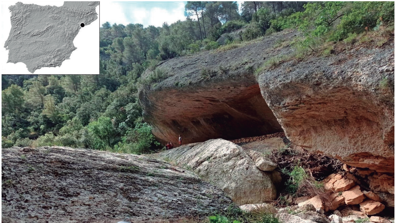
Fig. 1: Localización y vista de Coves del Fem desde el río Montsant con uno de los bloques desprendidos de la visera del abrigo / Location and view of Coves del Fem from the Montsant River with one of the blocks detached from the rock shelter's ledge.

su superficie la presencia de materiales arqueológicos atribuibles a cronologías prehistóricas. Después de algunas visitas al lugar por parte de nuestro equipo de investigación para cerciorarnos de su interés y la viabilidad de su excavación, iniciamos las intervenciones arqueológicas en 2013. Los primeros trabajos se centraron en el vaciado de una zona alterada por la acción reciente de un surco fluvial del río Montsant y posteriores excavaciones clandestinas practicadas sobre los perfiles expuestos por el mismo. Al estar desprovistos de cualquier contexto arqueológico se recuperaron los restos arqueológicos sin georeferenciar en una zona de unos 22 m 2 (Fig. 2), cribando la totalidad del sedimento removido, al mismo tiempo que se realizaron diversos cortes estratigráficos en los límites de las zonas perturbadas, lo que nos permitió establecer una primera propuesta estratigráfica y cronológica (Palomo et al. , 2018). Estos trabajos posibilitaron documentar una amplia estratigrafía que abarca ocupaciones atribuidas al Mesolítico (6065 – 5718 cal BC), Neolítico antiguo Cardial (5667 – 5476 cal BC) y Neolítico antiguo Epicardial (4941 – 4545 cal BC) (Bogdanovic et al. , 2017; Palomo et al. , 2020; Tabla I).