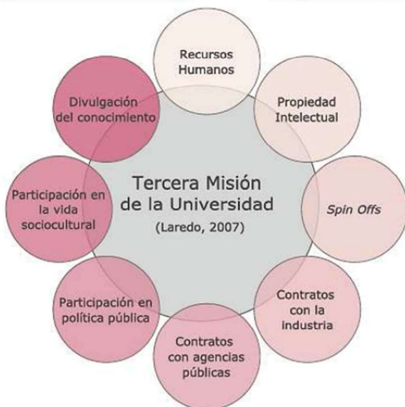
FIGURA 1: 8 categorías en la tercera misión.

La competencia socioemocional (Delgado y Riquelme, 2022), para alcanzar su madurez, debe formar al individuo con herramientas lingüísticas que le permitan verbalizar y definir con claridad sus propias emociones, así como inserir su expresión en contextos sociales de manera adecuada. Identificar las emociones y saberles dar nombre es uno de los pasos iniciales para una adecuada gestión emocional.