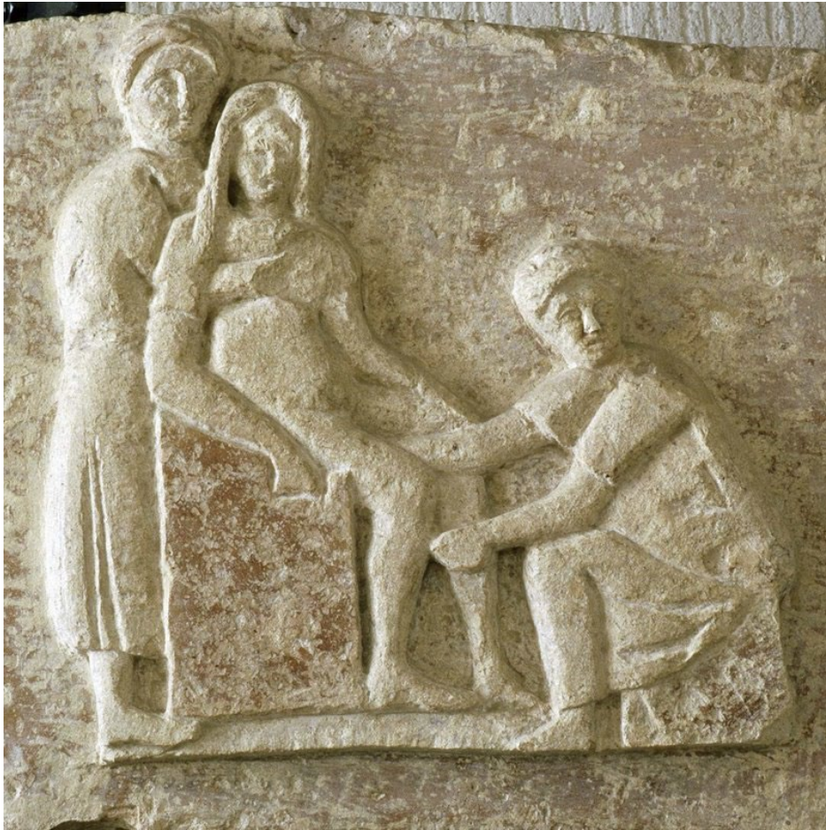
Ilustración 1: Relieve que representa a la comadrona. Escribonia Ática. Siglo II. Ostia antica, Roma. https://grupo.us.es/conditiofeminae/wp-content/uploads/2022/03/escribonia-atica.jpg