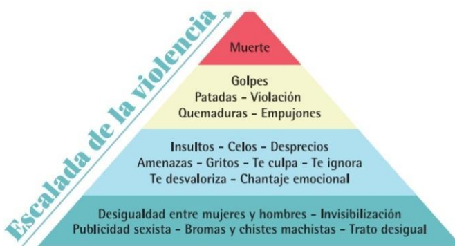
Imagen 1. Escalera de la violencia