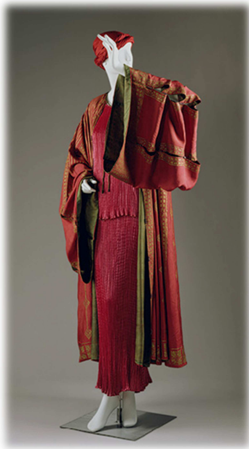
Bata, Mariano Fortuny y Madrazo, 1930, Museo Metropolitan de Nueva York.

Kaftán de raso en color rojo con decoración en color dorado. Lo más interesante son las llamativas mangas que llegan a imitar por completo las hechuras del kimono japonés.