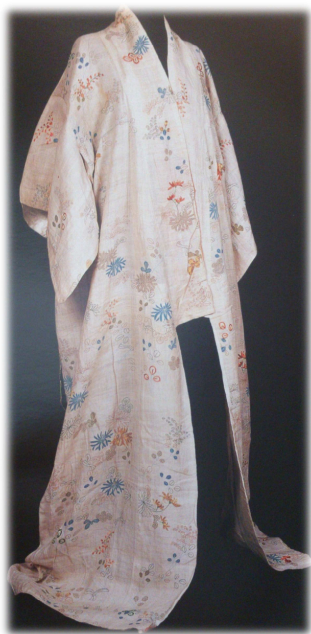
Vestido teatral, Mariano Fortuny y Madrazo, siglos XIX-XX.

Kimono de color blanco con motivos decorativos florales en negro, marrón claro y oscuro, verde, naranja y azul, entre ellas: flores y ramas de crisantemo, plantas acuáticas, hojas varias, bayas, glicinas colgantes... todas ellas dispuestas sin orden sobre la superficie del vestido pero con gran simplicidad y elegancia.