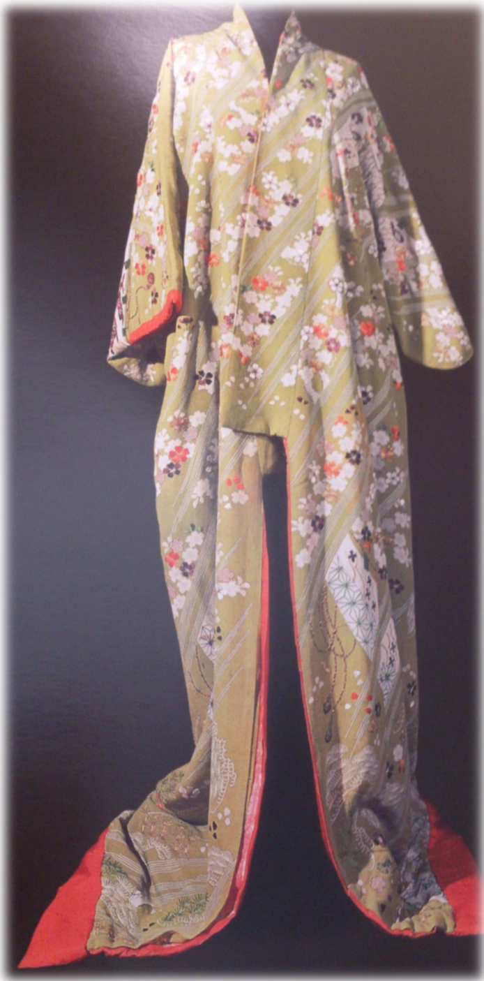
Vestido, Mariano Fortuny y Madrazo, siglos XIX-XX.

Kimono de color verde con forro rojo en el que aparecen representadas líneas dispuestas diagonalmente de color blanco, que se alternan con ramas de cerezo, flores de diversos ejemplares (en especial campanillas chinas blancas, rojas y moradas en la parte superior, y crisantemos de color blanco, verde y naranja en la parte inferior), cordones con borlas en la parte central del vestido y remolinos conformados por líneas blancas ondulantes en la parte inferior.