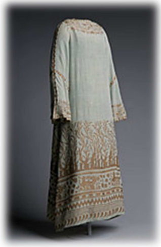
Vestido-túnica, Mariano Fortuny y Madrazo, ca.1920-1930, Museo del Traje de Madrid.