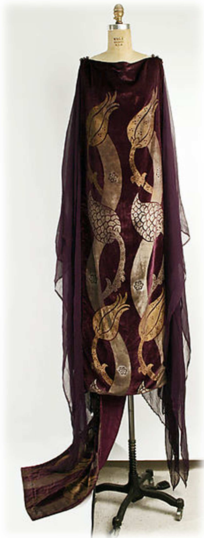
Vestido tubular, Mariano Fortuny y Madrazo, ca.1920, Museo Metropolitano de Nueva York.

Vestido de seda granate con decoración vegetal dorada en su parte frontal y cuello barco. Conecta con el kimono en la forma que otorga al cuerpo de la mujer: forma recta.