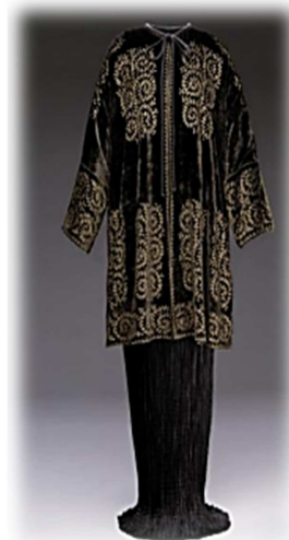
Abrigo corto rojo (influencia persa), Mariano Fortuny y Madrazo, ca.1930, Colección particular, Madrid.

Los diseños textiles de Fortuny se enriquecieron con la influencia del arte persa (con arabescos, flores y animales) y de las telas de origen turco (con motivos vegetales y geométricos, y el motivo de la granada).