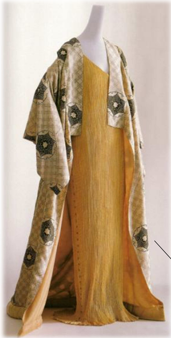
Bata , Mariano Fortuny y Madrazo, 1910.

Bata de tafetán de seda blanca, con motivos tradicionales japoneses estarcidos: líneas rectas diagonales entrecruzadas ( kohshi ) y mon o blasones (insignias de los diferentes clanes nipones que indicaban el rango o la clase a la que pertenecía quien lo portaba).