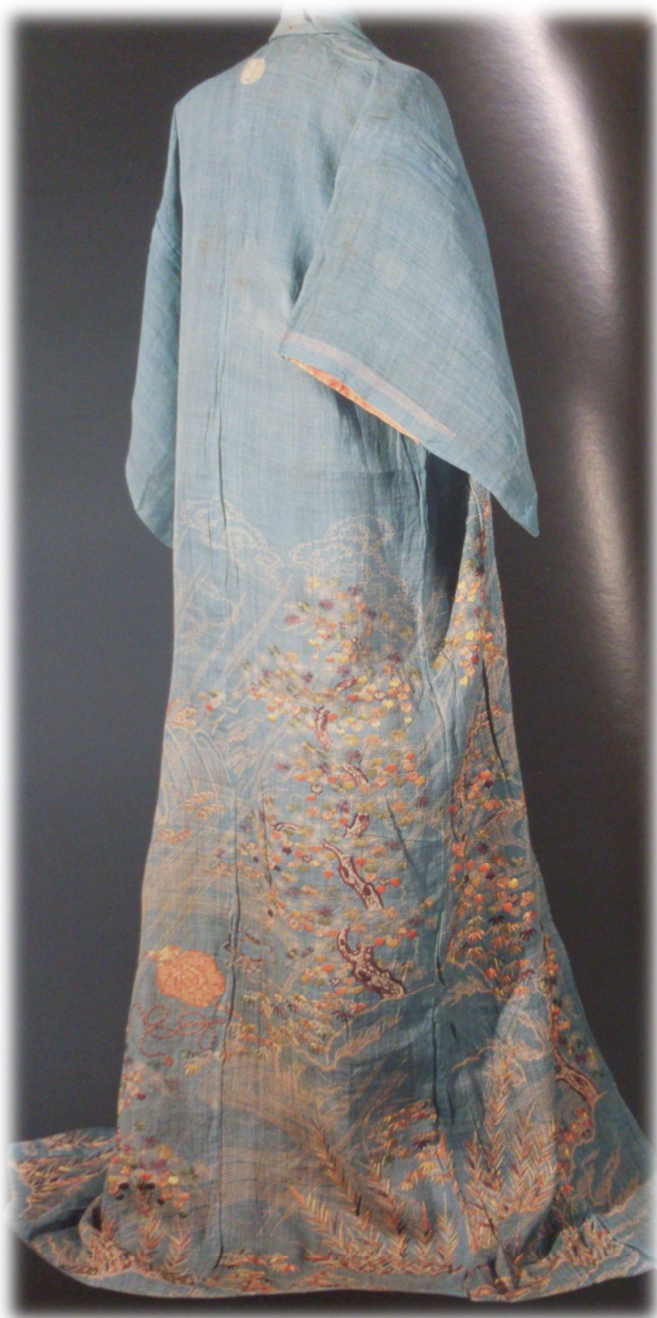
Vestido para ceremonia, Mariano Fortuny y Madrazo, fin del siglo XIX.

Kimono de color azul sobre el que se destacan en color blanco en la parte inferior: cascadas, remolinos, salpicaduras de agua y conformando una naturaleza caótica: ramas de cerezo, ramas de pino japonés ( matsu ), hojas, juncos y algunas flores diseminadas. Más en la parte superior, aparecen representadas nubes ( ryusui ) y lluvias.