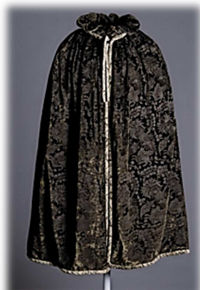
Capa terciopelo verde oscuro (motivos del siglo XIV de la ciudad de Lucca), Mariano Fortuny y Madrazo, ca.1920-1925, Museo del Traje de Madrid.

Sin embargo, los motivos que le otorgaron el reconocimiento mundial fueron los diseños de inspiración renacentista tomados de los maravillosos terciopelos quattrocentistas provenientes de Florencia, Venecia, Lucca y Génova; de todos ellos, fueron los motivos venecianos y florentinos los que adquirieron mayor fuerza en su producción.