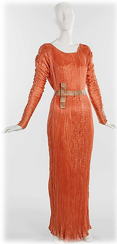
Delphos , Mariano Fortuny y Madrazo, ca.1930, Museo Metropolitano de Nueva York.

Vestido de raso de seda plisada en color naranja con manga larga y cuello redondo. Está decorado con un cordoncillo de seda con cuentas de cristal de Murano en las mangas y un cinturón de color ocre.