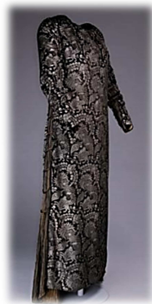
Túnica de seda negra, Mariano Fortuny y Madrazo, ca.1909-1915, Fundación Giorgio Cini de Venecia.

Del arte copto de influencia greco romana toma la inspiración de las telas de estilo “pictórico” y de motivos de origen indígena entre los que encontramos todo tipo de formas geométricas combinadas con otros elementos como el zarcillo de vid, la palma, los florones o las cintas.