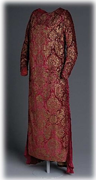
Vestido terciopelo rojo, Mariano Fortuny y Madrazo, ca.1930-1940, Museo del Traje de Madrid.