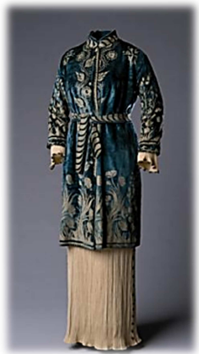
Abrigo de terciopelo verde, Mariano Fortuny y Madrazo, ca.1914-1920, Museo del Traje de Madrid.

El arte musulmán se erigió en otra importante fuente de inspiración, gracias a la extraordinaria colección de tejidos que su madre poseía. Los motivos decorativos de estas piezas condujeron a Mariano a concebir “diseños nutridos de la delicadeza y el gusto refinado de los pueblos árabes e islámicos, a la vez que llenos de originalidad” dando lugar a unas de las creaciones más importantes del autor. El tema más recurrente de esta tendencia artística son las inscripciones epigráficas escritas.