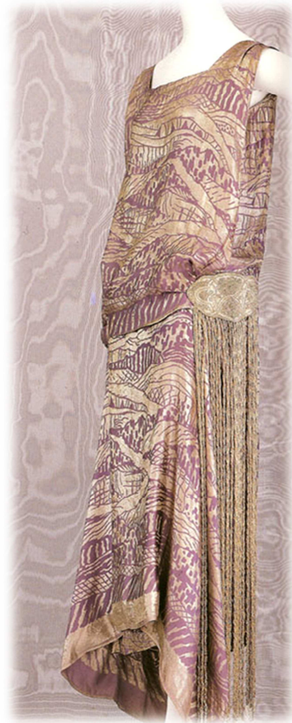
Vestido tubular de noche, Liberty & Co., 1921.

Vestido de seda granate con decoración vegetal dorada en su parte frontal y cuello barco. Conecta con el kimono en la forma que otorga al cuerpo de la mujer: forma recta.