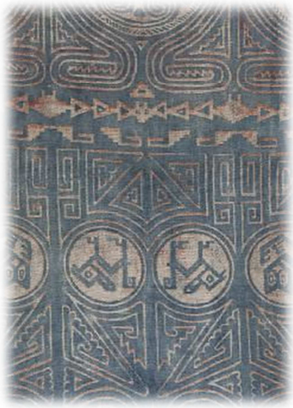
Fragmento de tela de algodón azul, Mariano Fortuny y Madrazo, ca.1901- 1933, Museo del Traje de Madrid.