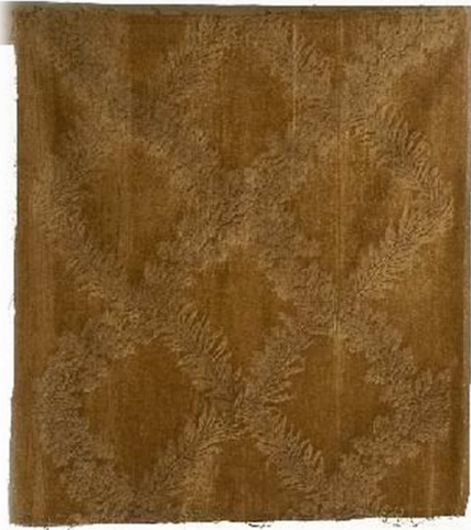
Fragmento de tela de algodón marrón y ocre, Mariano Fortuny y Madrazo, ca.1901-1925, Museo del Traje de Madrid.