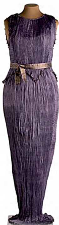
Delphos , Mariano Fortuny y Madrazo, ca.1910-1949, Museo del Traje de Madrid.

Este diseño creado por Mariano Fortuny lo designó con el nombre de Delphos. Está inspirado en el chitón griego y como él, el Delphos está formado por un simple rectángulo de tela que apoya en los hombros y cae libremente. Este patrón libera el cuerpo femenino de toda sujeción y cada modelo es único, puesto que la silueta de cada mujer es la que crea da forma al vestido. Este modelo se repite con algunas variantes como el largo de las mangas o la forma de los cuellos.