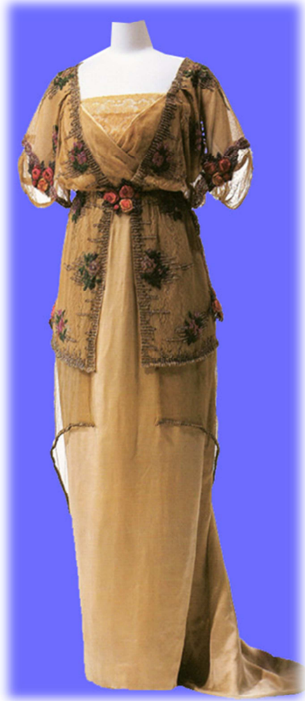
Vestido de noche, Paul Poiret, 1911.

Vestido occidental de raso de seda beige con sobretodo de tul de seda. Introduce elementos de la indumentaria tradicional japonesa: sobre delantero cruzado, mangas tipo blusa kimono, caída recta de la falda y aderezos florales.