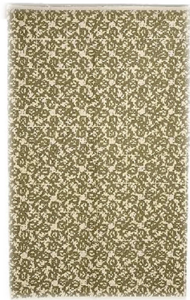
Fragmento de tela de algodón blanco, Mariano Fortuny y Madrazo, ca.1901- 1933, Museo del Traje de Madrid.

El arte de Asia Oriental cobró especial importancia en el repertorio artístico fortuniano, tal y como hemos analizado en el cuerpo del trabajo.