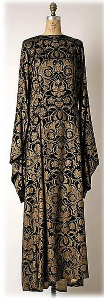
Vestido de té negro, Mariano Fortuny y Madrazo, ca.1930-1932, Museo Metropolitano de Nueva York.

Del siglo XVI, tomó los diseños renacentistas compuestos por damascos españoles, grutescos y decoración con hojas y flores de acanto que le sirvieron de arquetipo para sus piezas textiles.