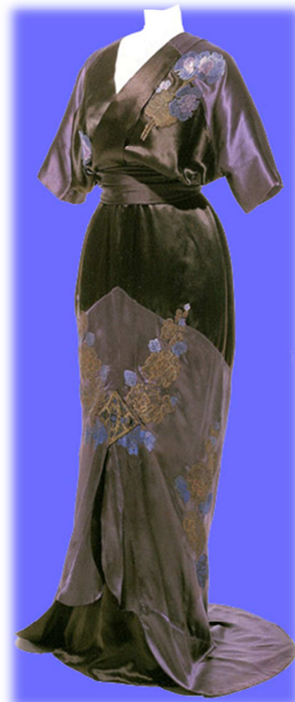
Vestido de noche, Callot Soeurs, 1908.

Vestido occidental de raso de seda beige con sobretodo de tul de seda. Introduce elementos de la indumentaria tradicional japonesa: sobre delantero cruzado, mangas tipo blusa kimono, caída recta de la falda y aderezos florales.