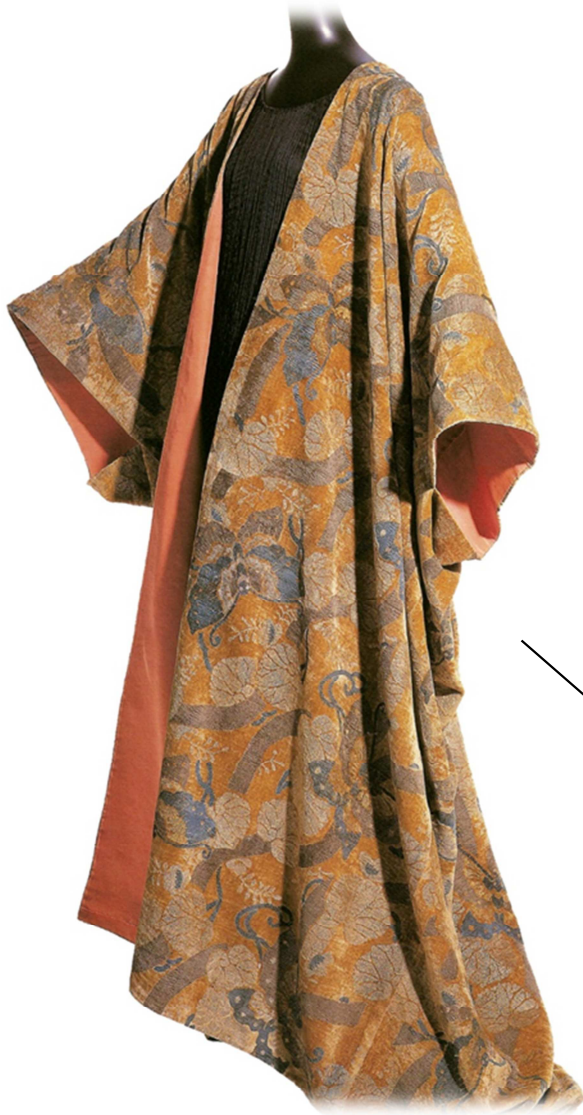
Abrigo, Mariano Fortuny y Madrazo, ca.1900.

Abrigo amplio de corte recto de terciopelo naranja con estarcido polícromo de motivos japoneses (mariposas y hojas de malva). Pertenece a la categoría de abrigos kimono.