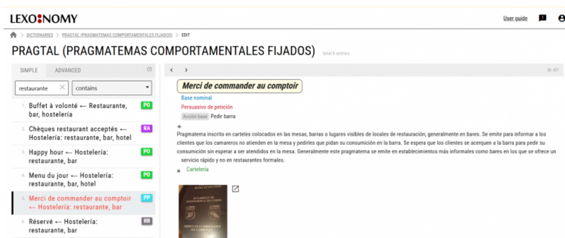
Figure 6. Exemple de recherche des espaces de restauration

Merci de commander au comptoir , Happy hour ou Toilettes dans les restaurants (la Figure 6 montre les résultats après lancer la recherche « restaurant ») ; Accueil , Prière de ne pas déranger ou Prière de faire ma chambre dans les hôtels ; Cédez votre place , Ne pas utiliser les strapontins ou Un train peut en cacher un autre dans les transports publics ; Soldes , Liquidation , ou Black Friday dans les magasins. Les groupes notent les espaces et les énoncés choisis dans la deuxième section de la fiche de travail de l'élève.