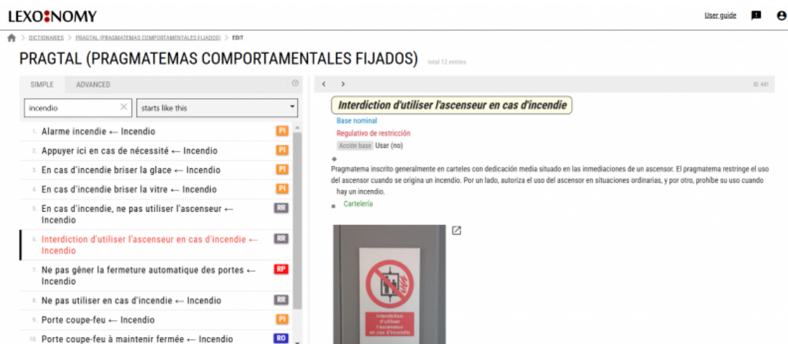
Figure 3. Recherche onomasiologique dans la barre de recherche