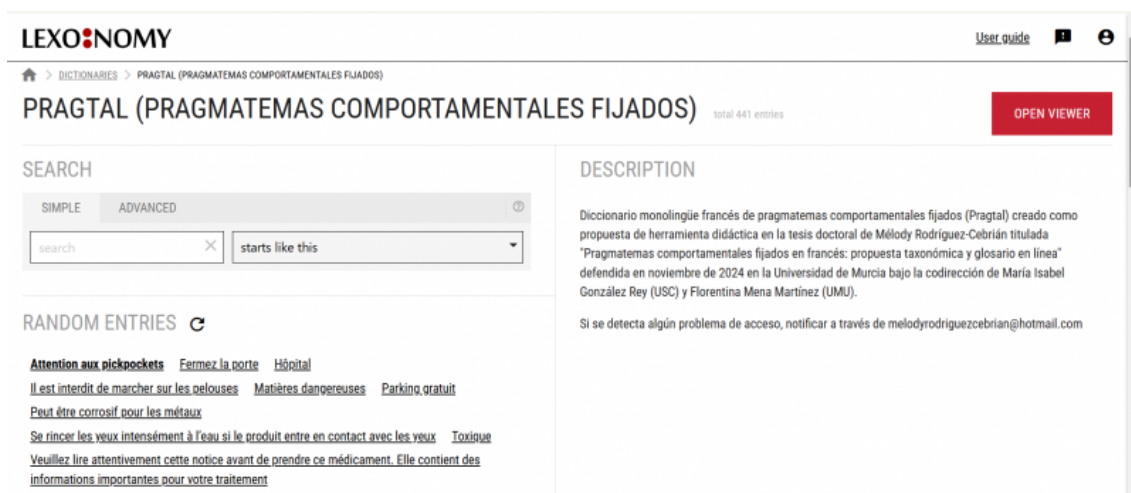
Figure 1. Page d'accueil du dictionnaire PRAGTAL