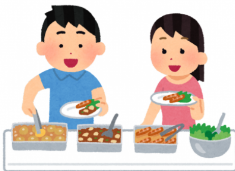
Figure 7. Exemple de production de l'affiche du pragmatème Buffet à volonté