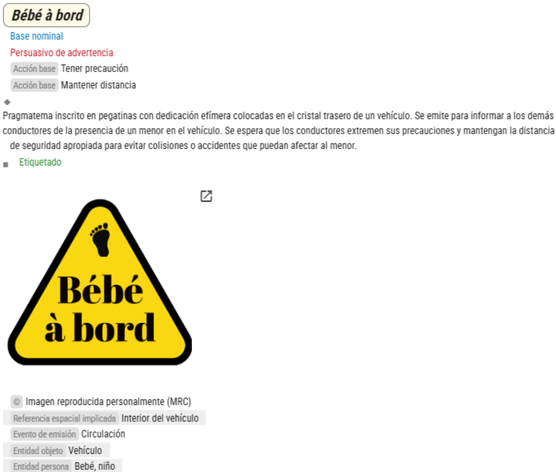
Figure 2. Exemple de l'entrée Bébé à bord