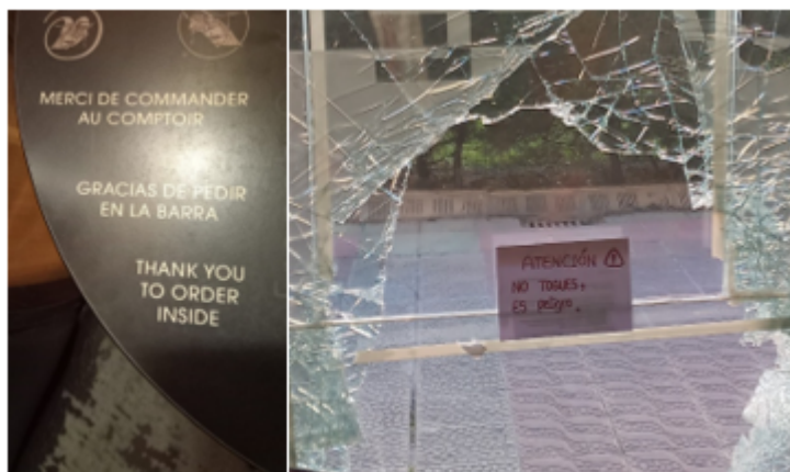
Figure 5. Images introductives de la séquence didactique