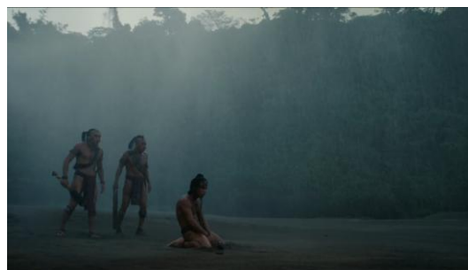
Figura 14 (Gibson, 2006)