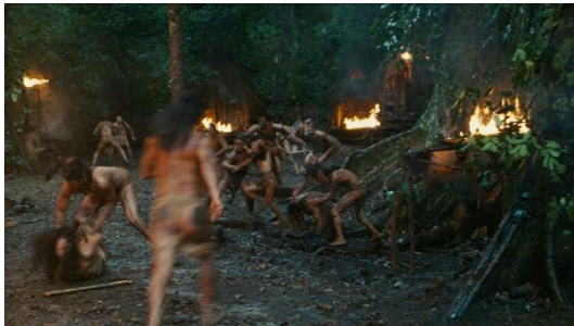
Figura 1 (Gibson, 2006)