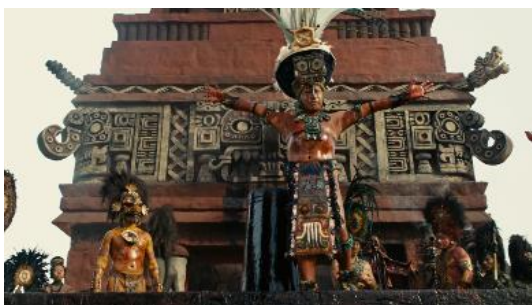
Figura 5 (Gibson, 2006)