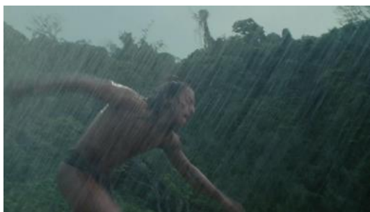
Figura 13 (Gibson, 2006)