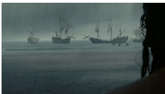
Figura 15 (Gibson, 2006)