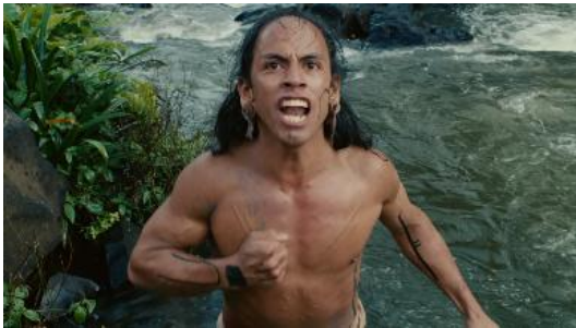
Figura 9 (Gibson, 2006)