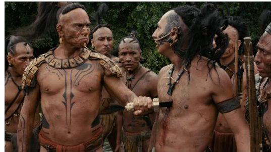
Figura 10 (Gibson, 2006)

Sinopsis detallada del fragmento mediante su división en secuencias mecánicas y la posterior identificación de elementos visuales y sonoros (deletreamiento):