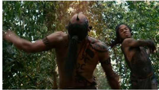
Figura 12 (Gibson, 2006)