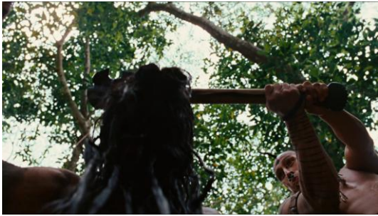
Figura 11 (Gibson, 2006)