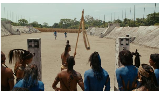
Figura 7 (Gibson, 2006)