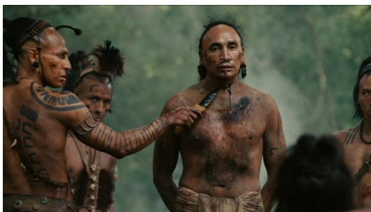
Figura 3 (Gibson, 2006)