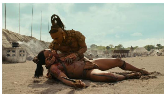
Figura 8 (Gibson, 2006)

Sinopsis detallada del fragmento mediante su división en secuencias mecánicas y la posterior identificación de elementos visuales y sonoros (deletreamiento):