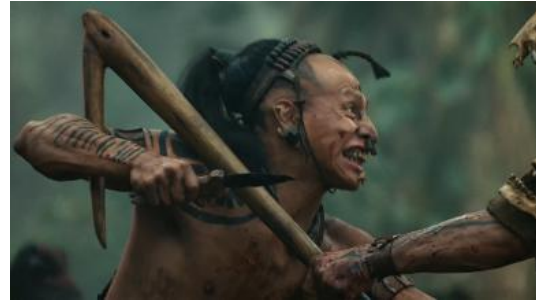
Figura 2 (Gibson, 2006)