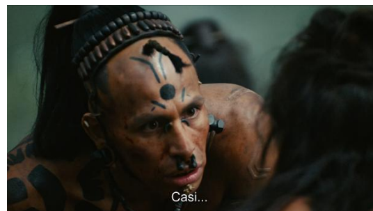
Figura 4 (Gibson, 2006)

Sinopsis detallada del fragmento mediante su división en secuencias mecánicas y la posterior identificación de elementos visuales y sonoros (deletreamiento):