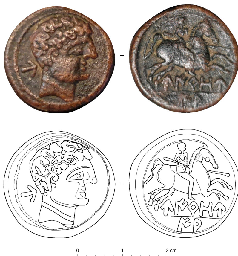
Figura 5. Unidad de bronce de la ceca de uirouia , recuperada de manera casual en las inmediaciones de la torre de la iglesia de Borobia (dibujos M. a C. Sopena).

En sus leyendas alterna la forma uirouia , que podemos interpretar como el nominativo del nombre de la ciudad emisora, con uirouiaz , susceptible de identificarse con el ablativo del mismo ( MLH I A.71; Jordán, 2019, pp. 293-296). La etimología del topónimo es objeto de debate, aunque hay unanimidad en su carácter indoeuropeo, no siendo descartable que tenga un origen hidrónimo (Villar y Prósper, 2005, pp. 483-484). La ciudad no aparece documentada en ninguna otra fuente, a excepción de una pequeña tésera de hospitalidad celtibérica de bronce con forma de pájaro, coetánea de las monedas, recuperada en la localidad de Palenzuela (Palencia), en la que aparece mencionada en forma adjetival: uirouiaka kar ( MLH IV K.25.1; Jordán, 2019, pp. 527-529; cf. Beltrán et al. , 2020).