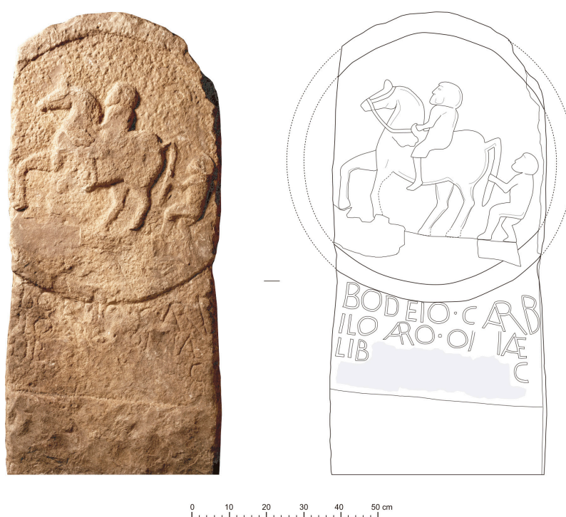
Figura 3. Estela de * Bodeius , Borobia (dibujo M.ª C. Sopena).

En su parte superior la estela muestra una compleja decoración figurada cuyo aspecto formal y técnico resulta semejante al de la estela de los Sempronii , por lo que no es descartable que fueran realizadas por el mismo taller (Fig. 3). El disco está enmarcado por un listel de 6 cm en cuyo interior, rehundido, se reproduce una escena que incluye un jinete marchando al paso hacia la izquierda, seguido de un infante asido a la cola del caballo. La representación incluye pocos detalles a excepción del cabezal y las riendas del caballo. Ambos laterales del disco han sido retallados tras la amortización de la pieza para facilitar su reutilización.