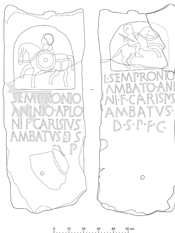
Figura 2. Estela de los Sepronii , Borobia. Izquierda, cara A. Derecha, cara B (dibujos M. a C. Sopena).

El nicho de la cara A es ligeramente más grande, mide 43,5 × 40 cm. El caballo mira hacia la izquierda, está en posición de marcha con la pata delantera derecha levantada. El jinete, cuya cabeza se ha visto afectada parcialmente por la pérdida de una lasca, sujeta las riendas probablemente con la mano derecha mientras que en la izquierda porta un escudo redondo del que se aprecia resaltado el aro del borde y el umbo. También se han representado los arreos correspondientes al cabezal y la grupa del caballo.