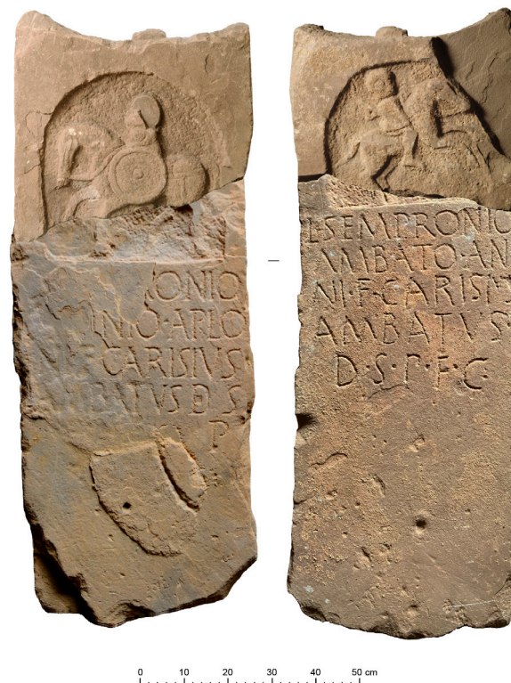
Figura 1. Estela de los Sepronii , Borobia. Izquierda, cara A. Derecha, cara B.

Tiene forma tendente al paralelepípedo con un remate cóncavo en cuya parte central se observa una protuberancia de tendencia hemisférica de 9 cm de diámetro (Figs. 1-2). No es fácil determinar si este particular remate corresponde al diseño original de la pieza o fue realizado tras su amortización. La estela está trabajada por las dos caras, en ambos casos con una misma estructura de carácter tripartito. En la parte superior de ambas caras presenta un jinete en relieve dentro de un nicho rehundido de remate semicircular. Bajo el nicho se encuentra el texto de la inscripción que se presenta sin ningún tipo de elemento que enmarque el campo epigráfico. El tercio inferior de la pieza, destinado a insertarse en el terreno, está sin trabajar, a excepción de dos orificios, uno en cada una de sus caras, de 3 y 2 cm y función incierta.