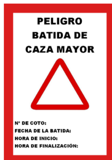
Modelo de señal de aviso de cacería en Aragón

https://medioambiente.jcyl.es/web/jcyl/binarios/387/872/22-MAM-TXT-Aviso-No-pasar-compressor.jpg