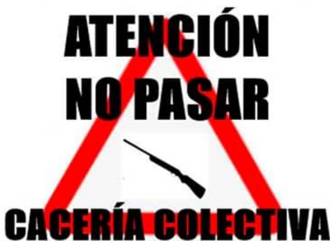
Modelo de señal de aviso de cacería en Castilla y León

En el artículo 40.2 de la LCCyL y en el artículo 45.11 de la LCAr se prevé que antes y durante el transcurso de cacerías en las que se empleen armas largas rayadas (caza mayor en general) deben colocarse señales situadas en las principales vías de acceso de forma visible para avisar de la realización de dicha actividad y así evitar que transeúntes y en cualquier caso personas ajenas, accedan al lugar, puesto que al menos en el caso de Castilla y León, que entre a la cacería señalizada cualquier persona que no participe en la misma está considerada como una infracción grave tipificada en el art. 84.2 de la LCCyL, cuya correspondiente sanción podría recaer en el titular del coto en caso de no haber tomado las suficientes precauciones para señalar correctamente. Para evitar esto, las señales en Castilla y León deberán tener 50 centímetro de ancho y 33 de alto, contener un triángulo rojo y la silueta de un arma en su interior, así como avisar con un texto en el que se prohíba el paso y advierta de la realización de la cacería. En el caso de Aragón las medidas serán de 29 centímetros de base y 21 centímetros de altura según lo dispuesto en el art. 45.11 de la LCAr y en el art. 20.5 y 20.6 del Plan General de Caza de Aragón para la temporada 2023-2024, en el cual también figura en su ANEXO XXVIII un modelo de señal.