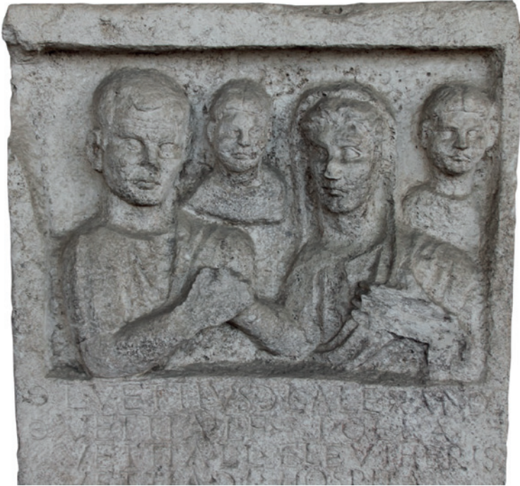
Fig. 6. Lápida funeraria del liberto Lucio Vetio Alejandro, Vetia Pola, de nacimiento libre, y las libertas Vetia Eleutéride y Vetia Hospita (EDCS-08900144), procedente de Aguzzano, actualmente en el museo de las Termas de Diocleciano (Roma). Cronología: c. 27 a. C. – 14 d. C.

La esclavitud supone un proceso de aculturación forzosa. Nacidas, compradas o capturadas, las esclavas tienen que aprender la lengua, los usos, los prejuicios y las prohibiciones de la ciudad en la que les ha tocado en suerte vivir. Algunas mostrarán orgullosas, al final de su vida, con cuánto entusiasmo han aprendido a ser romanas. No resulta fácil saber hasta qué punto eran esos sus verdaderos pensamientos, si eran sinceros o más bien se trata de palabras y frases falsas que se les atribuyeron. No tenemos, conviene insistir en ello, la versión de Hispala, Filematio o Crite. Otras esclavas, como veremos más adelante, desafiarán la norma y se alzarán contra ella, de maneras diferentes que van desde la huida a la rebelión abierta.