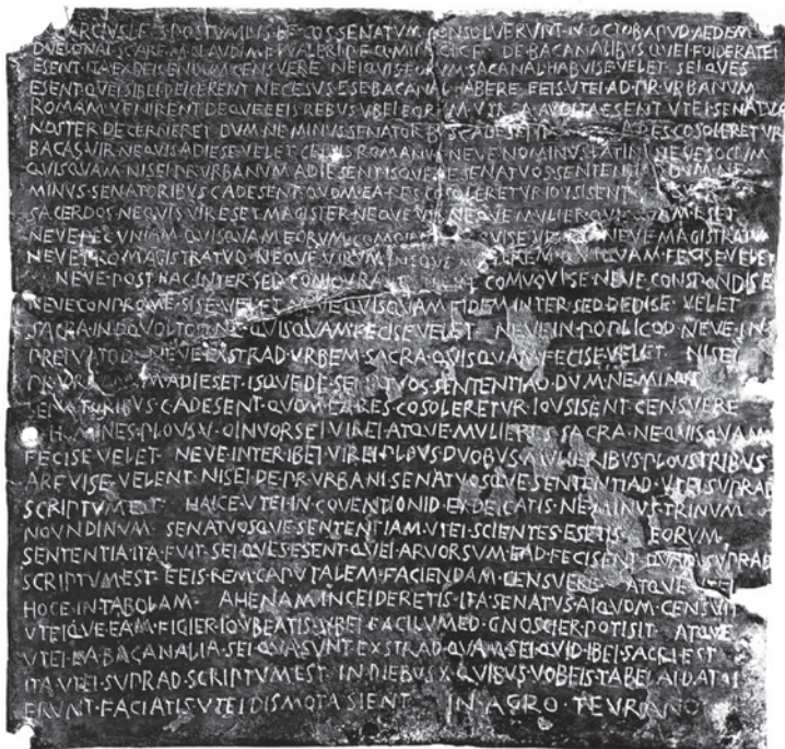
Fig. 2. Senadoconsulto sobre las Bacanales. Kunsthistorisches Museum, Viena. Dominio público, a través de © Wikimedia Common.

186 a. C. Si sabemos, con todo, que la tradición quiso que fuese una liberta y prostituta, precisamente ella, quien prestase servicios tan señalados a Roma, alertando del peligro de una conjura de extensas raíces. Aunque muchos habían caído en las redes báquicas, ella, tan pronto fue libre y pudo decidir por sí misma, se mantuvo alejada de tan extranjeros ritos, por sentido moral, no queriendo tomar parte en esta conspiración. No fue la única en su rectitud, aunque sí la más famosa. Livio quiere marcar aquí los inicios de la decadencia moral de la República, debido a la llegada a Roma del lujo y los cultos orientales, pero también poner de relieve qué medidas se tomaron para frenarlos y quiénes fueron los primeros en dar la voz de alarma. Resultaba confortador comprobar hasta qué punto algunos esclavos o libertos, pese a sus indignos orígenes, habían sido