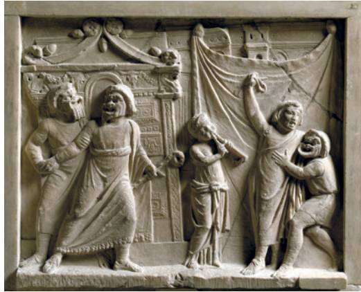
Fig. 13. Relieve pompeyano en el que se representa una comedia. Museo Nacional de Nápoles.

dia. Una recopilación de poemas obscenos conocida como Carmina Priapea menciona a una tal Teletusa, famosa entre las chicas de la Subura (un barrio de mala fama en Roma) porque se había ganado su libertad con el dinero que había logrado reunir con su trabajo.