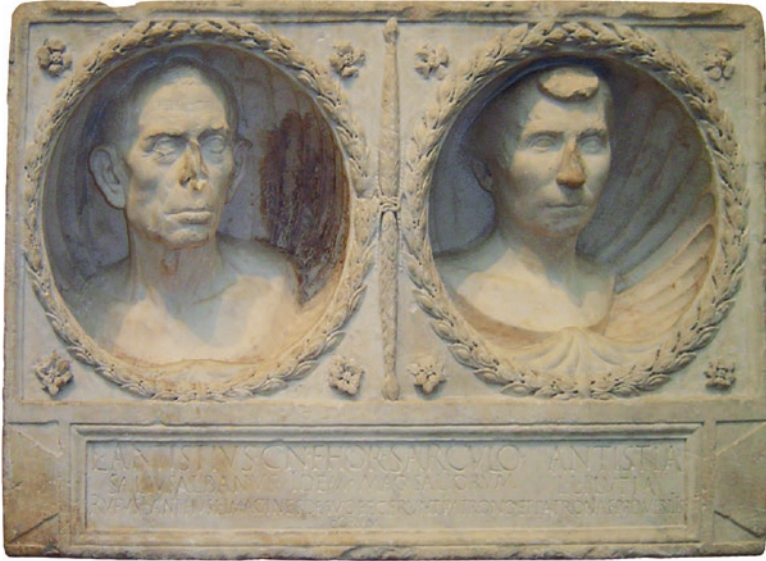
Fig. 14. Inscripción de Lucio Antistio Sárculo y su liberta y esposa, Antistia Plutia, procedente de Roma y depositada en el Museo Británico (EDCS-18100886). Fecha: entre 50 y 1 a. C.

debemos regresar una vez más. Entre las recompensas que mereció su noble acción, se cuenta una solemne declaración del Senado: que el hombre de nacimiento libre ( ingenuus ) que se casase con ella no debía sufrir ningún daño en su reputación por ese motivo, una cautela que tal vez obedeciese no tanto o no solo a su condición de antigua esclava, sino a su oficio de prostituta. Este descrédito fue precisamente el que llevó, a su vez, a Augusto a vetar los matrimonios entre hombres de nacimiento libre y meretrices ( Reglas de Ulpiano , 13.2), que es exactamente el supuesto que tomaba en consideración el Senado en su declaración pública. En todo caso, los matrimonios mixtos eran poco habituales y las excepciones se daban solo si la distancia social no era demasiado elevada. Por lo general, los libertos se casaban entre ellos.