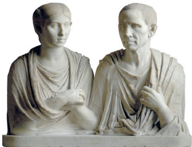
Fig. 4. Los denominados «Cátón y Porcia». Museo Pio Clementino (Museos Vaticanos). Fines siglo I a.C.

con otra de carácter más popular. En cuanto a la primera, el día de su fiesta, celebrada en casa de un magistrado, no podían asistir varones, sino solo ilustres matronas romanas y sus esclavas. Pertenece al ámbito de lo femenino, lo que excluía a los animales machos e incluso a las estatuillas que los representasen a ellos o bien a varones, las cuales se cubrían púdicamente con una tela durante las ceremonias para no resultar visibles. Fue precisamente una esclava la que descubrió la presencia de un intruso disfrazado de mujer —Publio Clodio— alertando a todos, lo que originó un considerable escándalo que desembocó en un famoso juicio en el año 61 a.C. Además de este culto aristocrático, a través de inscripciones de diversas ciudades de Italia, conocemos otro más popular, protagonizado sobre todo por libertas. No fue Bona Dea la única divinidad que eligieron las esclavas como destinataria de sus devociones. En Minturno, dos libertas, una mujer nacida ya libre y dos esclavas hicieron una ofrenda a Venus; se refirieron a sí mismas como «magistras del culto», lo que significa que, de alguna manera, lo presidían ( CIL I 2 2685 , aunque la lectura es incierta).