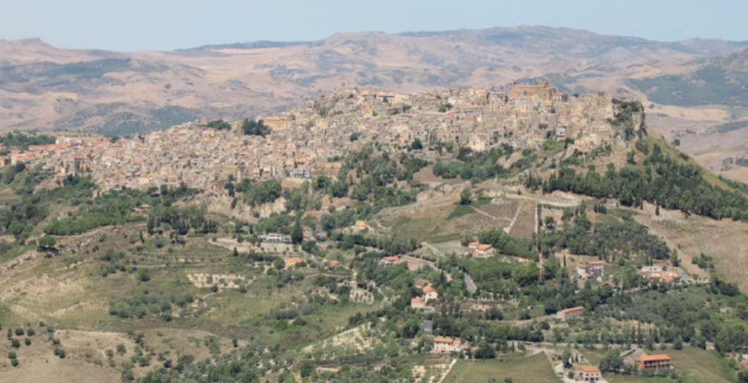
Fig. 15. Enna, Sicilia, el lugar de inicio de la primera guerra servil.

tado Demófilo pese a que su habilidad retórica casi logra que le perdonen la vida. El caudillo de los esclavos, Euno, ordenó a continuación que Megalis fuese entregada a sus esclavas, quienes la torturaron y la arrojaron después desde un acantilado. Es tentador mencionar aquí un canon del concilio cristiano de Elvira (la actual Granada) que castiga con una muy leve sanción eclesiástica a la dueña que, por celos, hubiese azotado hasta la muerte a una de sus esclavas: siete años de excomunión si lo hizo voluntariamente y cinco si solo se le fue la mano. El concilio se celebró a principios del siglo IV d.C., de manera que lo separan varios siglos de lo sucedido en Sicilia, pero la total indefensión de las esclavas, expuestas cotidianamente a la brutalidad de sus dueños, hombres y mujeres, forma parte estructural del sistema y no parece que haya sufrido grandes cambios con el correr del tiempo.