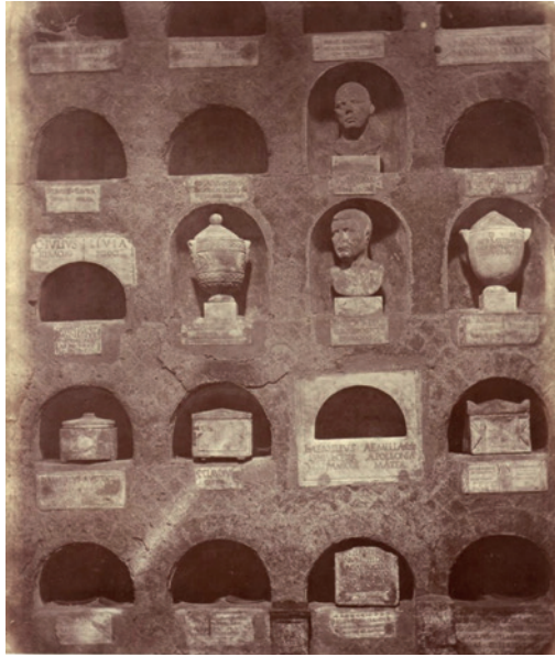
Fig. 8 Fotografía del Columbarium n.º 2 en Vigna Codini

También había esclavas en la ciudad, trabajando en oficios muy diversos, a menudo en las casas de los poderosos. Tenemos alguna información precisa gracias a los llamados columbaria , es decir, conjuntos de nichos situados bajo tierra o semienterrados donde se contenían las urnas con las cenizas de los empleados domésticos de algún aristócrata. Pertenecen a un momento cronológico concreto, entre finales de la República y mediados del siglo I d. C., y muchas de ellas van acompañadas de una inscripción con el nombre del fallecido y, a veces, también su oficio (fig. 8). Por estas inscripciones sabemos que la mayor parte de los sirvientes que trabajaban en las grandes casas eran varones. Las mujeres, a su vez, en muy raras ocasiones dejan constancia de su profesión, de su cometido concreto. Las más habituales son peluqueras (figs. 9 y 10), comadronas o nodrizas, pero también hay algunas dedicadas a tareas muy específicas, como la esclava que custodiaba los espejos o la guardiana de las perlas. Es probable que el tener asignado un cometido concreto quedase reservado a unos pocos, lo que apunta a la existencia de un sistema jerárquico entre los domésticos, en el que los puestos elevados los ocupaban mayoritariamente varones.