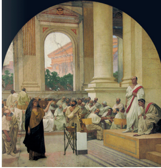
Fig. 1. Cesare Maccari, La Iberta Fecenia Hispala denuncia la asociación de las Bacanales , actualmente en la Corte Suprema di Cassazione, Roma.

tamento. Teniendo ya toda la información en su mano, el cónsul pudo convocar al Senado para adoptar medidas punitivas contra estos ritos báquicos y apresar a sus cabecillas. Escribió cartas a diversos lugares de Italia, comunicándoles los decretos del Senado, y una de ellas, transcrita en bronce, ha llegado hasta nosotros; por ella sabemos que el Senado prohibió que asistiesen a los ritos más de cinco personas en total y nunca más de tres hombres o dos mujeres (fig. 2). Una vez aplastada la amenaza —eran más de siete mil los conjurados—, la recompensa que obtuvo Hispala estuvo acorde a sus méritos, pues recibió cien mil ases (una cantidad exorbitante de dinero) y, por indicación del Senado, el pueblo aprobó una ley que le permitía elegir tutor y declaraba que, si se casaba con un hombre de nacimiento libre, este no debía sufrir ningún daño en su respetabilidad. Ignoramos quién fue el elegido, aunque casi con total certeza no el propio Ebucio, quien recibió idéntica cantidad de dinero como recompensa, sino algún otro.