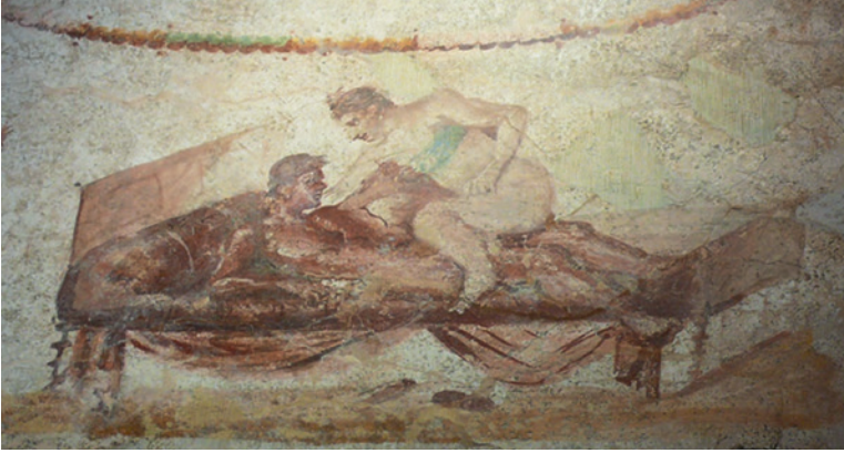
Fig. 12. Lupanar de Pompeya.

porque es más listo que su amo, es decir, un trickster , el tramposo simpático presente en diversas mitologías, pero también en la literatura, desde los bufones medievales hasta la figura del «pillo» o el pícaro. La mayor parte de las veces, aunque no siempre, el engaño sale bien y los burladores obtienen lo que desean.