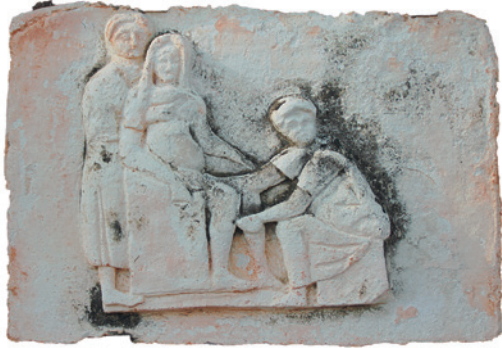
Fig. 11. Relieve de Isola Sacra, Ostia (copia). © Pedro López Barja.

ma a sus hijos (e incluso a los de sus esclavas), pero esto era probablemente algo excepcional y extravagante y, por ello, digno de mención. El médico griego Sorano de Éfeso, en su tratado de ginecología (2.19.99-100), recomienda que la nodriza sea griega para que el lactante se acostumbre al sonido de «la más bella de las lenguas». Todo indica que el recurso a las nodrizas estaba muy extendido entre las clases altas de Roma, debido tal vez al deseo de las mujeres de elevada cuna de no interrumpir sus actividades sociales ni su vida pública o por diversos motivos sociales y personales. Sin embargo, aunque tal vez en menor medida, se utilizaban también entre personas menos encumbradas. Podemos descender un escalón social y llegar a clases más populares gracias a los contratos de nodrizas que conocemos, procedentes de Egipto y conservados en papiro. Son muy minuciosos en cuanto a las condiciones que se establecían, al modo y plazos de los pagos o a la obligada abstención sexual de la nodriza, quien debía asimismo alimentarse adecuadamente y mantenerse con buena salud en general.