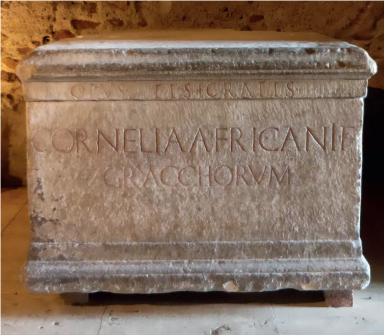
Fig. 6. Cornelia, madre de los Graco. Tabularium, Roma. Wikimedia Commons.

De estas cartas se conservan algunos fragmentos transmitidos por el historiador Cornelio Nepote ( Sobre los historiadores latinos , 1-2) en los que expresaba su posición política. Para su significación no importa tanto si los fragmentos que leemos en Cornelio Nepote son auténticos o apócrifos. Lo relevante es que el valor simbólico de su nombre fue lo suficientemente importante como para transmitir o «crear», si así hubiera sido, su epistolario.