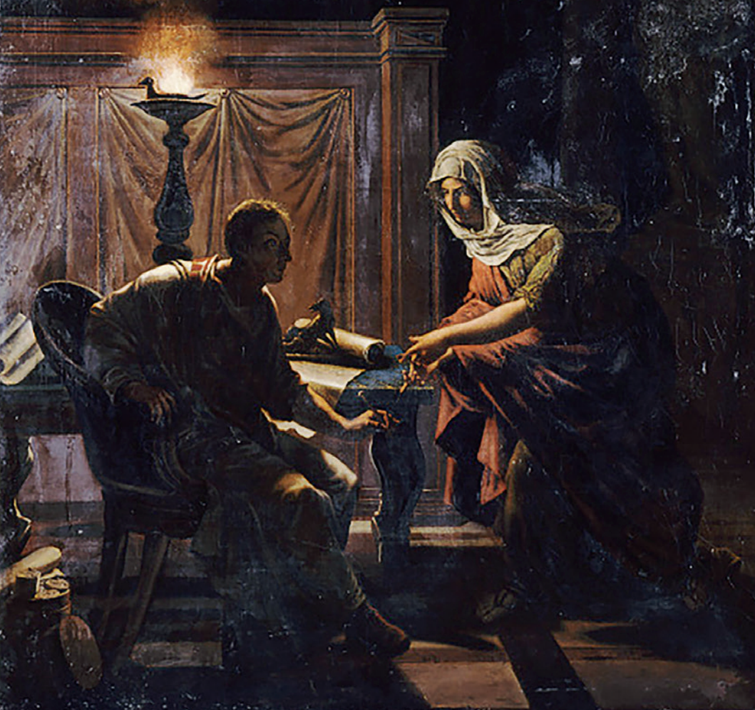
Fig. 9. Fulvia descubriendo a Cicerón la conjuración de Catilina , Nicolas-André Monsiau (1827).

En realidad, la imponente figura de Cornelia se construyó sobre una mezcla de tradición romana y virtudes estoicas, una filosofía que predicaba el control de las emociones y la indi-