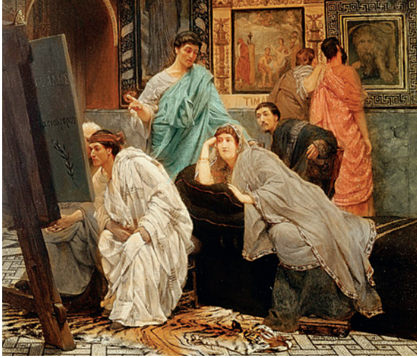
Fig. 5. La aristócrata romana. Alma Tadema, The collector of pictures at the time of Augustus .