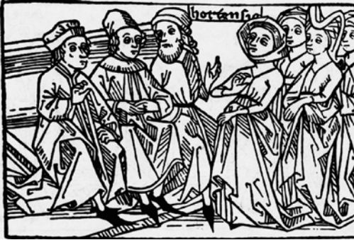
Fig. 4. Hortensia ante los triunviros. G. Boccaccio, De Mulieribus claris .