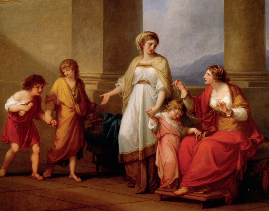
Fig. 7. Cornelia, madre de los Graco , Angelika Kauffmann.

discursos públicos (Plutarco, Cayo Graco , 4.5-6; Séneca, Consolación a Helvia , 16.6), o la intervención directa de Cornelia para que su hijo anulase una de sus medidas legislativas, ganándose con este acto la aprobación del pueblo de Roma (Plutarco, Cayo Graco , 4.2-3). Asimismo, Plutarco comenta que Cornelia llegó a contratar a un grupo de falsos campesinos para que protegieran a Cayo en la sedición que tuvo lugar en Roma previa a su muerte (Plutarco, Cayo Graco , 13.2). Mucho menos verosímil parecen, sin embargo, las noticias de su implicación, junto con su hija, en la muerte de su yerno Escipión Emiliano, contrario a los Graco (Apiano, Guerras civiles , 1.20).