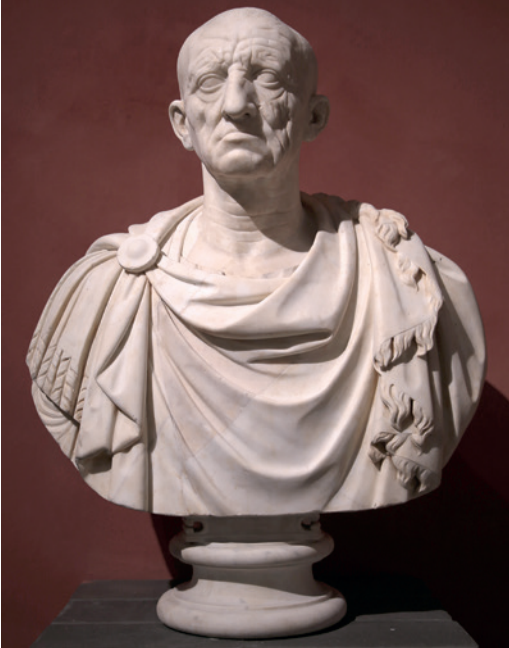
Fig. 2. Posible busto de Catón. Wikimedia Commons.