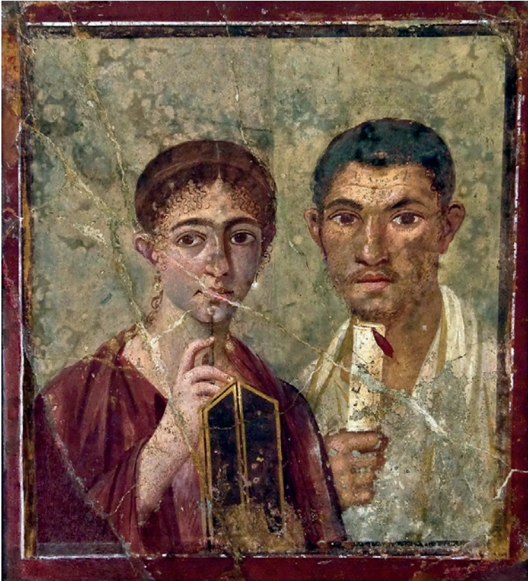
Fig. 10. Pareja pompeyana. Siglo I a. C. Museo Arqueológico de Nápoles.

Es un hecho que la generalización del matrimonio sine manu permitió a la mujer romana conservar su patrimonio y disponer con más libertad de sus bienes. Como resultado de todo este proceso, en Roma a finales de la República no solo había muchas mujeres que administraban su propio patrimonio y que, además, eran ricas, como ya se ha mencionado, sino que el uso de estas riquezas permitió a las ciudadanas romanas neutralizar, en gran medida, sus incapacidades en el ámbito público o político.