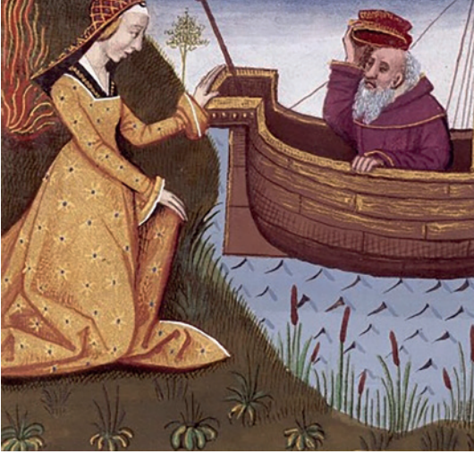
Fig. 3. La lemnia Hipsípila salva a su padre Toas.

novedades que al lector de su obra le pueden interesar. Efectivamente, al intenso debate político se incorpora un elemento poco habitual: la opinión pública femenina, que, a falta de canales de representación, se manifiesta abiertamente por las calles de Roma. No es que las mujeres de Roma no se hubieran manifestado anteriormente y ocupado los espacios públicos. Durante la segunda guerra púnica, cuando llegaron a Roma las noticias de la derrota militar de Trasimeno, las mujeres salieron de sus casas y se dirigieron al foro, donde se concentraron durante varios días esperando conocer la suerte del ejército (Tito Livio, Desde la fundación de la Ciudad , 22.7.6-14); lo mismo ocurrió tras la derrota de Cannas (216 a.C.). En este caso, era tan ensordecedor el clamor de las mujeres que se ordenó a los senadores mantener a las matronas, es decir, a las mujeres casadas, alejadas de los lugares públicos y obligarlas a que cada una estuviera en su casa (Tito Livio, Desde la fundación de la Ciudad , 22.55.6-7). Se puede observar que en ninguna de estas y otras circunstancias similares se incorporan al relato juicios denigratorios en relación con el comportamiento de las ciudadanas que salieron de sus casas para expresar públicamente su dolor y exigir noticias de la guerra y de sus seres queridos.