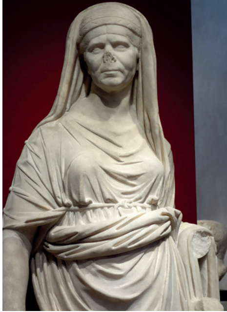
Fig. 11. Sacerdotisa romana. Museum of Fine Arts, Boston.

corrupción y lograban su condena ante los tribunales romanos. La empresa era bastante difícil y costosa, pero no por ello dejó de ser intentada con éxito por individuos ambiciosos de las ciudades de Italia. En este caso, la ley establecía expresamente que las hijas e hijos y descendientes podían acompañar al padre en el acceso a la ciudadanía romana. No se hacía mención, sin embargo, ni a la esposa ni a la madre del acusador.