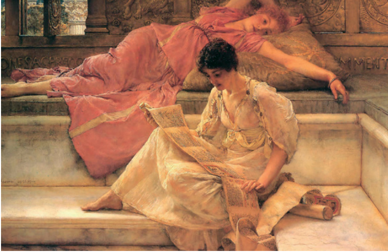
Fig. 1. La lectora de poesía. Lawrence Alma-Tadema, Favourite Poet (1888). Lady Lever Art Gallery, Liverpool.