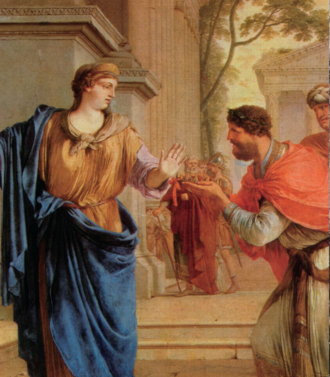
Fig. 8. Cornelia rechaza la corona de los Tolomeos (detalle). Laurent de La Hyre (1646). Museo de Bellas Artes de Budapest. Wikimedia Commons.

portó la muerte de sus hijos y la imperturbabilidad de la que hizo gala está lleno de lenguaje y conceptos estoicos (Plutarco, Cayo Graco , 19) (fig. 8).