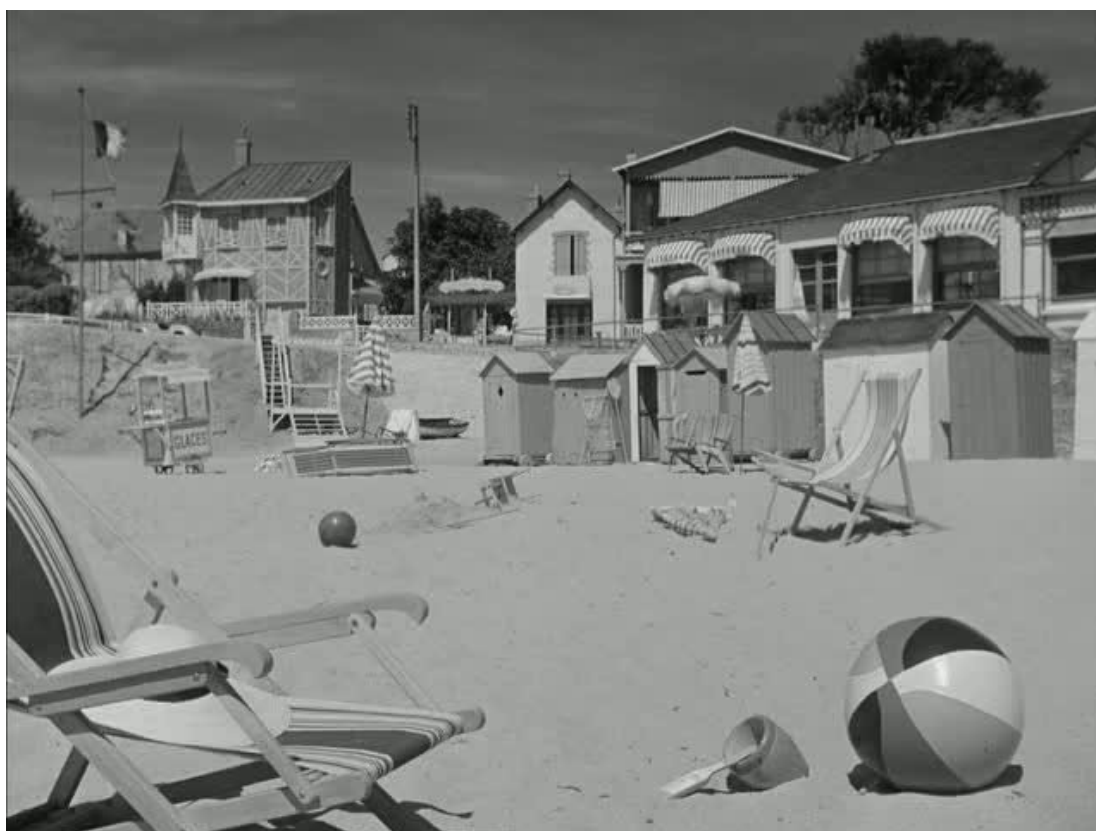
F. 7 y 8. Hulot en el paisaje turístico de Saint-Marc-sur-Mer.