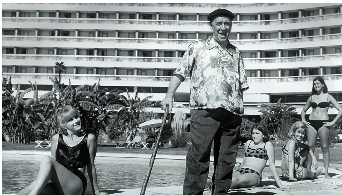
F. 5 y 6. Fotogramas de Benito en el pueblo y en el paisaje turístico de las playas de Marbella (Málaga). © Juan Mariné. Fuente: https://www.movistarplus.es/cine/el-turismo-es-un-gran-invento/ficha?tipo=E&id=13897