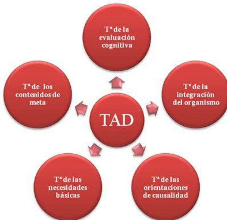
Figura 1. Esquema de las mini-teorías que forman la teoría de la autodeterminación (TAD). Extraída de Almagro (2012)

Muchas investigaciones que se han observado y estudiado para realiza el presente trabajo dividían la teoría de la autodeterminación en 4 mini teorías, esto era correcto hasta hace unos años, ya que se hablan de 5 mini teorías en la actualidad. La última a explicar es la teoría más reciente que se ha realizado. De estas cinco, en la propuesta de intervención realizada en la parte práctica, se trabaja la número cuatro, teoría de las necesidades básicas, que más adelante será explicada en más profundidad.