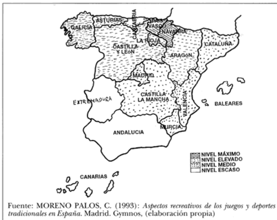
Cuadro 1. Distribución de los juegos y deportes tradicionales en España

La inclusión de este cuadro nos permite una primera visión de la presencia de los juegos tradicionales en las diferentes comunidades autónomas, por lo que podemos partir de un hecho claro: Aragón es una comunidad con una fuerte presencia de dichos juegos, mientras que en Andalucía su presencia es mínima.