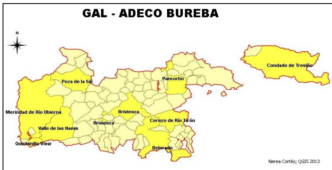
Figura 46. GAL ADECO BUREBA y municipios más representativos en amarillo oscuro. Prueba realizada en QSIG