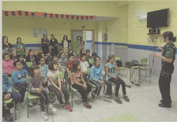
La Guardia Civil dio ayer una charla sobre los riesgos en internet a los alumnos del colegio de Tierz.