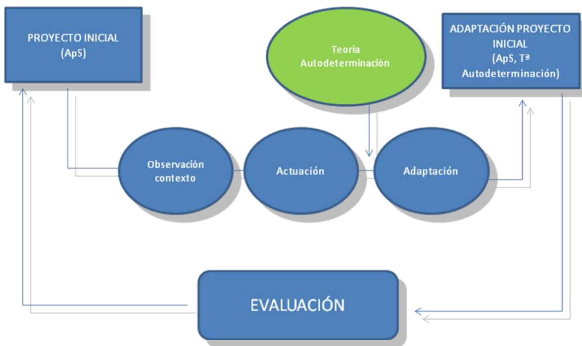
Ilustración 3: Proceso proyecto innovación