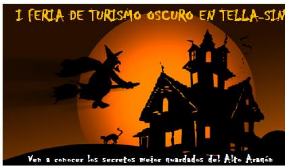
Imagen 5: Feria anual en Tella-Sin