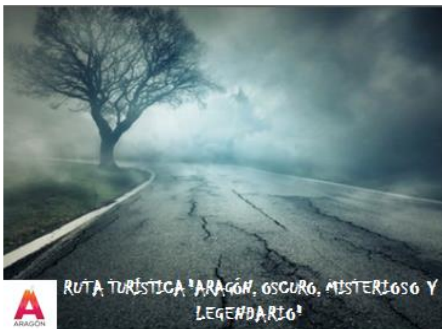
Imagen 3: Diseño para la ruta "Aragón, oscuro, misterioso y legendario"