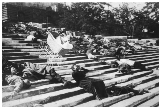
Figura 3: Escena Acorazado de Potemkin (1925)