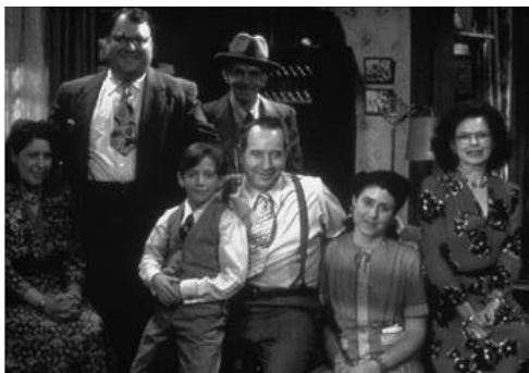
Figura 1: Días de radio (1987)

abuelos, tías y tíos. Y en un determinado periodo de mi infancia viví en una casa al lado del agua. En Long Beach. Sí, muchas de las cosas que se ven en la película ocurrieron realmente’’ 23 [Fig.1].