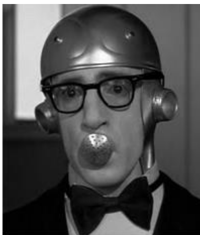
Figura 4: El Dormilón (1973)

Hay varios aspectos destacables: es la primera vez que trabaja con Brickman, con quien contará en otras ocasiones; también es la primera vez que aparecen sus característicos títulos de crédito, muy bergmanianos, en blanco sobre fondo negro; además es la primera película con Diane Keaton y la primera (y única) vez que él mismo interpreta la banda sonora de la película.