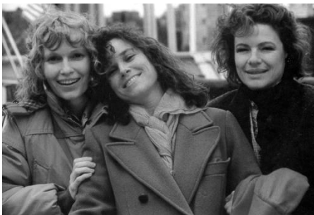
Figura 8: Hannah y sus hermanas... (1986)

En 2013 realiza Blue Jasmine donde hace un retrato de la sociedad adinerada neoyorquina. De nuevo vemos un tema que ha repetido varias veces, Jasmine tiene que encontrarse cuando su vida se desmorona, y este drama se desarrollará en un tono de comedia gracias al resto de personajes que no pertenecen a esa alta sociedad.