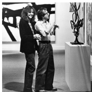
Figura 6: Manhattan (1979)