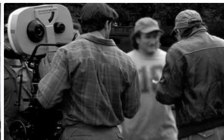
Figura 16: Desmontando a Harry (1997)

Jorge Fonte afirma en su libro que “no se estancó en ese estilo con el que había logrado el éxito, sino que siguió experimentando, buscando nuevas formas de expresión artística con las que poder dar rienda suelta a su inagotable creatividad”. 32