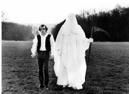
Figura 12: La última noche de Boris Grushenko (1975)

En segundo lugar El sueño de Casandra (2007), es un drama que reflexiona sobre el sentimiento de culpa que se debería sentir tras cometer un asesinato. También la suerte vuelve a aparecer como un punto importante en nuestras vidas.