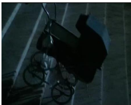
Figura 2: Escena Bananas (1971)

Aquí vemos algunas de las características aplicables a la mayoría de sus obras, por un lado, su esposa en ese momento obtiene el papel de actriz principal. También realizará, intencionadamente o no, referencias a películas que han marcado su vida o la historia del cine, en este caso vemos una cochecito de bebé [Fig.2] caer por unas escaleras donde se está librando una batalla, refiriéndose al clásico Acorazado de Potemkin (1925) de Einsenstein [Fig.3].