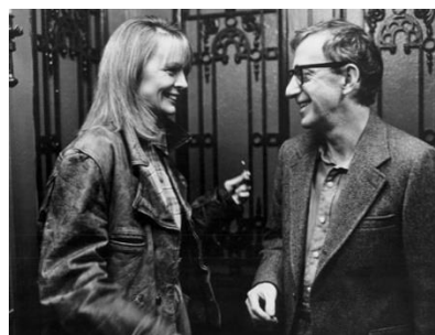
Figura 7: Misterioso asesinato en Manhattan (1993)

Entrando en sus últimas producciones, Todo lo demás (2003) Allen da un paso atrás ya que podría tratarse de una nueva Annie Hall adaptada a los tiempos que corren.