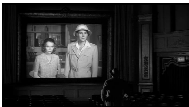
Figura 11: La rosa púrpura de El Cairo (1985)

Woody Allen declaró al periodista Eric Lax: “ habría un actor que interpretaría al personaje, la idea empezó a tomar cuerpo. Cuando se me ocurrió, que para el actor, también sería un problema, y que yo tendría un personaje completamente ficticio y un personaje real idéntico a él, pensé que la idea resultaba lo bastante jugosa para hacer una película entretenida y que hablara de la diferencia ente fantasía y realidad, de lo seductora que puede resultar la fantasía y de que, desgraciadamente, debemos vivir con la realidad, y de que eso puede ser muy doloroso ” 28 [Fig.11].