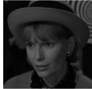
Figura 10: Alice (1990)