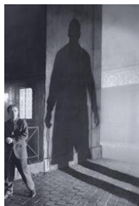
Figura 15: Sombras y niebla (1991)