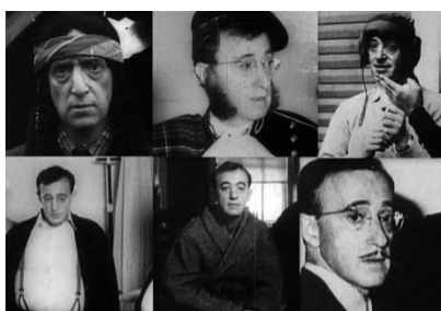
Figura 14: Zelig (1983)