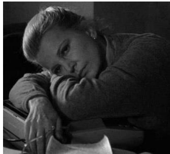
Figura 9: Otra mujer (1987)