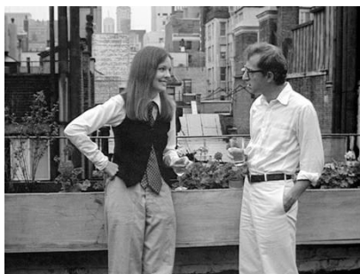
Figura 5: Annie Hall (1977)

Se puede establecer un paralelismo entre esta película, Annie Hall y Manhattan . Podría tratarse de una trilogía [Fig.5-6-7] ya que comparten algunos puntos en común: las tres dirigidas, escritas e interpretadas por las mismas personas, aunque el argumento cambie, la puesta en escena y al trasfondo las unifica.