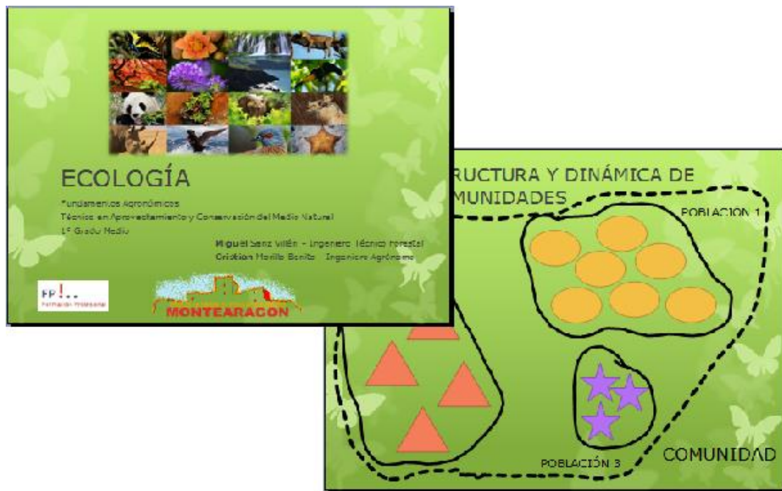
Ilustración 3: Presentación utilizada para impartir las clases.

figura 3 puede verse el resultado de algunas de las diapositivas de la presentación que elaboré para impartir las clases.