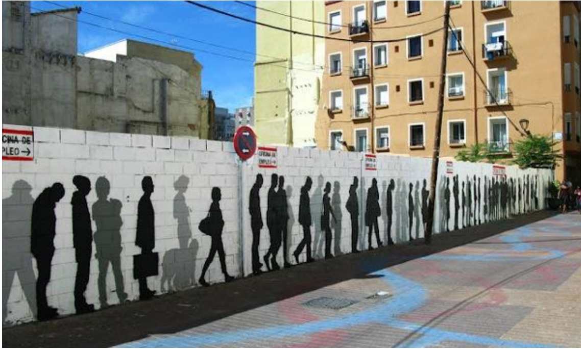
Above, calle San Pablo 7-17 (Fuente: https://streetartgaleryzaragoz.wordpress.com/2013/09/16/above/ , consultada en junio de 2015).

Continuando por la calle Sacramento, en la intersección con calle Las Armas aparecen dos piezas pertenecientes a otros dos artistas. El primero de ellos es Yomimoko & Co cuya obra se encuentra en el número 73 de calle Las Armas, realizada para el octavo Asalto en 2013. Yomimoko & Co se trata de un colectivo nacido en Zaragoza con la necesidad de dar cauce a diferentes visiones de la ciudad desde una perspectiva arquitectónica y social. Experimentan con nuevas formas de narración plástica como vemos en ésta obra y la ciudadanía toma un papel activo. Buscan la idea de “agitar la vida pero dejarla libre para que se desarrolle “según ellos.