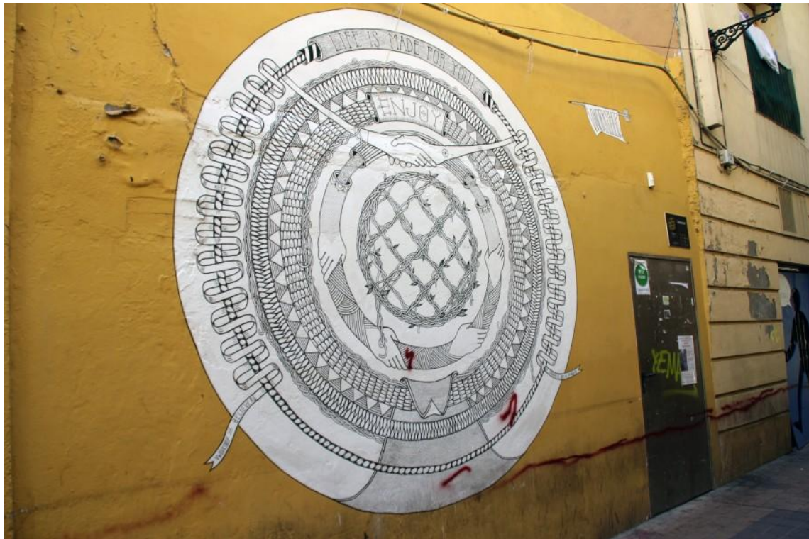
VWorkshop, calle Broqueleros 14.