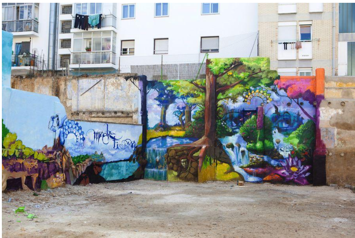
El niño de las pinturas, calle Las Armas (Fuente: https://callemuseo.wordpress.com/2013/03/28/ruta-recomendada-por-los-graffiti-de-san-pablo/ , consultada en mayo de 2015).

Aquí vemos estas características, pues nos encontramos un bosque con un río que, a su vez, forma un rostro de una mujer que mira hacia el espectador. Vemos como juega con el ojo humano y la óptica, algo también es común de su estilo, y se funde en una naturaleza colorida que combina con la obra de Popay creando ambos un todo de vegetación en tonos vivos.