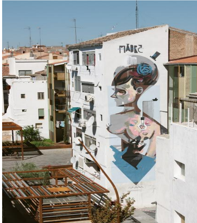
Xabier XTRM, plaza interior de calle Las Armas (Fuente: http://www.festivalasalto.com/septimo-asalto-2012/ , consultada en junio de 2015):

cabeza en tono oscuro de un animal dentado. Todo ello se aúna en un juego de claroscuro que armoniza con la superficie existente. Realiza estas obras mediante extensores y pintura plástica, técnica con la que se siente cómodo y a su vez, le está posibilitando desarrollar y profundizar en su línea de trabajo de gran formato.