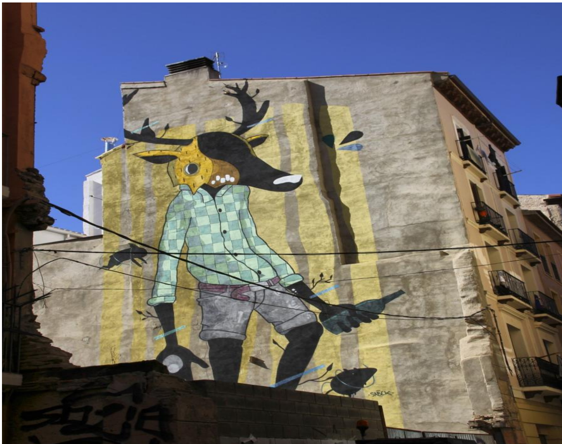
Sabek, calle Las Armas 7 (Fuente: http://www.plataformadeartecontemporaneo.com/pac/8%C2%AA-edicion-festival-asalto/ , consultada en agosto de 2015).

En esta obra nos encontramos un ser antropomorfo, mitad humano y mitad ciervo (una tipografía típica suya). La idea que Sabek nos quiere transmitir es la preocupación por una sociedad en la que no existe un equilibrio entre el ser humano y la naturaleza, una sociedad cuyos valores se encuentran en continua disputa con lo que realmente somos o con lo que queremos ser. El ser aparece de pie pero alicaído y sujeta una botella que habla de los instintos viscerales y arcaicos, simbolizando el sentimiento de estar perdido y no saber muy bien a donde se pertenece. Es pues, una obra con una gran carga simbólica y crítica cuya conclusión final es que los instintos naturales, que se encuentran aparentemente escondidos, son los que nos dirigen finalmente y los que conforman la realidad. 29