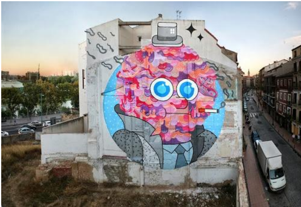
GR170, calle Predicadores

En este muro pintado por GR170 en el año 2013 para el Octavo Festival del Asalto nos encontramos una obra que nos remite a la teoría del decrecimiento. Se trata de una especie de gran chicle que forma una cabeza con rostro simbolizando un gentleman que fuma y que nos recuerda al perfil estadounidense de principios del siglo XX. Lo podemos apreciar en detalles como la gabardina con el cuello subido o el sombrero que remata la cabeza. Se trata de una crítica al consumo y la producción que nos haga conscientes del momento y el desarrollo que estamos viviendo y no víctimas de una filosofía capitalista que solo favorece a unos pocos y en la que nos sumimos sin reflexión alguna. Estas son las ideas que GR170 quiere transmitirnos en esta obra de calle Predicadores. 23