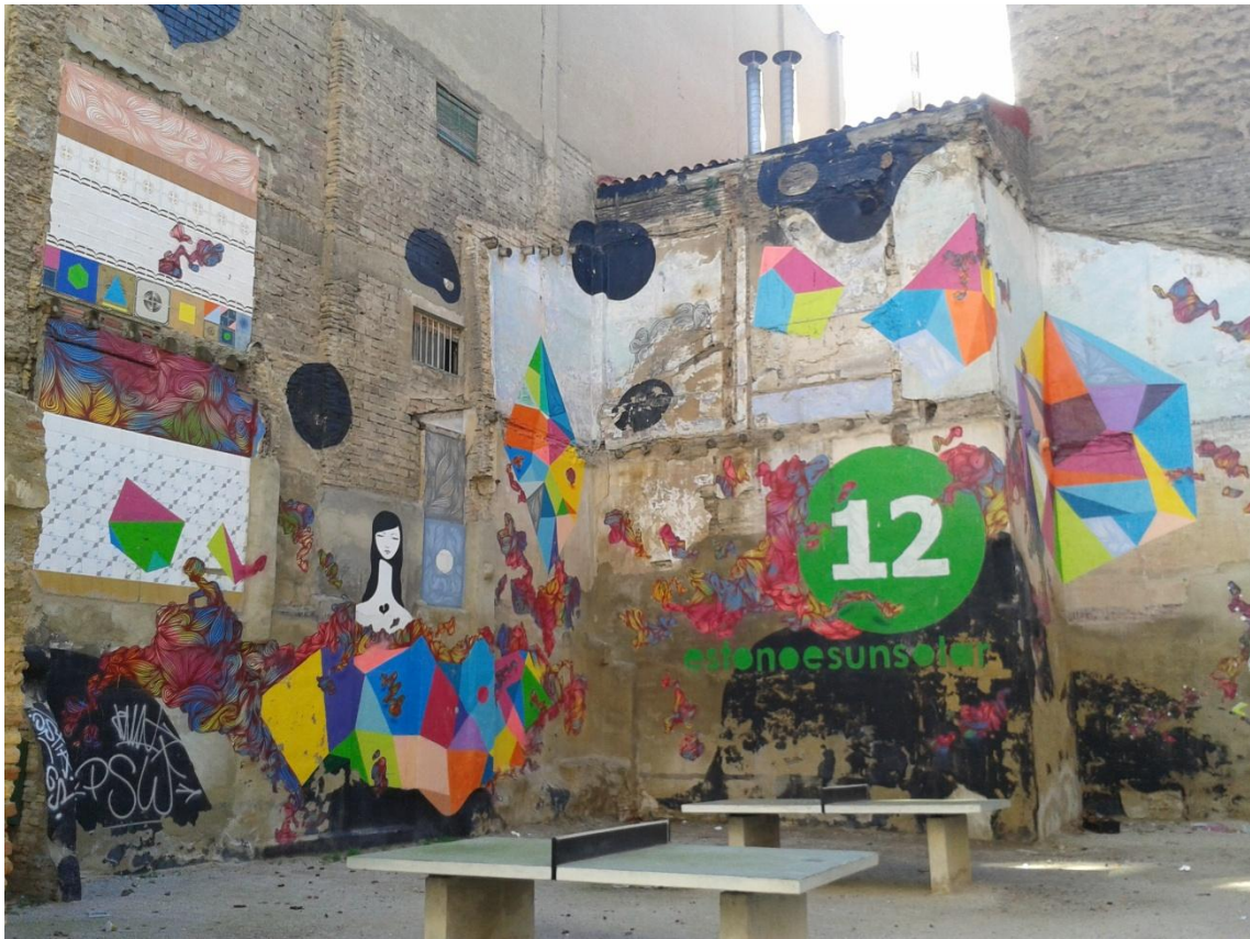
Rosh333, calle Mayoral 44 (Fuente: https://callemuseo.wordpress.com/2013/03/28/ruta-recomendada-por-los-graffiti-de-san-pablo/ , consultada en junio de 2015).

En la calle Mayoral 44, hay también un importante mural del artista madrileño Spok, realizado nuevamente para el sexto Asalto. Spok se crio en las ramas del graffiti más arriesgado, pintando trenes y obras clandestinas hasta que poco a poco fue viendo, según el mismo nos cuenta, como aquello ya no lo hacía con la misma pasión y poco a poco empezaba a no importarle la guerra de tagging sino que se iba fijando en los muros, la evolución de estilos, de formas, de tipografías... Comenzó a valorar ello alejándose de ese graffiti más guerrero y poco a poco fue sumando a esta experiencia la perspectiva de la formación académica y ello ha hecho que Spok haya conseguido desarrollar una excepcional capacidad técnica, con óleo y aerosol, creando un lenguaje visual muy personal. Ello le ha conducido a proyectos personales, exhibiciones, trabajos comerciales, etcétera. 28