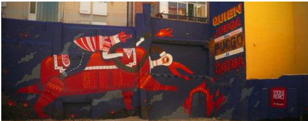
100 Pression, calle Las Armas (Fuente: http://www.callezaragoza.es/noticias/el-septimo-asalto-tine-de-colores-el-casco-viejo-zaragozano/ , consultada en mayo de 2015).

En sus obras es común la relación con el fuego y con tonos rojos, amarillos y naranjas y se suelen valer de frases que encierran un significado, normalmente de crítica social. Además es común también el uso de animales extraños como el que vemos aquí. Se trata de un animal de tonos rojos y naranjas colocado de perfil sobre un fondo azul intenso que resalta la figura. En este caso el animal es una especie de perro vestido como un humano que cabalga sobre un pájaro con cuerpo de cartucho de dinamita con 4 patas y acompañado de la frase:” Quien juega con fuego se quema”. 12 Debajo de ésta encontramos un dibujo en el que aparece el edificio de un banco en llamas, mostrando así esa faceta de crítica social que hemos comentado.