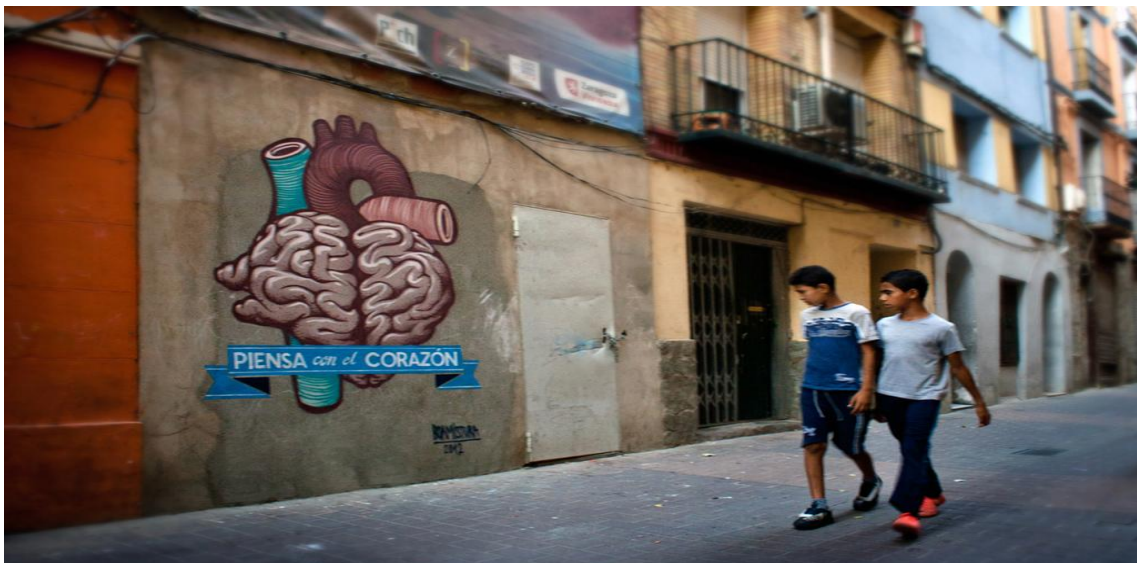
Boa Mistura, calle San Pablo nº100.

En la calle San Pablo nº 100, Boa Mistura nos deja una muestra más de su trabajo con una obra en la que aparece un corazón donde podemos apreciar las arterias y el interior del mismo y aparece la frase “PIENSA con el CORAZÓN”. Una obra más, en este caso más pequeña, ejemplo de su temática relacionado con la temática del grupo y su estilo estético.