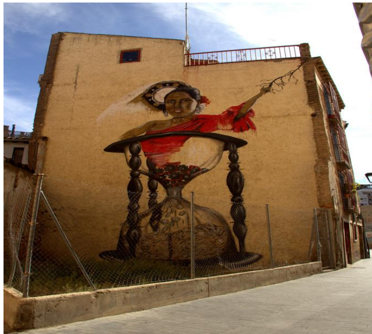
B. Shanti, calle Pedro Echeandía (Fuente: http://www.callezaragoza.es/noticias/el-septimo-asalto-tine-de-colores-el-casco-viejo-zaragozano/ , consultada en agosto de 2015).

Aquí nos encontramos una obra, realizada para el séptimo Asalto, con un aire irónico en el que juega con parte de la sociedad española. Se dice que representa a Isabel Pantoja en un reloj de arena que se consume y se va transformando en monedas al caer a la otra parte del reloj. Se trata de una metáfora social, una reivindicación al mundo en el que vivimos bajo la crítica a conceptos como el tiempo, la economía o la fama. Busca llamar la atención del espectador, provocarle para hacerle reflexionar sobre la sociedad y el sistema en el que vive. Quizá es uno de los murales de Zaragoza donde se plasma la crítica de manera más explícita pero que sin duda hace que el viandante reflexione en un simple callejón, de manera que acabe recordando ese lugar, cosa que no ocurriría sin la intervención del Street Art en esta parte. Otro ejemplo más de cómo el Street Art ha restaurado con su arte los muros y significados de muchas partes de Zaragoza.