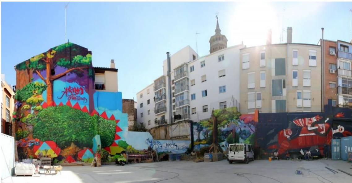
Plaza base Festival Asalto, calle Las Armas, (Fuente: http://misviajesporahi.es/2014/02/ruta-del-arte-urbano-de-zaragoza.html , consultada en mayo de 2015).

Comenzamos nuestro recorrido en la calle de Las Armas en dicho barrio. Encontramos una plaza en el centro de la misma que es utilizada por el festival Asalto para instalar su campamento base hasta éste último año. Se trata de una plaza que hace unos años era un lugar abandonado y sucio, foco de los problemas sociales del barrio, y recorrido por el que los viandantes preferían evitar pasar. Hoy encontramos obra de tres artistas en las paredes de ésta, algo que se consiguió gracias a la cesión del movimiento estonoesunsolar 9 , y el lugar ha cambiado gracias al Street Art, suponiendo una regeneración de la zona hacia un camino cultural- artístico que está cambiando la mentalidad y concepción del barrio.