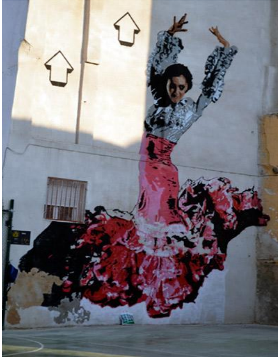
Above, calle Casta Álvarez (Fuente: http://diario.ociourbanozaragoza.es/2013/09/05/el-arte-urbano-asalta-zaragoza-por-octavo-ano/ , consultada en junio de 2015).

Encontramos otra pieza suya en la calle San Pablo 7-17 realizada también para el séptimo Asalto. Se trata de un muro de poca altura en el que el mural se extiende horizontalmente. Simboliza una oficina de empleo, letrero que pueden leerse, y una larga fila de personas esperando a sus puertas que se extiende a lo largo de todo el muro y no deja al viandante indiferente. De las personas vemos la silueta, una sombra negra que nos permite identificar diferentes personas cotidianas y que nos conduce a la idea de deshumanización que provoca el empleo a su vez que supone una crítica a la situación laboral y su sistema capitalista.