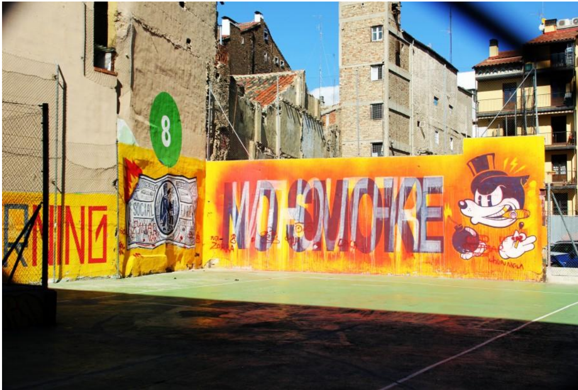
100 Pression, calle Basilio Boggiero 18-22

una blanca, de más difícil aprecio, que dice “without fire” acompañado del dibujo de un rostro animado que prende una bomba y una especie de billete similar a un dólar quemándose. En el fondo vemos los clásicos tonos del grupo amarillos, naranjas y rojos y esta obra es un ejemplo más de su arte donde predomina la crítica, la ironía y la originalidad de sus piezas.