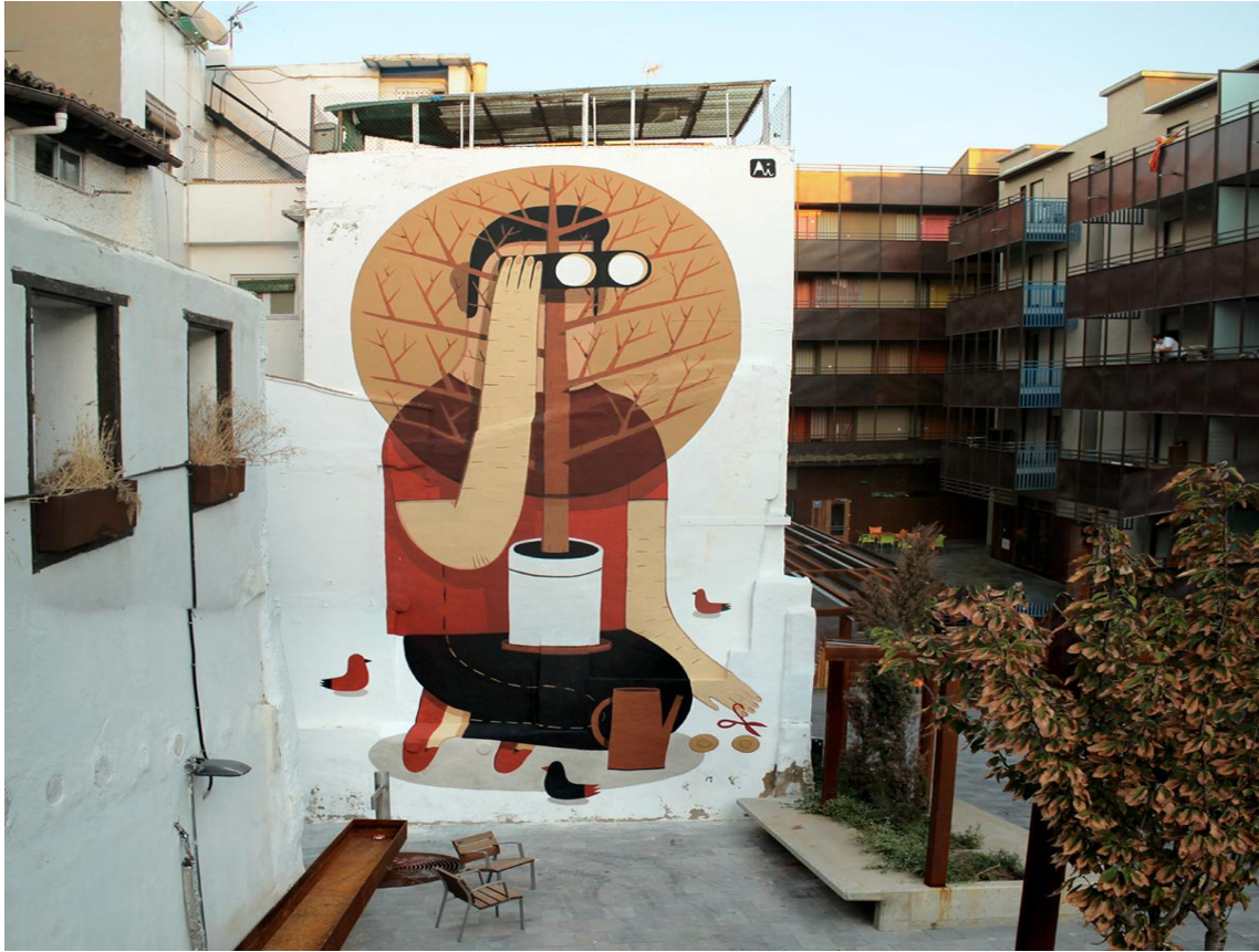
Agostino Iacurci, plaza interior de calle Las Armas (Fuente: http://www.agostinoiacurci.com/author/agostino-iacurci/page/2/ , consultada en junio de 2015.)

Prosiguiendo nuestro recorrido, tras la plaza interior de Las Armas, debemos ocuparnos de otros tres murales en la calle Predicadores, dos a media altura, por los que comenzaremos, y otro al final de la misma.