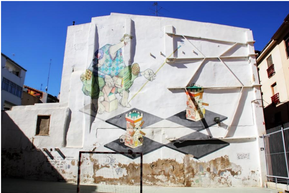
Sepeusz & Chazme, calle Casta Álvarez 43 (Fuente: http://www.festivalasalto.com/sesto-asalto/ , consultada en junio de 2015).

Relacionados con el graffiti y la escena de la calle desde 1996 cada uno tiene una forma individual de creación y ello lleva a mezcla en su obra, a la experimentación, combinando dos estilos diferentes de manera que las ilustraciones urbanas que realizan adquieren una calidad superior. Aquí encontramos una de sus típicas figuras de proporciones descompensadas con una diminuta cabeza acompañada de formas geométricas que juegan con el espacio y la tridimensionalidad. Todo se funde en un limpio acabado trabajado con el equilibrio y los volúmenes.