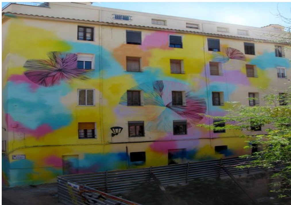
Rosh333, callejón del Sacramento (Fuente: http://www.festivalasalto.com/octavo-asalto-2013/ , consultada en junio de 2015).

En esta obra se ve una fachada de un edificio sumida en una sinfonía de colores claros donde aparecen una serie de círculos semejantes a mandalas. Estos colores aportan un tono onírico e imaginativo al edificio que pasa así a ser personal y único, con colores llenos de simbolismo y viveza que juegan con las emociones del espectador, separándole de la monotonía visual de las calles aledañas. Somos nosotros, los que a través de la contemplación, terminamos de crear la pintura. 27