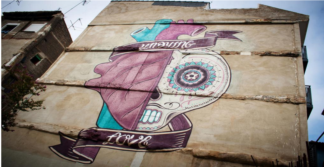
Boa Mistura, calle Las Armas (Fuente: http://www.boamistura.com/zaragoza.html , consultada en mayo de 2015).

En la calle San Pablo nº 100, Boa Mistura nos deja una muestra más de su trabajo con una obra en la que aparece un corazón donde podemos apreciar las arterias y el interior del mismo y aparece la frase “PIENSA con el CORAZÓN”. Una obra más, en este caso más pequeña, ejemplo de su temática relacionado con la temática del grupo y su estilo estético.