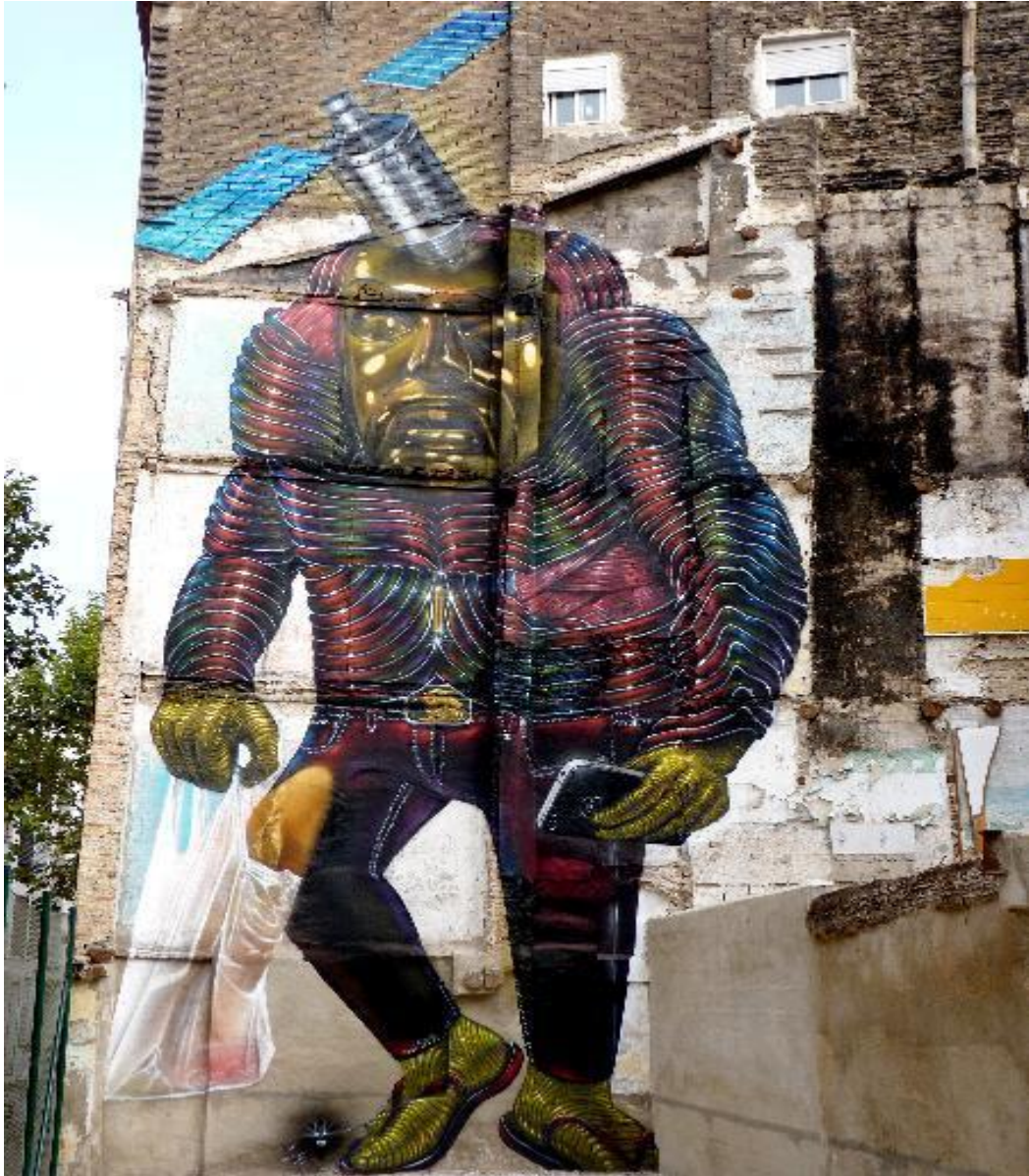
Spok, calle Mayoral 44 (Fuente: http://zaragozacoool.blogspot.com.es/2014_11_01_archive.html , consultada en agosto de 2015).

diversos objetos. Su cuerpo recuerda a los neumáticos, a su vez que su cara a una máscara primitiva, y un remate con un bote de spray a modo de helicóptero. Porta una bolsa de la compra en su mano derecha y un móvil en su mano izquierda y es que esta obra es una crítica a la rutina y a la sociedad industrializada en la que vivimos, sumida en la tecnología y totalmente deshumanizada de su condición natural y primitiva, de ahí el contraste entre el móvil y la máscara primitiva. Es una obra que muestra a la perfección la calidad técnica de Spok y su trabajo simbólico oculto.