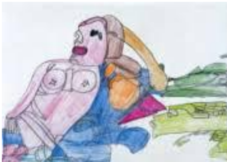
Fig. 3. “Desnudo de mujer tumbada”. Curzio di Giovanni. 2003. Mina de plomo y lápices de colores. 23,9x34,2 cm. Esta obra es un claro reflejo del cambio estético y la ruptura total con el ideal de belleza implantado desde la antigüedad.