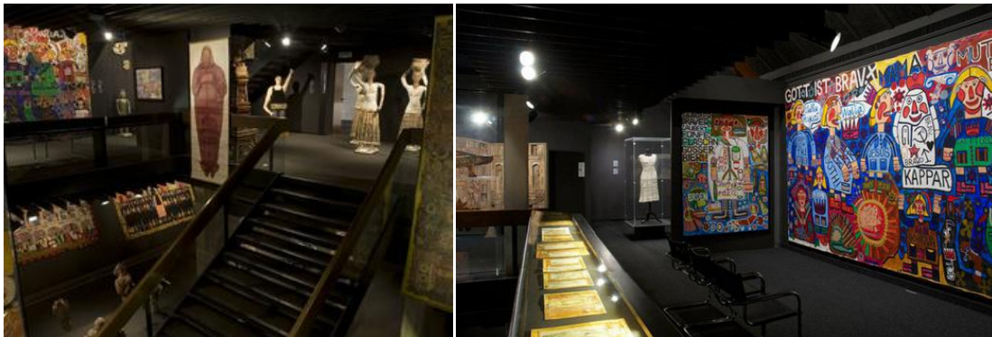
Fig. 9 Dos salas de la Colección Art brut Lausana, donde se aprecia el ambiente intimistas con la iluminación únicamente necesaria.