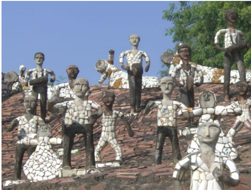
Fig. 7 Sin título. Esculturas de Nek Chand. 112x33x40 cm aprox. Hierro, cemento y trozos de cerámica.