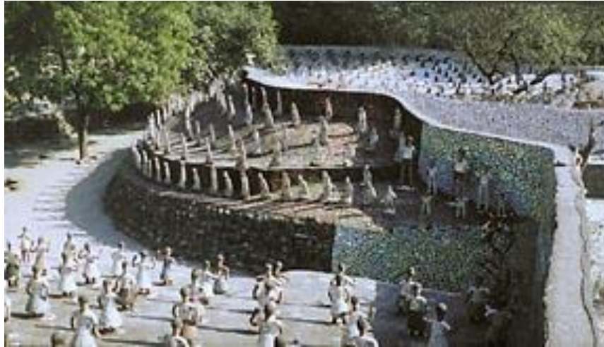
Fig. 8. Panorámica de una parte del parque Rock Garden de Chandigarh. Nek Chand fue construyendo los jardines en unos terrenos olvidados que no eran de su propiedad, transportando trozos de cerámica con su bicicleta. Tras ser descubierto por las autoridades, hoy en día es uno de los parques más emblemáticos de la zona, y es visitado por millones de personas cada año.