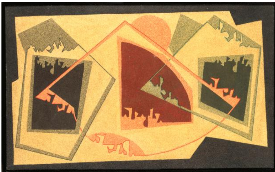
Fig. 5. Francis Palanc, Amor aislado . 1954. Cascaras de huevo trituradas y laca sobre madera.