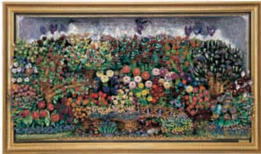
Fig. 6 Paul Amar: “Parque florido”, 1981. Ensamblaje de conchas y laca (bajo relieve). 84x144x35 cm. Destaca por la utilización de conchas en sus obras como material.