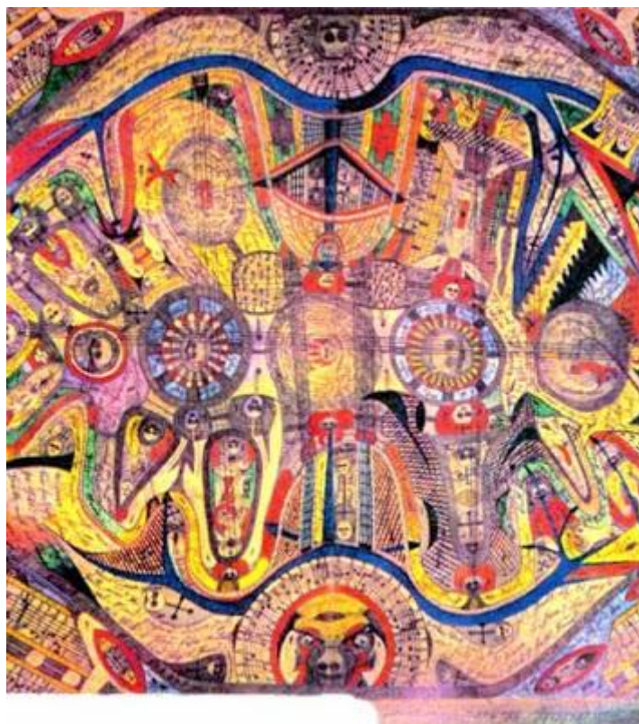
Fig. 1 Adolf Wölfli Irren-Anstalt Band-Hain, 1910. Lápices de colores sobre papel de periódico. Tras haber estado en la cárcel dos veces, fue ingresado en un hospital psiquiátrico y diagnosticado de esquizofrenia. Adolf crea composiciones muy abigarradas e intensas que llenan todo el espacio con sensación de “horror vacui”.