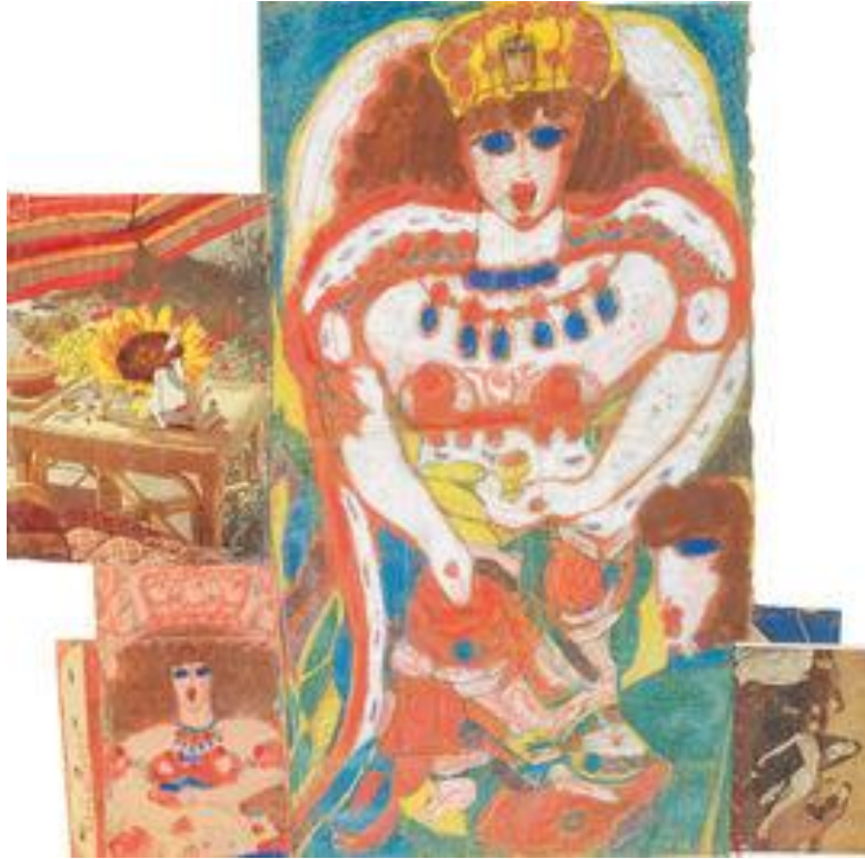
Fig.4 Aloïse: Lit à la de Coppet . Gouache, pasta de dientes, lápiz y lápices de colores sobre papel marrón reutilizado. Es un excelente ejemplo de la diversidad de técnicas empleadas y la utilización de los recursos que tenía a su alcance.