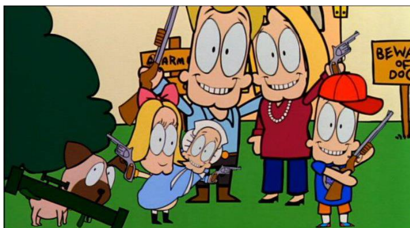
Fig. 6. Fotograma final de la animación “Breve historia de los Estados Unidos de América”, parte del metraje de Bowling for Columbine .

También se sirve de su propia presencia, como un personaje más, un narrador televisivo que expone con convicción una visión alternativa a la de los medios de masas. 82 Valiéndose a su vez de animaciones sarcásticas 83 para ejemplificar conceptos abstractos -como el caso de la breve historia de américa en Bowling for Columbine , Fig. 6-. Y empleando técnicas del videoclip -en donde había trabajado por motivos políticos, apoyando a grupos como Rage Against the Machine -, que confieren a la película un ritmo meditado y eficaz, enfrentando la evidencia de una imagen que por sí misma tiene un significado y transformándola con música que declama lo contrario. 84