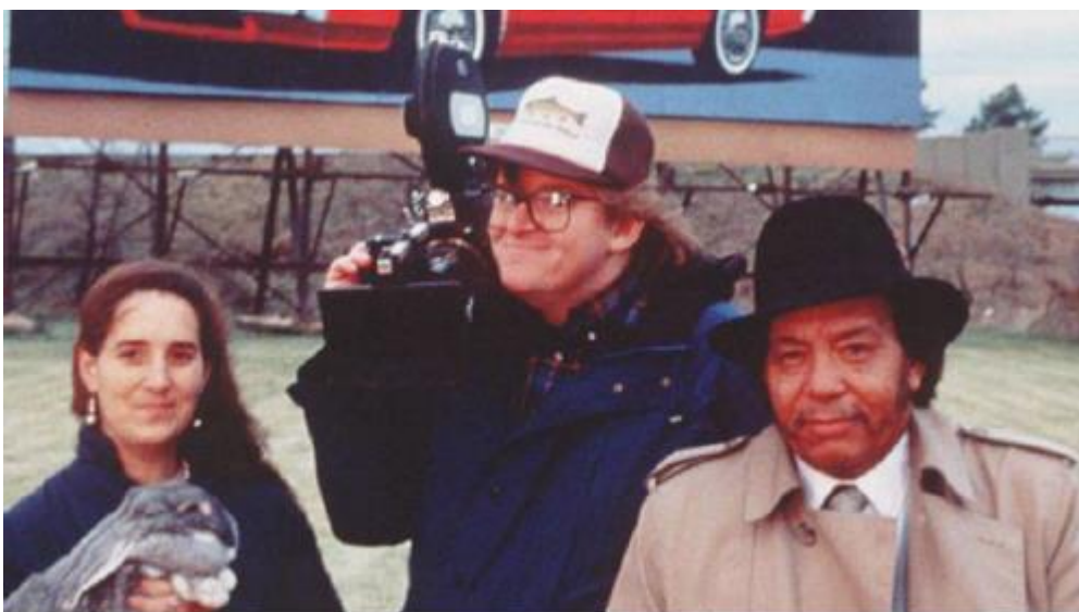
Fig. 2. Instantánea del rodaje de Roger and Me (1989).

Más adelante nos ocuparemos de los rasgos técnicos de su estilo, ilustrándolos en