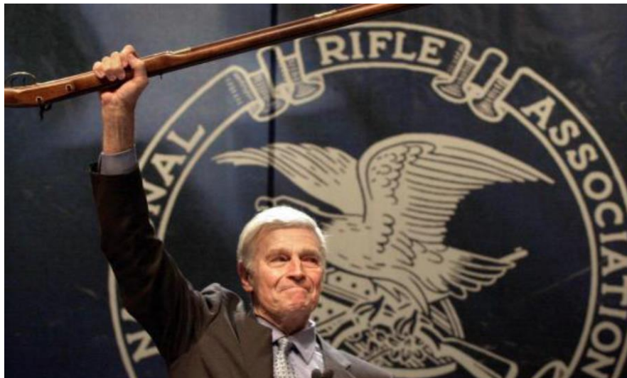
Fig. 5. Charlton Heston presidiendo una convención de la A.N.R. (1999).

Ridiculizan a individuos y organizaciones como la ANR, 76 -Fig. 5- con vistas a evidenciar lo grotesco de la defensa de las armas, y, sin embargo, encuentra aquí su gran paradoja. 77 Exalta una apología antimilitarista transformando su propia película en un arma.