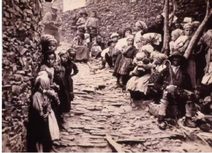
Fig. 3. Fotograma de Las Hurdes (1933) de Buñuel.

Todo esto, a la par que sus características específicas, lo inscribe directamente en el contexto del resurgir documental desde los años ochenta, 64 y su papel en la lucha política activa en el s. XXI.