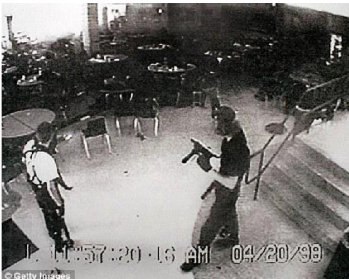
Fig. 8. Imagen de archivo. Dylan Klebold y Eric Harris, asesinos de Columbine, el día de la masacre.

El hecho marcó un antes y un después en la sociedad estadounidense, y posiblemente en la historia del crimen. Numerosos reportajes, películas de ficción como Elephant (2003), 102 y reflexiones públicas se realizaron al respecto.