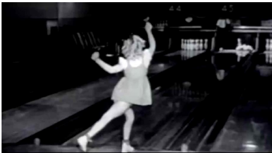
Fig. 7. Fotograma de archivo montado al ritmo de Take the skinheads bowling .

Estos mecanismos son quizás meros ejemplos que desvelan la certeza de que la