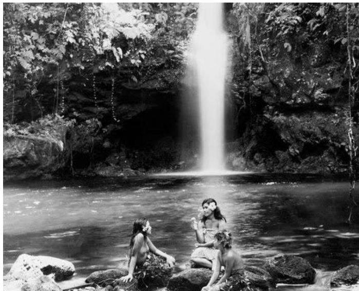
Fig. 1. Fotograma de Moana (1926) de Flaherty.

El término documental proviene de la voz inglesa documentary acuñada por John Grierson, uno de los padres del género, en 1926, en un comentario alusivo al film Moana de Flaherty (1926) -Fig. 1-. Dicha palabra parte a su vez de documentarie , que designaba en francés a los filmes de viajes. Y en última