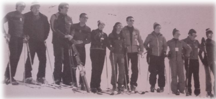
Primer cursillo de esquí en Astún (1977)