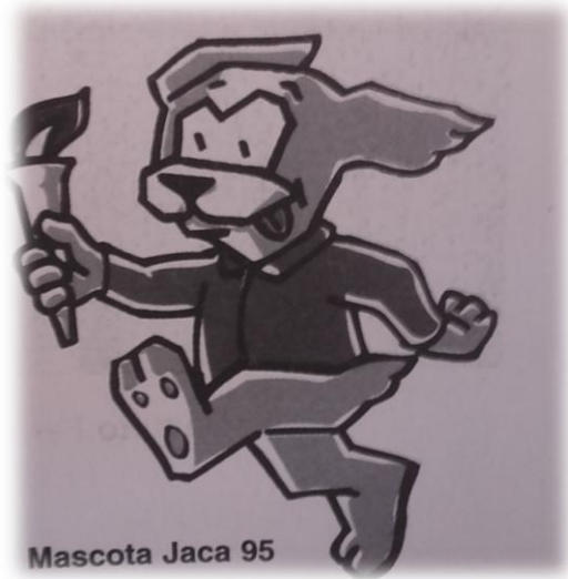
Mascota Universiada de 1995