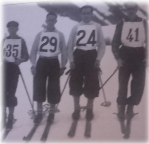
Primeros esquiadores en Candanchú. Equipo de esquí de Tolosa (1931)