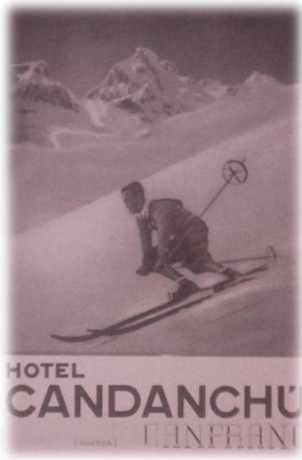
Publicidad Hotel Candanchú