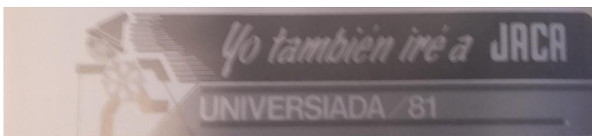
Logotipo Universiada de 1981