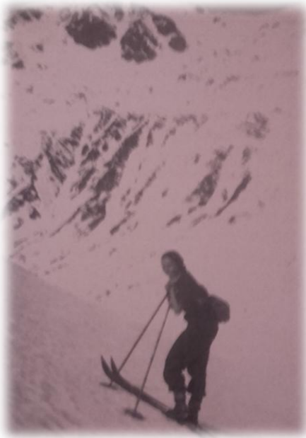
Primera mujer que subió a la Raca (1933)