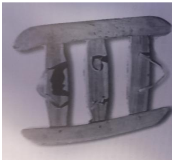
Raquetas antiguas de la Jacetania (1900)