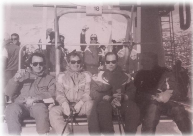
Inauguración Telesilla Canal Roya (1968)