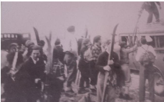
Línea de autobuses Jaca Candanchú (1936)