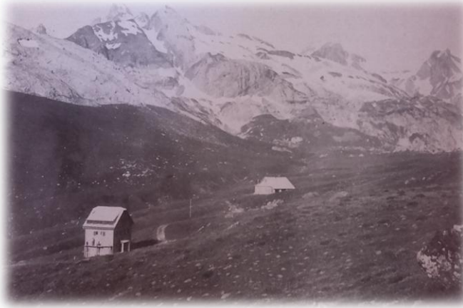
Hotel Somport. Al fondo, Refugio Montañeros de Aragón (1930)