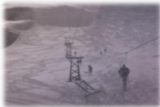
Antiguo arrastre (años 60)