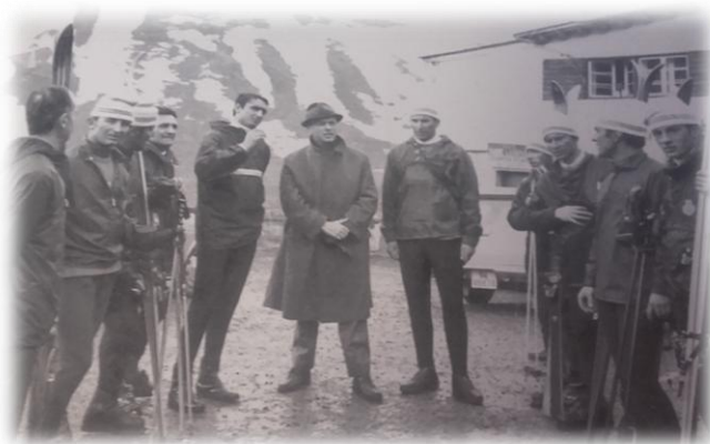
Manuel Fraga con los monitores de Candanchú (1965)