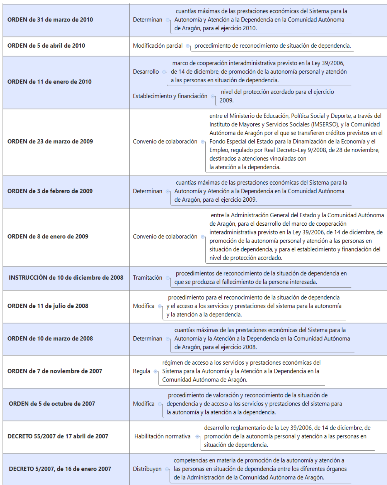
Tabla 13. Normativa sobre dependencia en Aragón de 2007 a 2010.

Elaboración propia. Fuente de datos: Gobierno de Aragón. Normativa de Aragón sobre Dependencia.