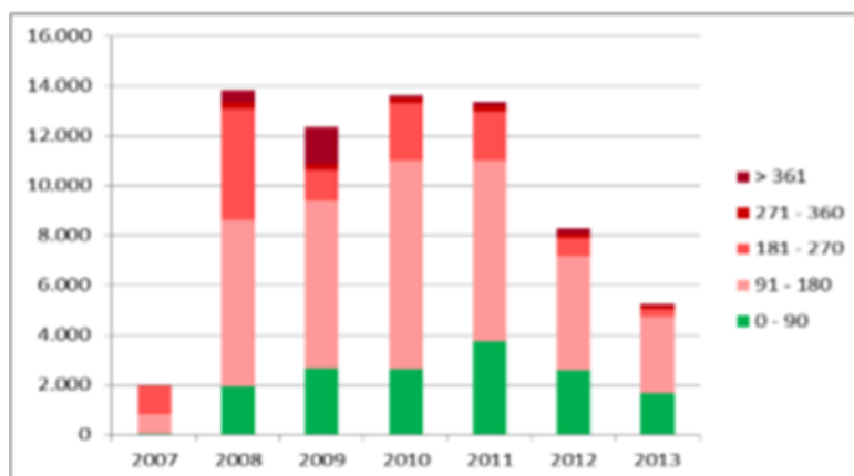
Gráfica 15. Distribución en función de la duración de la tramitación de los expedientes en Aragón. Periodo 2007-2013.

Fuente de datos: Cámara de Cuentas Aragón.