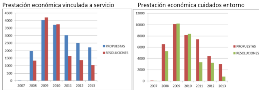
Gráfica 16. Distribución de propuestas y resoluciones de prestaciones económicas. Periodo 2007-2013.

Fuente de datos: Cámara de Cuentas Aragón.