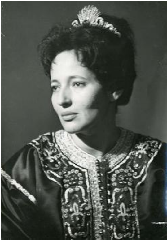
Princesa Lalla Aicha

Anexo 1: Fotografías de la princesa Lalla Aicha, hija del rey Mohamed V y Malika el Fassi. Mujeres luchadoras en el movimiento nacionalista marroquí.