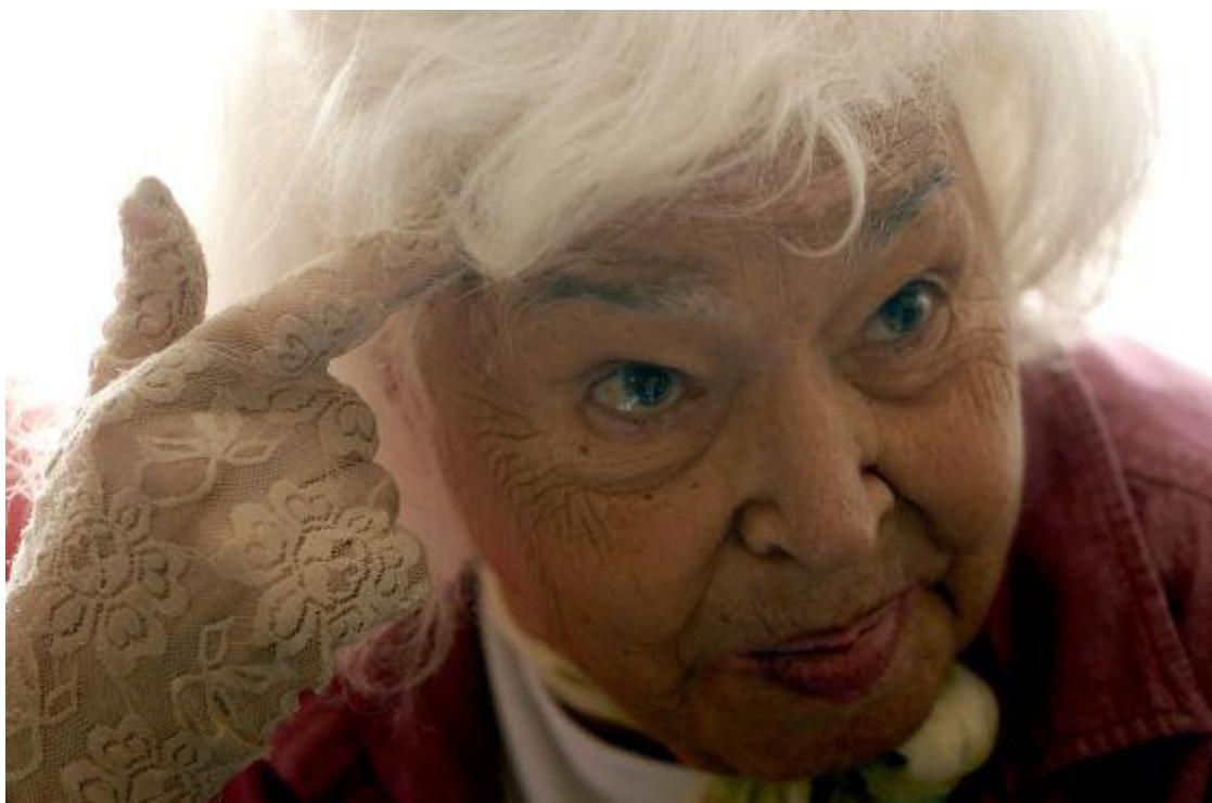
Nawal al Saadawi, durante su visita a Madrid.

Anexo 12: Actualidad (26 de septiembre de 2015) Entrevista a Nawal al- Saadawi extraída por el periódico El País 37 .