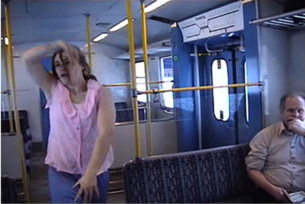
Paralyzed , Klara Lidén (2003)

permanece impasible ante las amenazas de golpe, el público que presencia la performance de Lidén termina obviando la estrafalaria conducta de la artista y actuando como si nada pasase ante ellos. Por lo que Paralyzed parece no ir más allá de violentar al público, ya que no ejerce una violencia realmente transformadora en ellos. Como su mismo título anuncia, el efecto de su intervención resultará ser precisamente aquello que en un principio la artista pretende retar: la paralización de los viajeros.