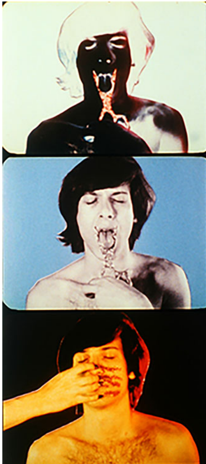
T:O:U:C:H:I:N:G , Paul Sharits (1969)

su contenido, al presenciar el “vaciado” de esas mismas imágenes que realizan los monocromos y al ser expuesto al trepidante ritmo de la alternancia de fotogramas de diferentes naturalezas.