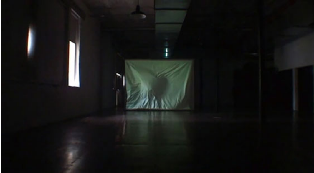
Punch Screen , Patrick Laffont (2009)

[...] nuestra mirada de participaciones en el festival omnipresente de la tecnología está [...] involucrada en perpetuar la compatibilidad de nuestros sensoriums con los métodos de interpelación predominantes. Estas interpelaciones nos alcanzan no sólo llamándonos a la identificación en el sentido althusseriano sino convocándonos a ritmos, a deseos, a afectos (Beller 1994, p. 31).