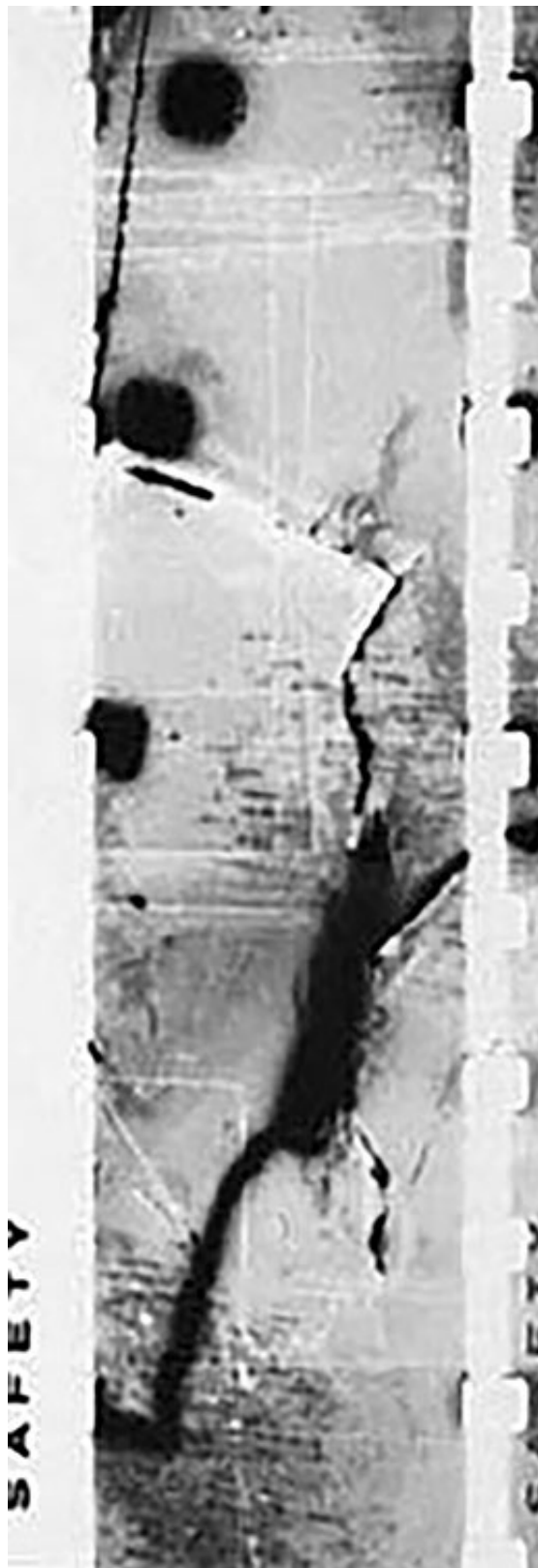
4x Attack , Tony Conrad (1972)