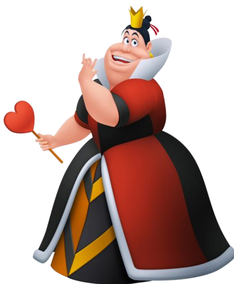
Figura 3: La Reina de Corazones