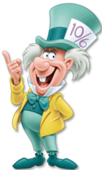
Figura 6: Sombrero