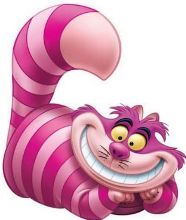
Figura 4: Gato Cheshire