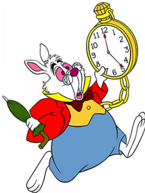
Figura 2: Conejo Blanco