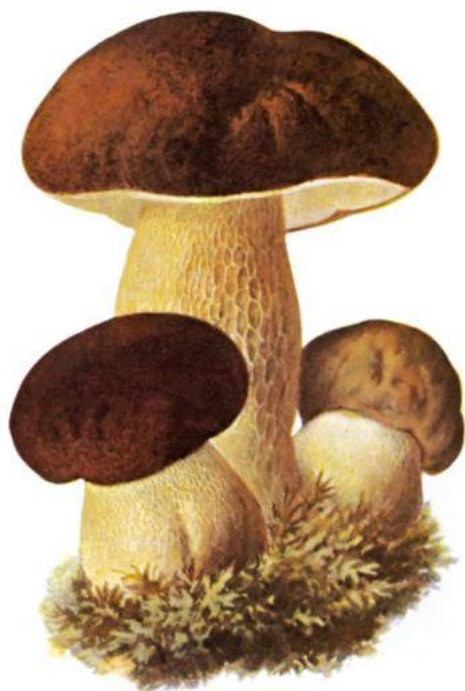
Figura 5: Seta