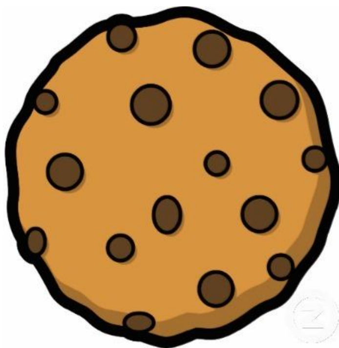
Figura 7: Galleta