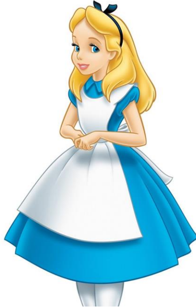
Figura 1: Alicia