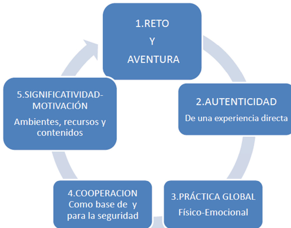
Figura 3. Principios de la metodología del juego y el reto de aventura. Basado en Gómez Encinas (2008).

En términos generales la metodología actividades de reto y aventura se resume en la siguiente la figura (figura 3):