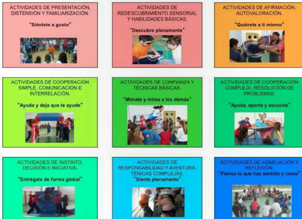
Figura 6: Pasos metodológicos de la Pedagogía de la Aventura (Parra 2001:104).

Desde la perspectiva de las habilidades sociales, es necesario que seamos capaces de transmitir y comunicar, de cooperar y confiar con el resto de participantes. Esto se podrá conseguir a partir de actividades de confianza y cooperación simple y compleja.