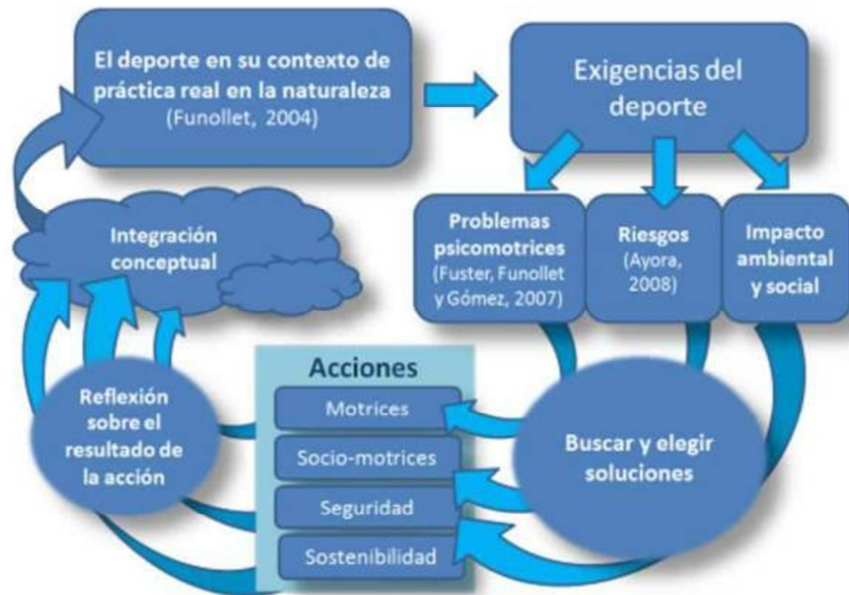
Figura 4. Modelo integrado de proceso de enseñanza de los deportes en la naturaleza. Adaptado de Devís y Peiró (2007:143).

Otro elemento que se tiene muy en cuenta en esta metodología y que a la supone ser recurso es la gestión del riesgo , ese factor intrínseco y a la vez subjetivo de las AMN. La clave está en controlar y gestionar el riesgo, lo que supondrá la clave de éxito de la propuesta de aprendizaje. Por lo tanto el factor riesgo en esta metodología es visto como un elemento a enseñar, transmitir y que los alumnos deben aprender, con el fin de dotarles de las herramientas suficientes para superarlo. Para ello esta propuesta se apresura en acelerar el momento de interiorización de aspectos de seguridad que poseen estas prácticas deportivas.