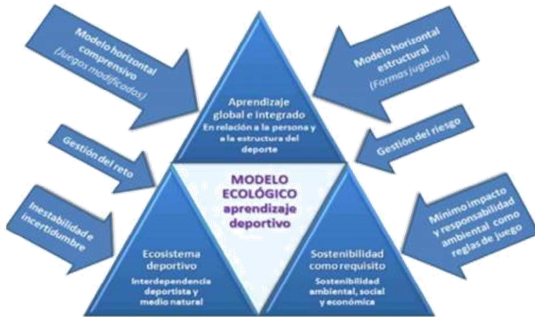
Figura 5. El modelo ecológico de aprendizaje deportivo en los deportes en la naturaleza. Tomado de Pérez Brucardi (2012:147).