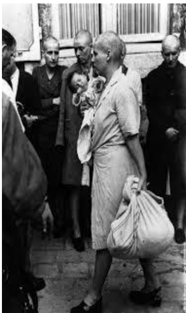
Colaboradoras del régimen nazi pagando sus crímenes. Izq. Mujer a punto de ser rapada por los miembros de la Resistencia en Francia. Drcha. Mujer ya rapada regresando a su hogar con su hijo de padre alemán en brazos.