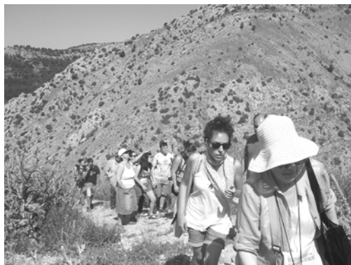
Figura 1. Alumnos del I Curso de Pintura Miradas y Territorio. Subida al castillo de Alcalá de la Selva (Teruel, 2011)

“En estas excursiones se atiende al desarrollo físico de los alumnos por medio de largas caminatas, ascensiones y ejercicios varoniles que dan vigor al cuerpo, al mismo tiempo que energía moral y temple al alma; estudian directamente los objetos naturales y el territorio como teatro vivo de la actividad humana (...)” (Torres Campos, 1882: 188).