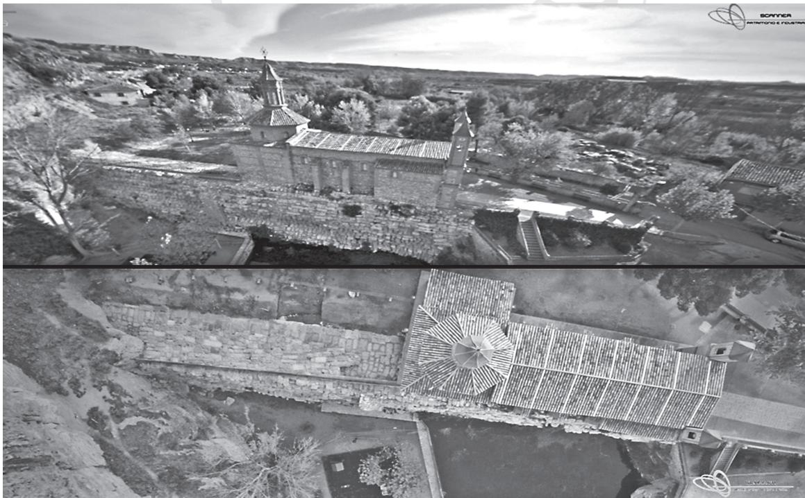
Fig. 2. Vue et contexte d'implantation du barrage de Muel (Scanner Patrimonio e Industria).