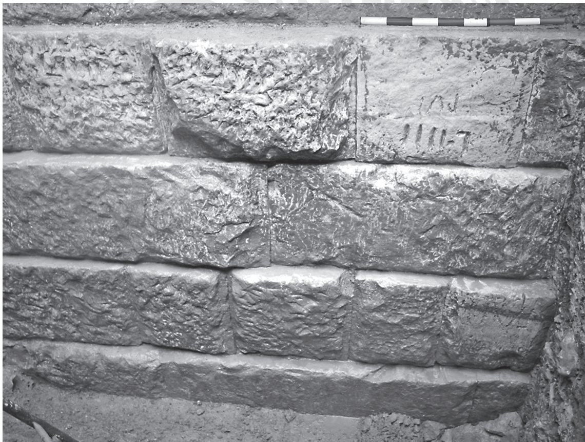
Fig. 3. Détail de la paroi intérieure : opus quadratum avec inscriptions.

En nous basant exclusivement sur l'analyse hypsométrique de la zone située en amont de la retenue romaine, nous sommes arrivés à la conclusion selon laquelle le barrage pouvait s'étendre sur un terrain d'environ 80 ha. En observant une photographie aérienne du secteur (fig. 2), nous voyons qu'en amont de la retenue s'étend une vallée fertile embrassée par La Huerva sur sa rive orientale et composée de petits terrains de culture de fruits et légumes disposés sur une zone parfaitement plane de forme allongée, qui remonte sur 2 km, et une largeur d'à peine 400 m le long de la vallée. Nous pensons que l'actuelle vallée a été formée par les terres colmatées dans le bassin du barrage.