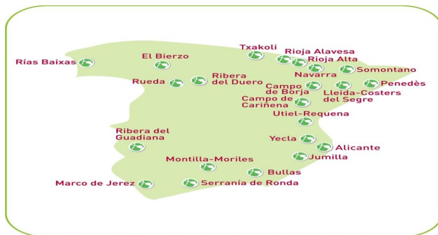
Figura 2: Rutas de España.

Después de 15 años se ha podido fortalecer una marca turística de calidad, con un referente nacional cuando se habla de enoturismo. Gracias al sostén de la Administración del Estado, de los Ministerios de Turismo y Agricultura, de los agentes del sector y de los medios de comunicación. Cuando empezó el proyecto existían seis destinos enoturísticos, y cada día se han unido mas rutas del vino, en la actualidad existen 23 rutas del vino certificadas en España, y muchos destinos que trabajan para integrarse en la asociación.