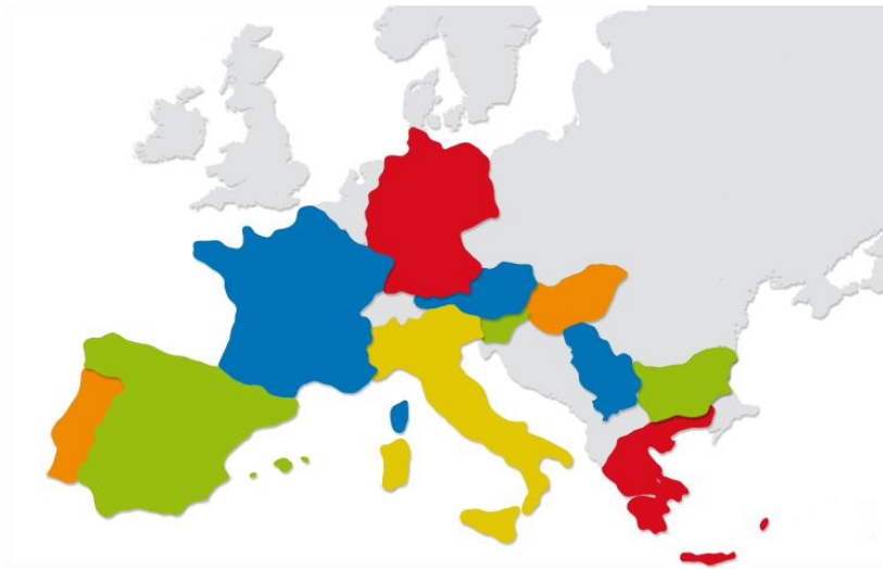
Figura 1: Países Europeos que pertenecen a Recevin.

La red RECEVIN tiene el sostén de las Asociaciones Nacionales del Vino que están presentes en los 11 países miembros (Alemania, Austria, Bulgaria, Eslovenia, España, Francia, Grecia, Hungría, Italia, Portugal y Serbia) en las que están incluidas 800 ciudades de toda Europa.