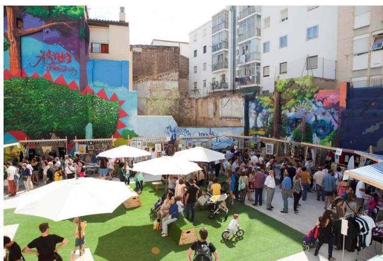
Figura 11. Asalto Fair Fuente. Festival Asalto