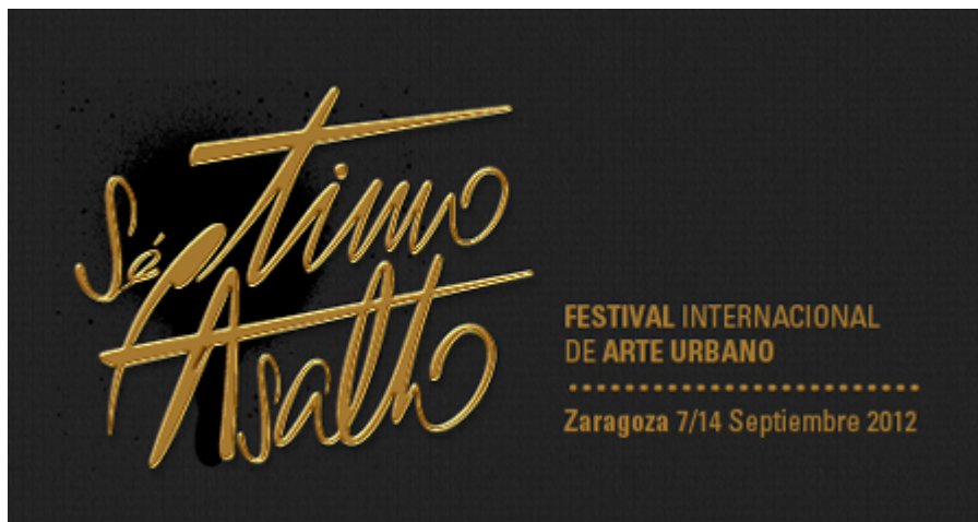
Figura 8. Cartel Séptimo Asalto

El séptimo asalto se celebró en 2012 en espacios públicos como la plaza del Pilar, la plaza interior del Centro de Música de las Armas, la calle Libertad o la plaza San Pedro Nolasco, puntos de encuentro donde se llevaron a cabo las intervenciones artísticas.