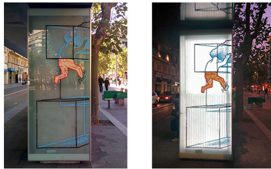
Figura 12. Intervención de DaanBotlek en las paradas de tranvía en el Décimo Asalto

Una de las novedades de esta edición fue la iniciativa “Parada: Asalto”. Diferentes artistas decoraron las láminas luminosas de las marquesinas de la línea del tranvía. Un recorrido de 12.8 kilómetros desde el Actur a Valdespartera que convierten a este trayecto en una galería de arte al aire libre. Se ha tratado de una obra efímera ya que después de las Fiestas del Pilar han desaparecido.