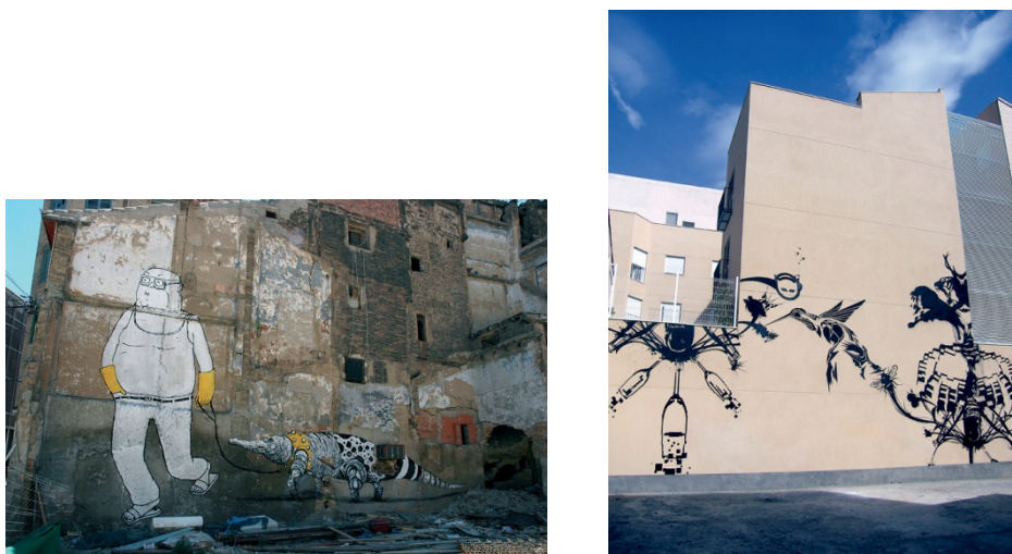
Figura 2. Intervenciones de Blu + San y Dizel&Sate en el Segundo Asalto. Fuente. Festival Asalto

La intención de esta edición estaba motivada por el estado de abandono que demostraban determinadas zonas del casco y dotarles de una identidad por medio de los murales, devolviéndoles su presencia en el entorno urbano y mejorar el paisaje de esas zonas.