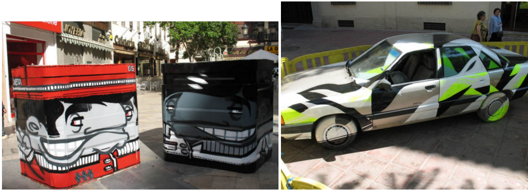
Figura 1. Intervenciones de Akroe+ Krsn y Zeta en el Primer Asalto.