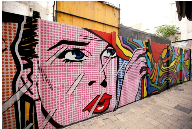
Figura 5. Intervención de 310 Squad en el Quinto Asalto