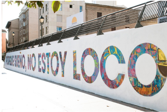
Figura 9. Intervención de Boa Mistura en el Séptimo Asalto