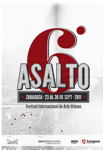
Figura 6. Cartel Sexto Asalto