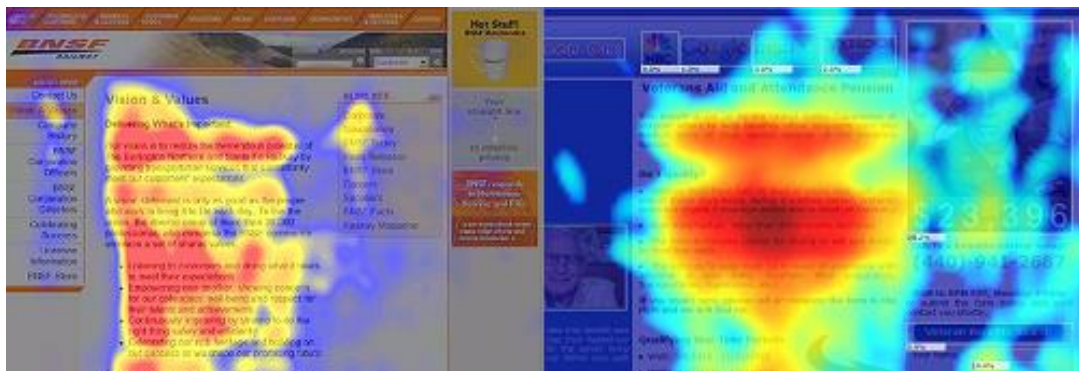
ILUSTRACIÓN 2: EYETRACKING VS MOUSETRACKING.

Existen métodos para analizar el comportamiento del consumidor. El "mousetracking" es un método por el cual los propietarios de una web invitan a un cliente potencial a analizar su página web para ver cuáles son los sitios donde se dirigen más con el ratón. Podrán comprobar si el botón de compra es visible y funciona correctamente o si les parece entretenida e invierten más tiempo en navegar por la página, etc. Por otra parte, existe el método "eyetracking" mediante el cual se analiza hacia dónde va la mirada del consumidor (Clicktale Blog, 2010). Normalmente los consumidores tienden a mirar primero las imágenes, luego los títulos y finalmente los textos (Visser y Sikkenga, 2012) Véase Ilustración 2.