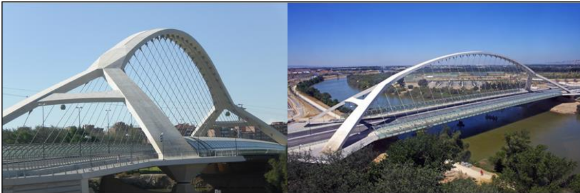
El Puente del Tercer Milenio es el mayor puente de arco en hormigón suspendido del mundo.