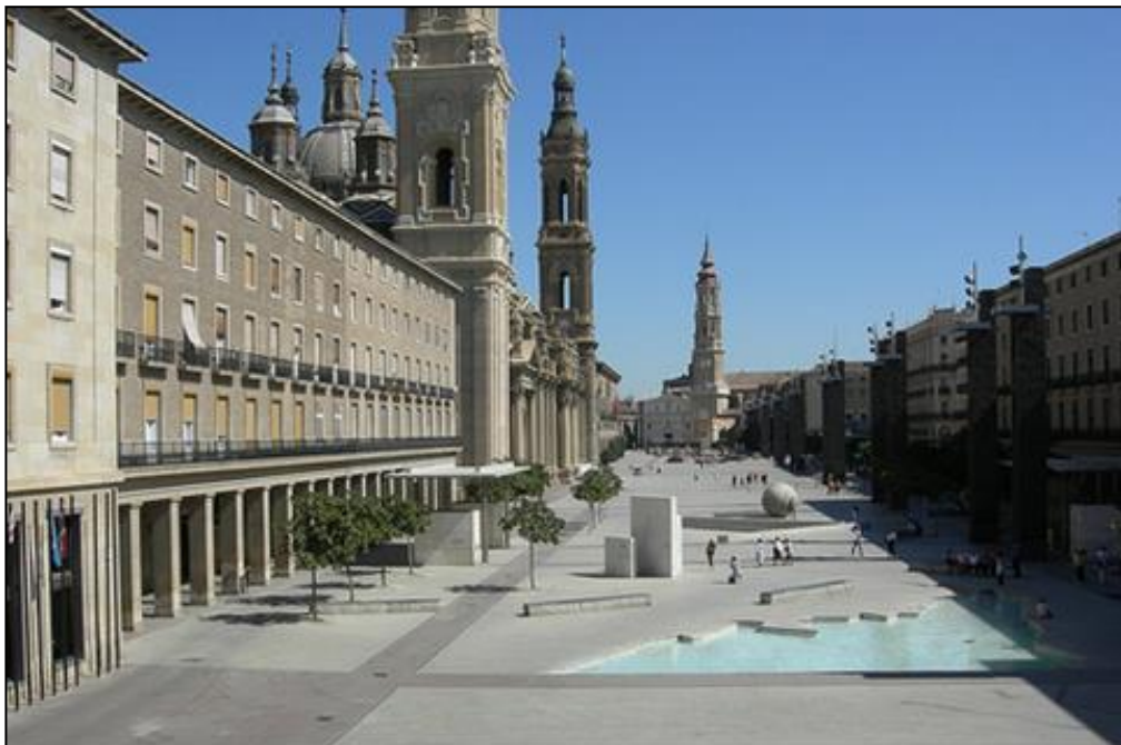
La Plaza del Pilar es una de las plazas peatonales más grandes de Europa.