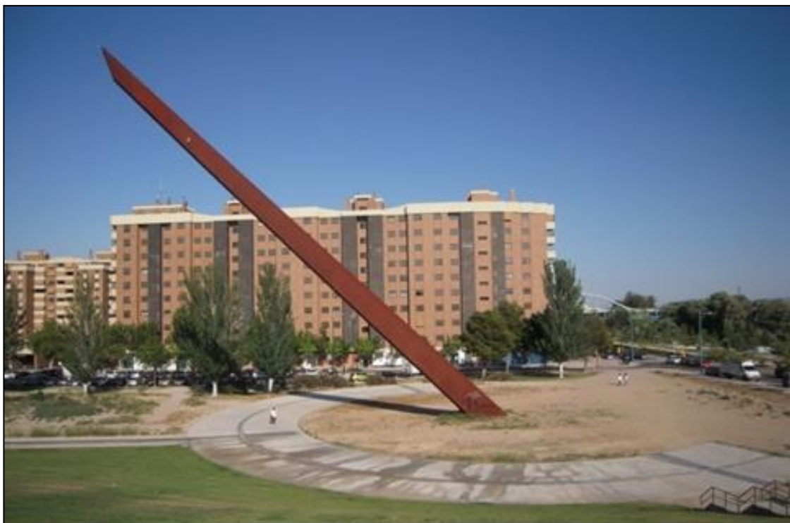
Zaragoza cuenta con el reloj solar más grande y preciso del mundo, situado en Vadorrey.