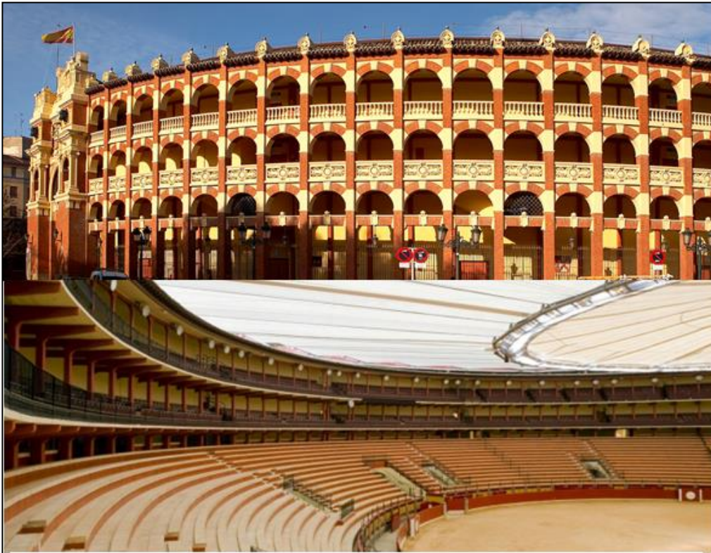
La Plaza de Toros de Zaragoza es la 2º más antigua del país (1764).