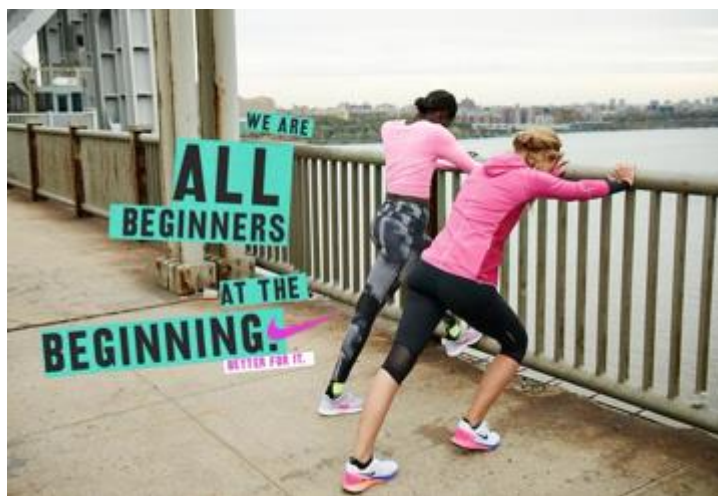
Imagen 2.5. Campaña Better for it de Nike