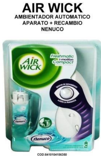
Imagen 2.1. Ambientador Airwick