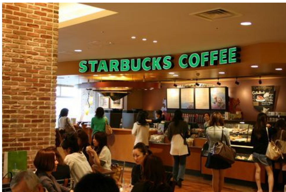
Imagen 2.7. Tienda Starbucks