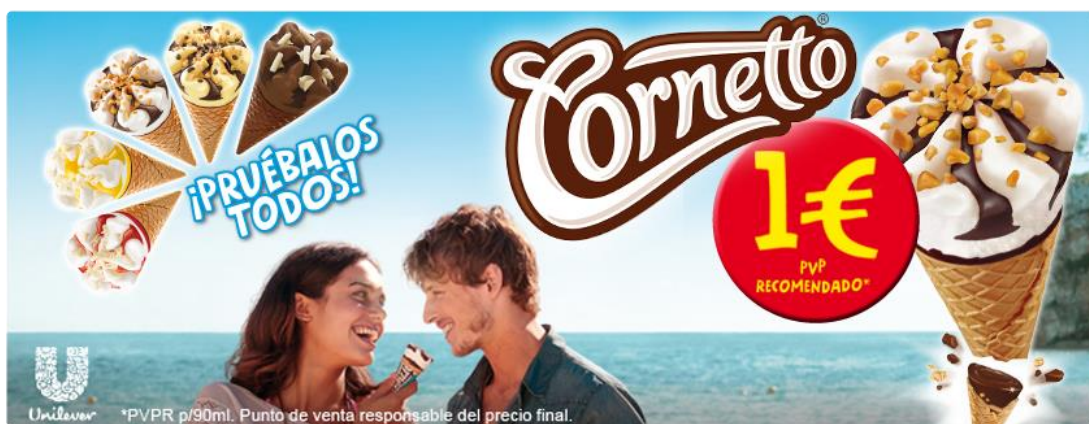
Imagen 2.3. Anuncio TV helado Cornetto (Anexo)