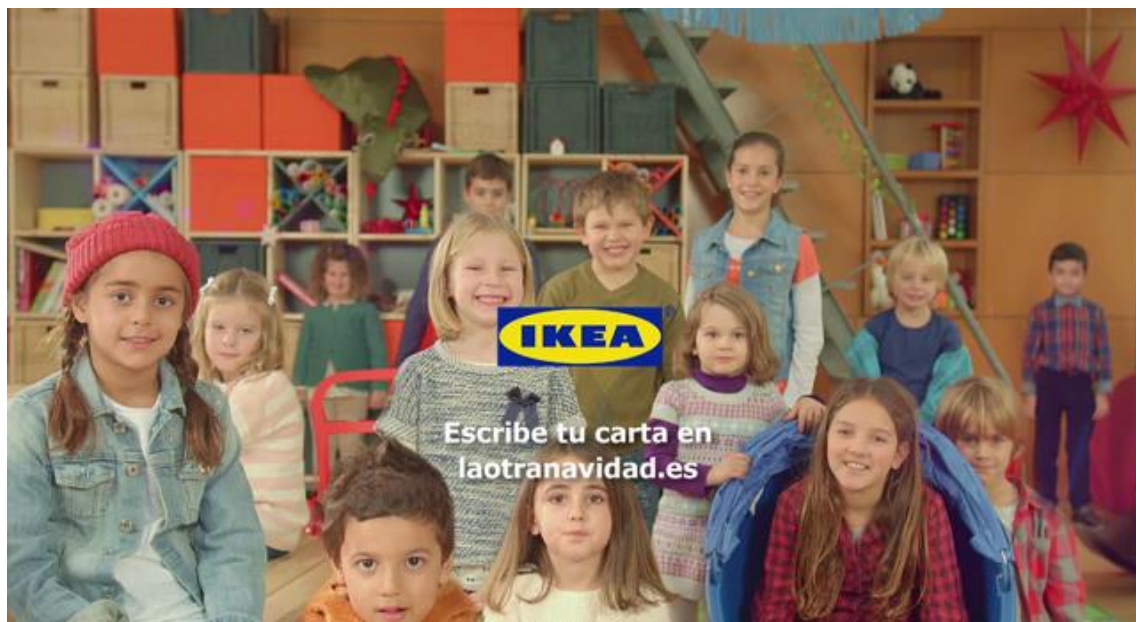
Imagen 2.6. Campaña IKEA La Otra Navidad