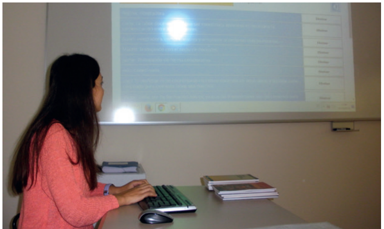
Imagen 2. Alumna haciendo uso creativo de los recursos

Por otro lado, hay que destacar la importancia del aprendizaje metodológico que nuestro alumnado, futuro docente, ha realizado. Los estudiantes desconocían esta metodología. La vivencia directa desde el rol discente de la inversión de la clase ha favorecido la comprensión de sus bondades, lo que aumenta la predisposición y conocimiento para su futura